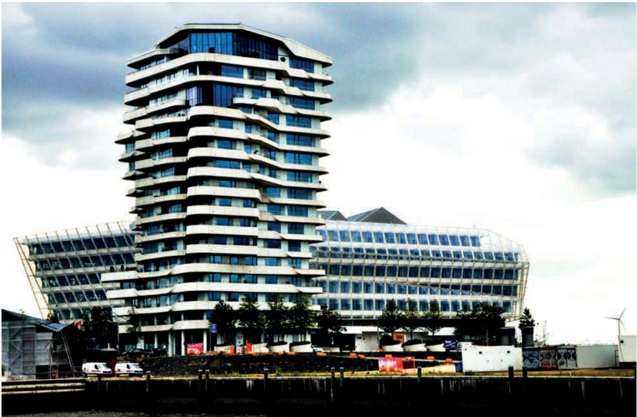
Il. 4. Unilever-Haus (2009 r.) – biurowiec autorstwa Behnisch Architekten usytuowany w Hafencity bezpośrednio nad brzegiem Elby. Budynek formą swą przypomina duży statek wycieczkowy. Kompozycję nabrzeża dopełnia wieża mieszkalna Marco Polo projektu Behnisch Architekten , zlokalizowana w bezpośrednim sąsiedztwie biurowca