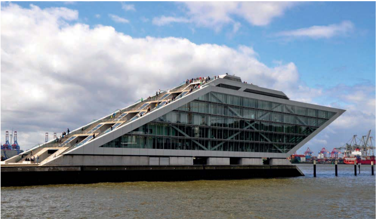
Il. 2. Dockland (2006 r.) – autorstwa niemieckiego biura BRT Architekten , zlokalizowany w dzielnicy Altona-Altstad ze względu na lokalizację oraz formę architektoniczną, której motywem był dziób statku, jest jednym z najbardziej rozpoznawalnych hamburskich budynków biurowych