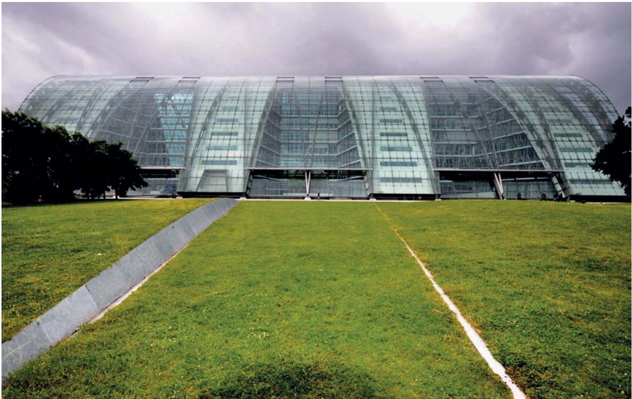
Il. 6. Biurowiec Berliner Bogen (2012), projektu BRT Architekten przy Anckelmannsplatz we wschodniej części Hamburga. Zewnętrzna szklana fasada oparta na stalowych łukach przykrywa wewnętrzną grzebieniową formę, tworząc strefy dla sześciu symetrycznych atriów