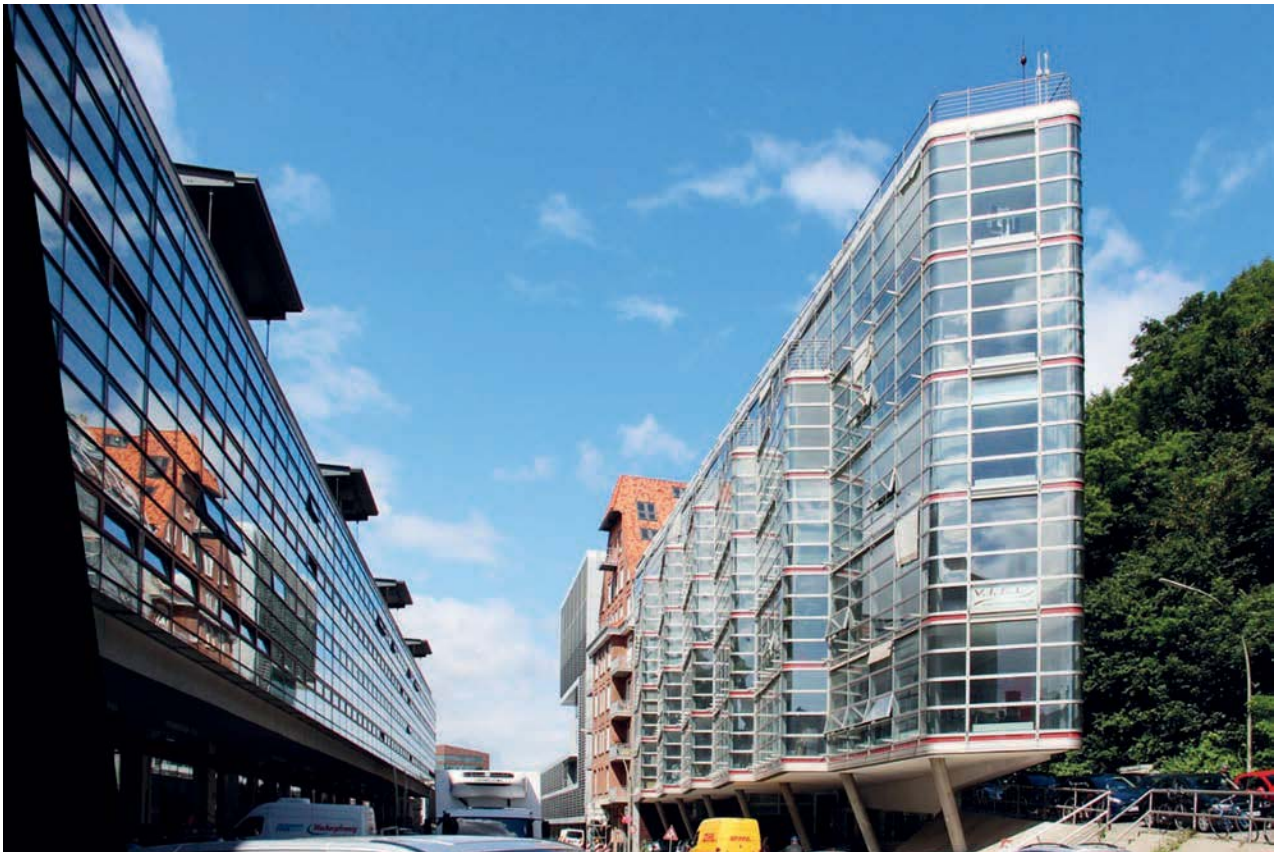
Il. 10. Biurowiec Lofthaus am Elbberg (1997 r.), projektu: BRT Architekten zlokalizowany w dzielnicy Altona w Hamburgu. Wąska trapezowa działka, sąsiedztwo nabrzeża oraz terenów rekreacyjnych zdeterminowały formę i elewację biurowca (fot. Maciej Złowodzki, 2014)