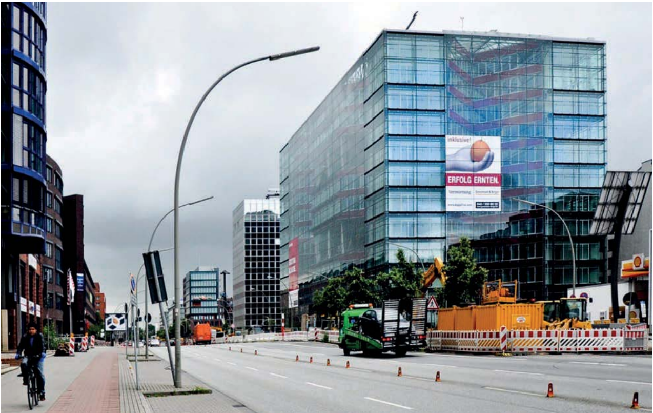
Il. 5. Budynek Doppel XX (1999 r.) – autorstwa BRT Architekten , we wschodniej dzielnicy Hammerbrook to biurowiec o nietypowej formie dwóch iksów, osłonięty szklaną powłoką