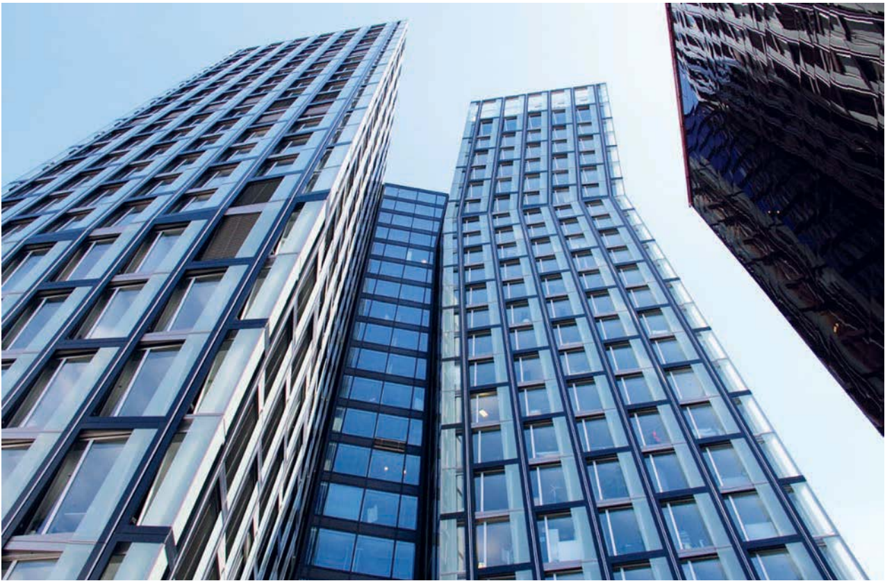
II. 9. Tanzende Türme (2012 r.) – biurowiec zaprojektowany przez biuro architektoniczne BRT Architekten w dzielnicy St. Pauli (fot. Maciej Złowodzki, 2014)