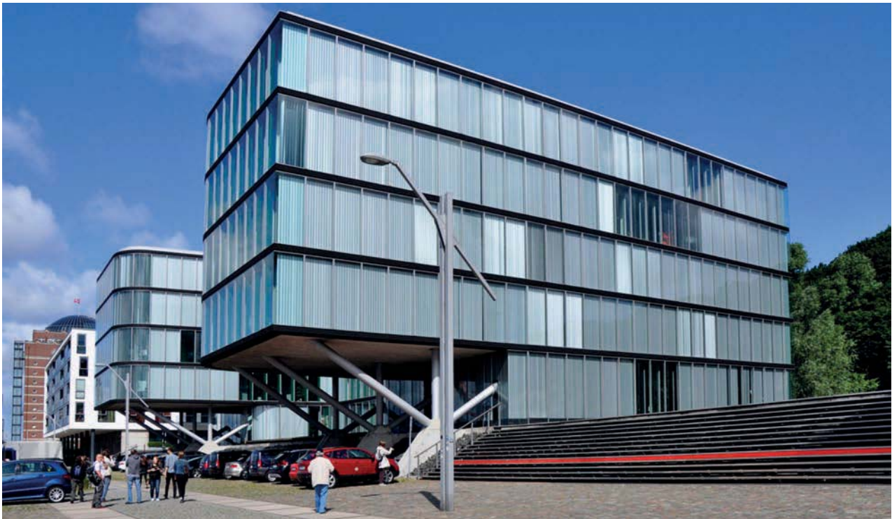
Il. 3. Budynek Neumühlen 19 (2002 r.) – autorstwa niemieckiego biura BRT Architekten , usytuowany w dzielnicy Altona , przy nabrzeżu Łaby jest przykładem przebudowy terenów nadwodnych w kierunku funkcji biurowej