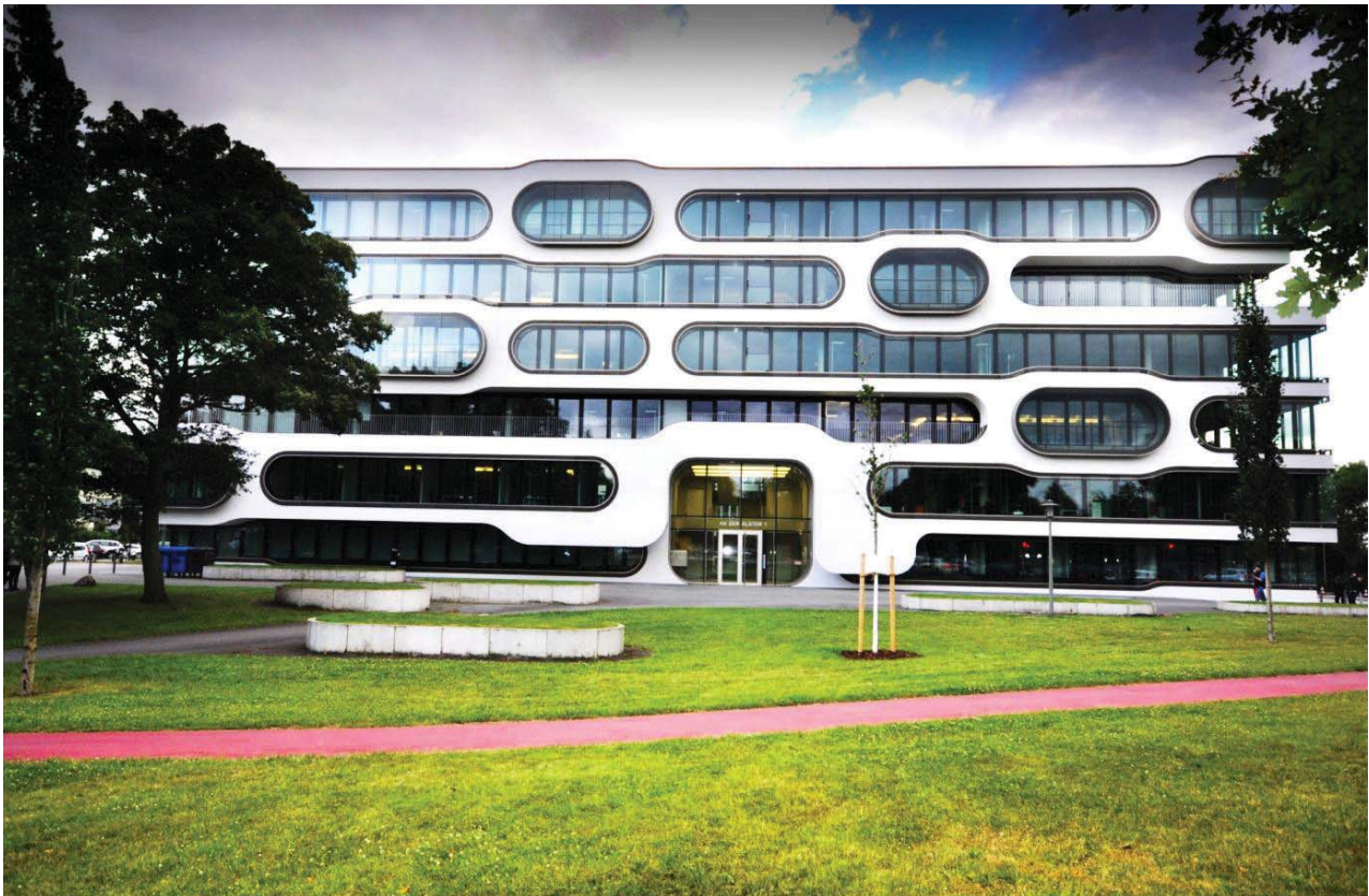
Il. 8. ADA1 – Office Complex (2007) – budynek biurowy projektu J. Mayer H. und Partner Architekten zlokalizowany w dzielnicy St. Georg. (fot. Katarzyna Zawada-Pęgiel, 2014)