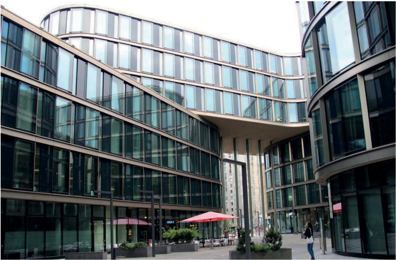
II. 7. Biurowiec LTD-1 (2008 r.) projektu Pysall Ruge Architekten , zlokalizowany w dzielnicy St. Georg w Hamburgu. Układ czterech form w kształcie bumerangów tworzy przestranny dziedziniec.