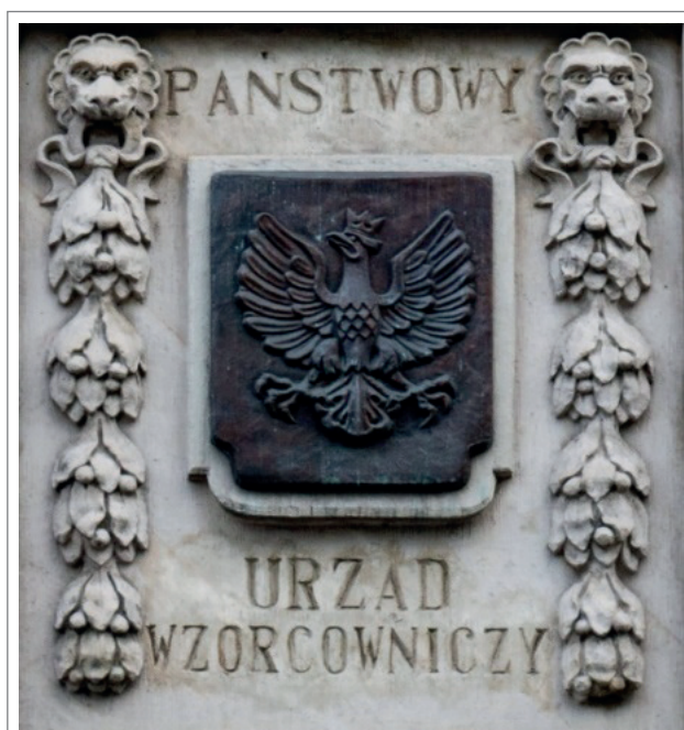
Wizerunek godła na budynku Okręgowego Urzędu Miar w Poznaniu

Stanowiska pomiarowe, pracownie, laboratoria kształtowały się przez lata. Dzisiaj Okręgowy Urząd Miar w Poznaniu dysponuje wyposażeniem pomiarowym pozwalającym na świadczenie usług w szerokim zakresie w wielu dziedzinach pomiarowych. Jako jeden z nielicznych OUM wykonuje wzorcowanie takich przyrządów pomiarowych jak: analizatory parametrów sieci, testery bezpieczeństwa elektrycznego urządzeń, rotametry, luksomierze, kalibratory fotometryczne oraz instalacje pomiarowe do gazu ciekłego propan-butan.