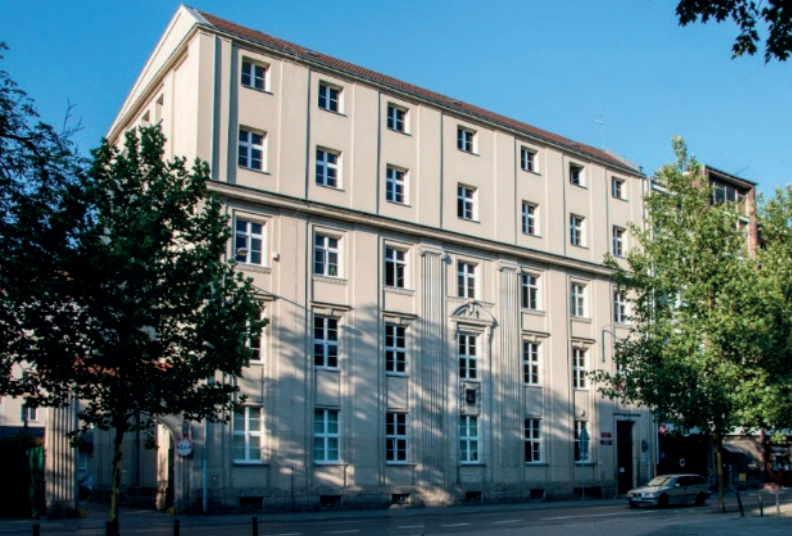
■ Budynek Okręgowego Urzędu Miar w Poznaniu

Stąły rozwój możliwości pomiarowych powoduje, że zakres usług świadczonych przez Okręgowy Urząd Miar w Poznaniu zwiększa się każdego roku.