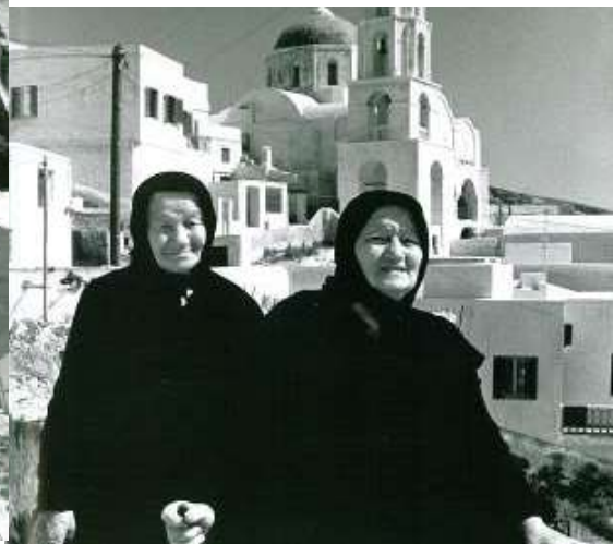
Il. 1,2,3,4 Miasteczka śródziemnomorskie, (Steven & Cathi House, Mediterranean villages: an architectural journey, The Images Publishing Group Pty Ltd 2004. )