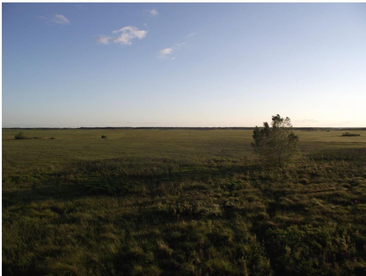
Fot. 5. Bagno Podlaskie – widok z wieży obserwacyjnej w okolicach Gugien.

W drzewostanie dominuje sosna. Występują tu torfowiska – niskie, przejściowe i wysokie (Kalicka, 2009). Środkowy basen Biebrzy z Czerwonym Bagnem jest odmiennym obszarem w stosunku do basenu południowego. Spotyka się tu znaczne obszary borów bagiennych i turzycowisk wysokich. Najatrakcyjniejszym walorem są wydmy – widok rzadko spotykany w połączeniu z bagnami. Sąsiedztwo bagiennych dolin z piaszczystymi wydmami najlepiej ukazują okolice Wilczej Góry i Tchorzych Grzęd. W obwodzie Grzędy wyznaczono trzy ścieżki dydaktyczne: czarną „Czerwone Bagno”, żółtą „Borek Bartny” i zieloną „Wydmy” oraz pięć szlaków turystycznych: czerwony, zielony, niebieski, czarny i żółty 18 . Wśród ścieżek najwyższą atrakcyjnością przyrodniczą odznaczają się: „Czerwone Bagno” – kilometrowej długości kładka przez bór bagienny, na końcu zakończona platformą widokową oraz ścieżka „Wydmy” prowadząca przez, jak wskazuje nazwa, wydmy tych terenów. Najbardziej spektakularne obserwować można poniżej uroczyska Nowy Świat, w okolicach Wilczej Góry. Śródlądowe wydmy są tutaj odsłonięte od lasu; po drugiej stronie przechodzą w obszar bagienny. Na terenie obszaru Grzędy ciekawym elementem krajobrazowym są wydmy leśne. Te, najczęściej porośnięte brzozą lub sosną wzniesienia, najlepiej ukazują góry: Partyczyna i Barwik, które znajdują się na trasie niebieskiego i czarnego szlaku.