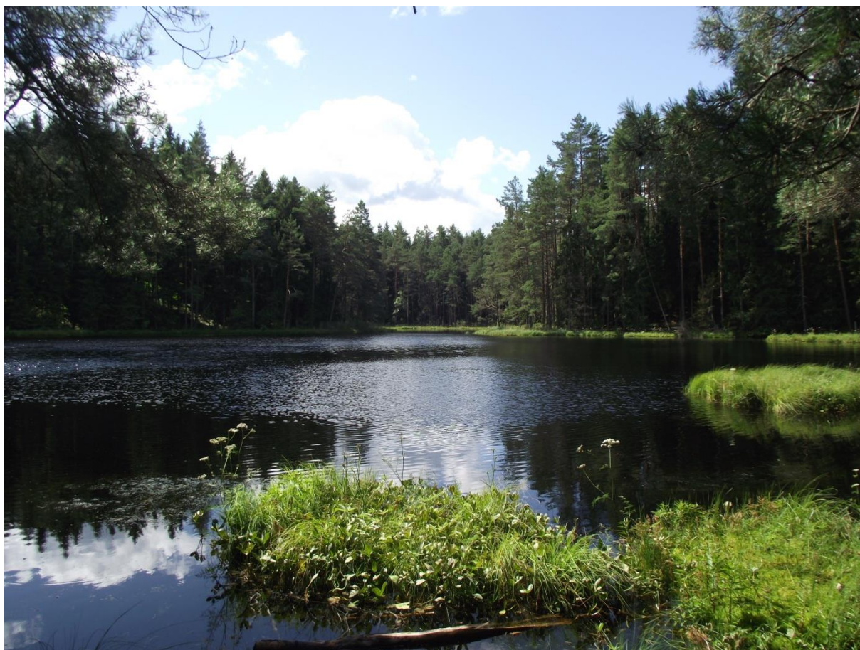
Fot. 8. Jeden z wigierskich „sucharów” w okolicy Krzywego.

stopniem żyzności wody. Wśród nich na uwagę zasługują „suchary” (Fot. 8) – śródleśne jeziora o niewielkiej powierzchni i głębokości. Nazwę „suchar” jako pierwszy wprowadził wybitny hydrolog i badacz tych ziem – Alfred Lityński. Uważa się, iż nazwa wzięła się od suchych, obumarłych drzew widocznych przy brzegach tych jezior. „Suchary” są praktycznie bezodpływowe. Brak wymienności wody oraz leśna izolacja od wiatru utrudniają filtrację cieczy. Zbiorniki te są mało żyzne. Zawierają znaczne ilości kwasów humusowych powstałych w wyniku rozkładu ściółki leśnej. Swoją brunatną barwę zawdzięczają owym substancjom. Na terenie parku znajduje się 18 tego typu zbiorników. Największym jest Suchar Wielki – 8, 8 ha, zaś najgłębszym Wądołek – 15 m. Spotyka się tu pływającego pająka topika, wiele larw ważek, muchówek czy chrząszczy (Ambrosiewicz, 2009).