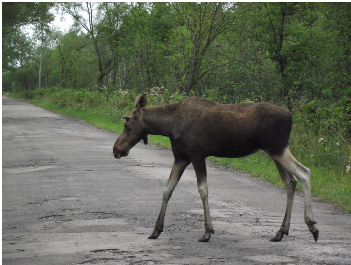
Fot. 4. Łoś na „carskiej drodze”.

Trasa długości około 3, 5 km jest w pełni sucha i dostępna. Z wieży widokowej podziwiać można największe w Polsce kompleksy torfowisk niskich ( Biebrzańskie szlaki... , 2006).