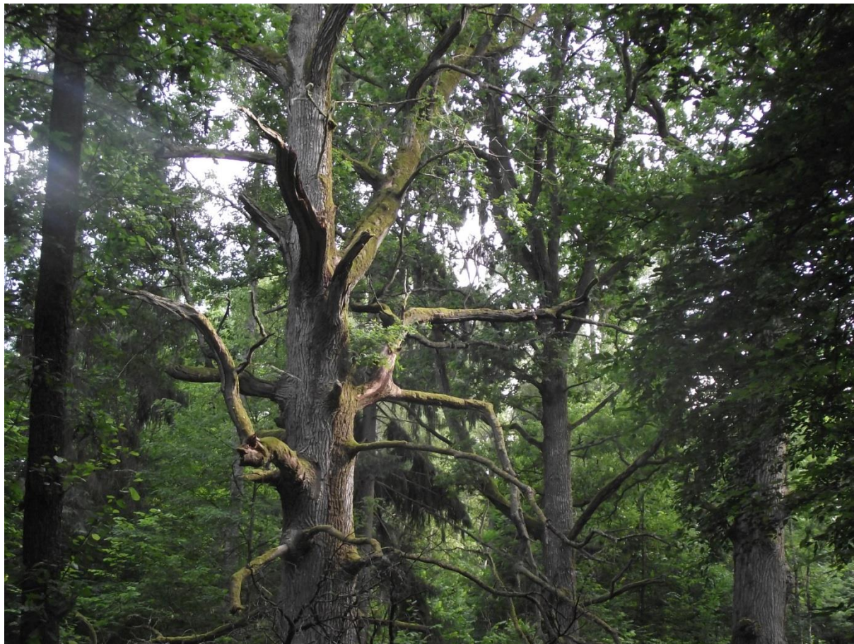
Fot. 1. Jeden z dębów na trasie ścieżki „Dęby Królewskie”.

Największą atrakcją parku jest Puszcza – najlepiej zachowany fragment lasu pierwotnego na niżu europejskim. Szczególnie cenna jest jej różnorodność. Najczęstszym typem lasu jest, występujący na żyznych glebach, grąd. Kolejne są bory świerkowe (fragment borealnego stanowiska tajgi syberyjskiej) i olsy. W większości są to lasy pierwotne – nie posadzone przez człowieka – dzięki czemu są bardziej odporne na choroby i szkodniki. Najcenniejszym przyrodniczo i naukowo fragmentem Puszczy jest obszar ochrony ścisłej parku narodowego. Symbolem Puszczy jest żubr – największy europejski ssak. Puszcza Białowieska uznawana jest za światową rezerwę reprodukcyjną tego gatunku – wszystkie obecnie żyjące żubry pochodzą z hodowli białowieskiej (Wysmułek, 1994). Najokazalszymi z drzew Puszczy są rozłożyste dęby. Na liczącej kilkaset metrów ścieżce dydaktycznej „Dęby Królewskie”, zobaczyć można kilkanaście wiekowych okazów, noszących imiona dawnych polskich władców 7 (Fot. 1). Interesującym walorem parku jest oddalone kilka kilometrów od Białowieży „miejsce mocy” – pradawne miejsce kultu Słowian, któremu przypisuje się magiczne właściwości. Potwierdziły to badania, które wykazały na tym obszarze obfitość podziemnych cieków wodnych i rzek. Efektem korzystnego działania sił przyrody jest prawdopodobnie bujna roślinność. Niektóre z drzew wyrastają z jednego pnia i dzielą się na kilka konarów. Pozostałością po dawnych pogańskich kultach są, będące elementem tegoż,