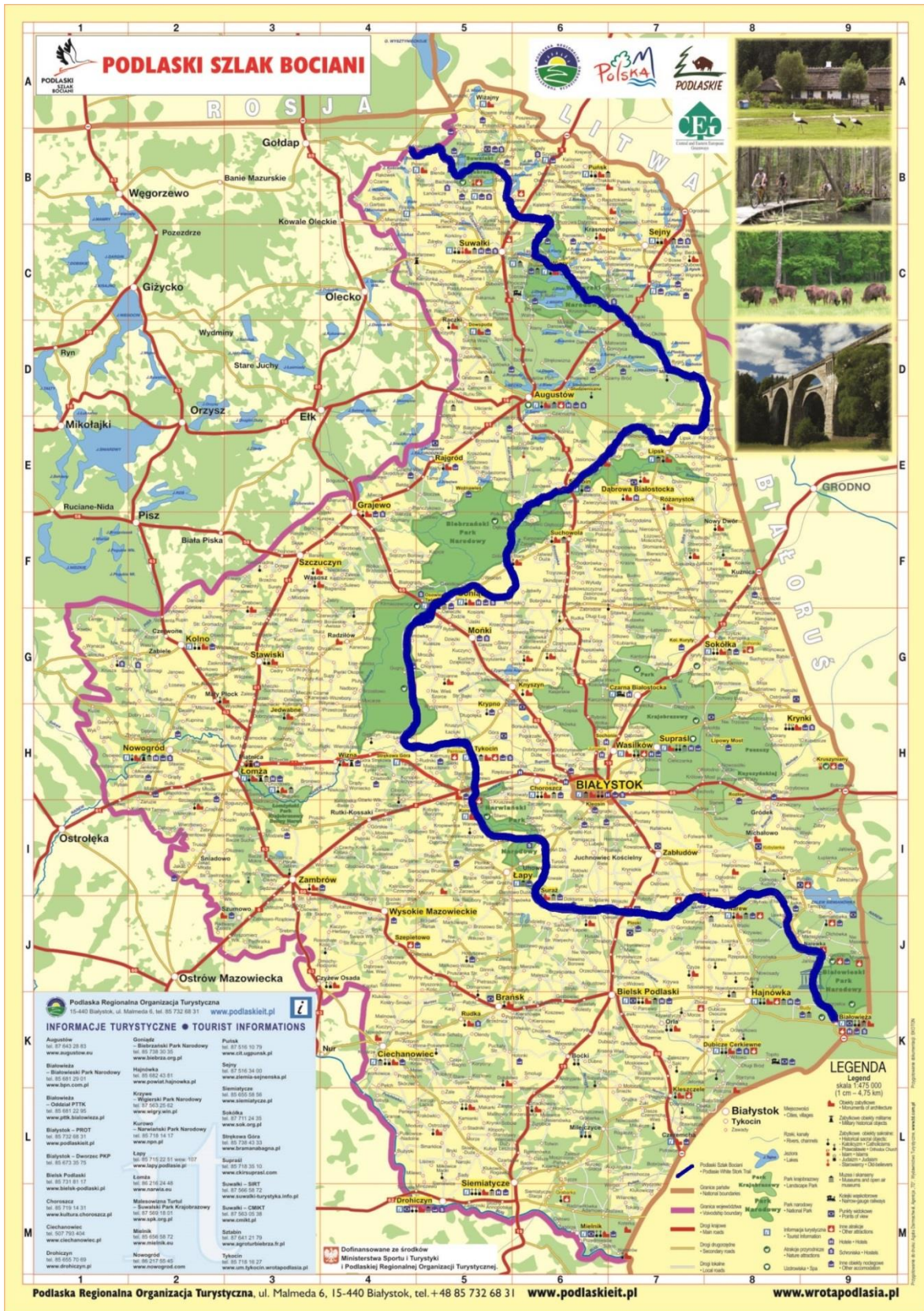
Ryc. 1. Przebieg Podlaskiego Szlaku Boczianiego.