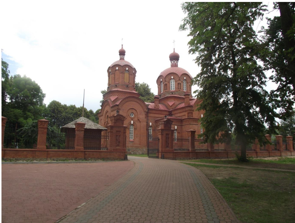
Fot. 2. Cerkiew pw. Św. Mikołaja Cudotwórcy w Białowieży.

Białowieski PN to nie tylko bogactwo przyrody, ale również obszar atrakcyjny kulturowo. Nieopodal siedziby parku znajduje się prawosławna cerkiew pod wezwaniem św. Mikołaja Cudotwórcy (Fot. 2). Świątynia zbudowana została z czerwonej cegły u schyłku XIX wieku na planie krzyża greckiego 10 .