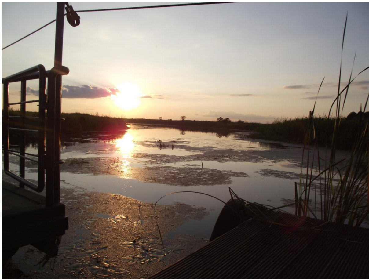
Fot. 3. „Serce” Doliny Narwi na trasie kładki Śliwno-Waniewo.

Od 2009 roku w Białowieży organizowany jest festyn pt. „Polowanie Króla Jagiełły”, na którym można cofnąć się w czasie oglądając m.in.: turniej rycerski czy łuczniczy, a także zobaczyć i zdegustować potrawy kuchni średniowiecznej 12 . W pierwszą sobotę lipca odbywa się impreza pod nazwą „Kupalle”, w Polsce znana jako Noc Świętojańska. Nazwa i charakter imprezy to ukłon w stronę mniejszości białoruskiej. Impreza zaczyna się pochodem spod dawnego dworca w Białowieży, kończy zaś w amfiteatrze, gdzie występują polskie i białoruskie zespoły ludowe 13 .