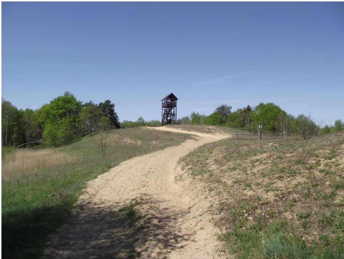
Fot. 6. Wilcza Góra.

urozmaicony krajobraz: z jednej strony bagienną dolinę, z drugiej piaszczyste wydmy, by z jeszcze innej przedstawiać las na terenie Czerwonego Bagna.