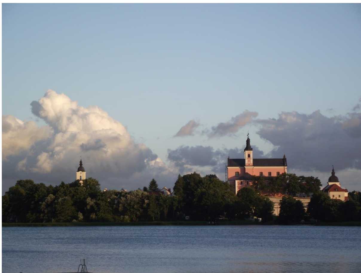
Fot. 7. Pokamedulski zespół klasztorny na tle jeziora wigierskiego.

Maksymalna głębokość polodowcowego jeziora Wigry dochodzi do 74 metrów. Dno ma różny charakter, przez co głębokość zbiornika jest zróżnicowana (Krzysztofiak, 2010). Powierzchnia lustra wody wynosi 2118 ha. Linia brzegowa jest kręta i urozmaicona, a jej długość wynosi 72 km. Na jeziorze obecnych jest 15 wysp. Wśród bogatej ichtiofauny na uwagę zasługuje obecność sielawy i siei (Ambrosiewicz, 2009; Kamiński, 2001).