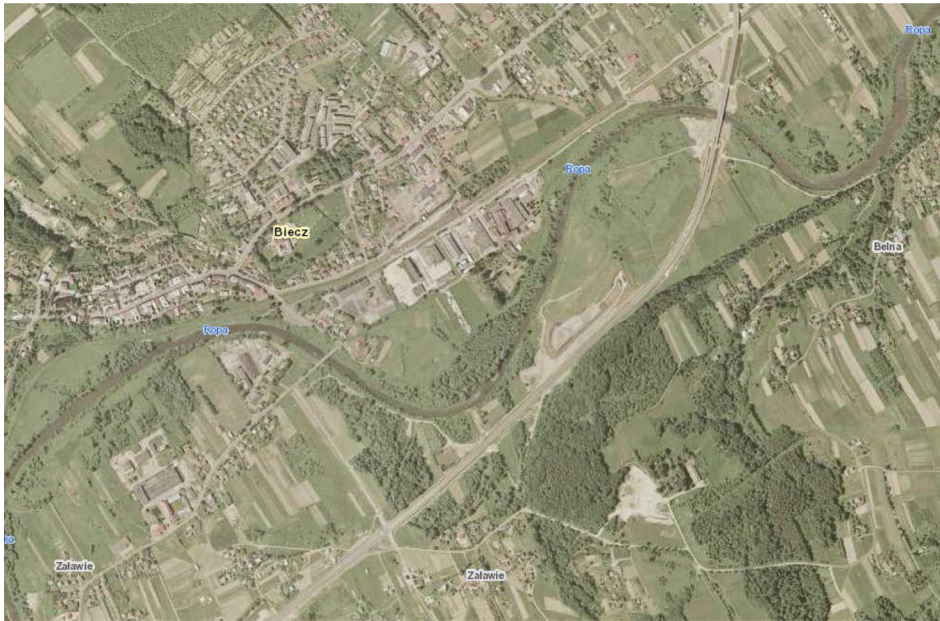
Rysunek 2. Fragment ortofotomapy rzeki Ropa (geoportal2)

zakresie została zajęta przez wody rzeki Ropa, ale porównując je z materiałem kartograficznym można określić faktyczne przemieszczenie zasięgu wód oraz skalę tego zjawiska. Dla ułatwienia opisu zaistniałych zmian, posłużono się graficznym przedstawieniem procentowego udziału zajętych obszarów badanych działek (rys. 4).