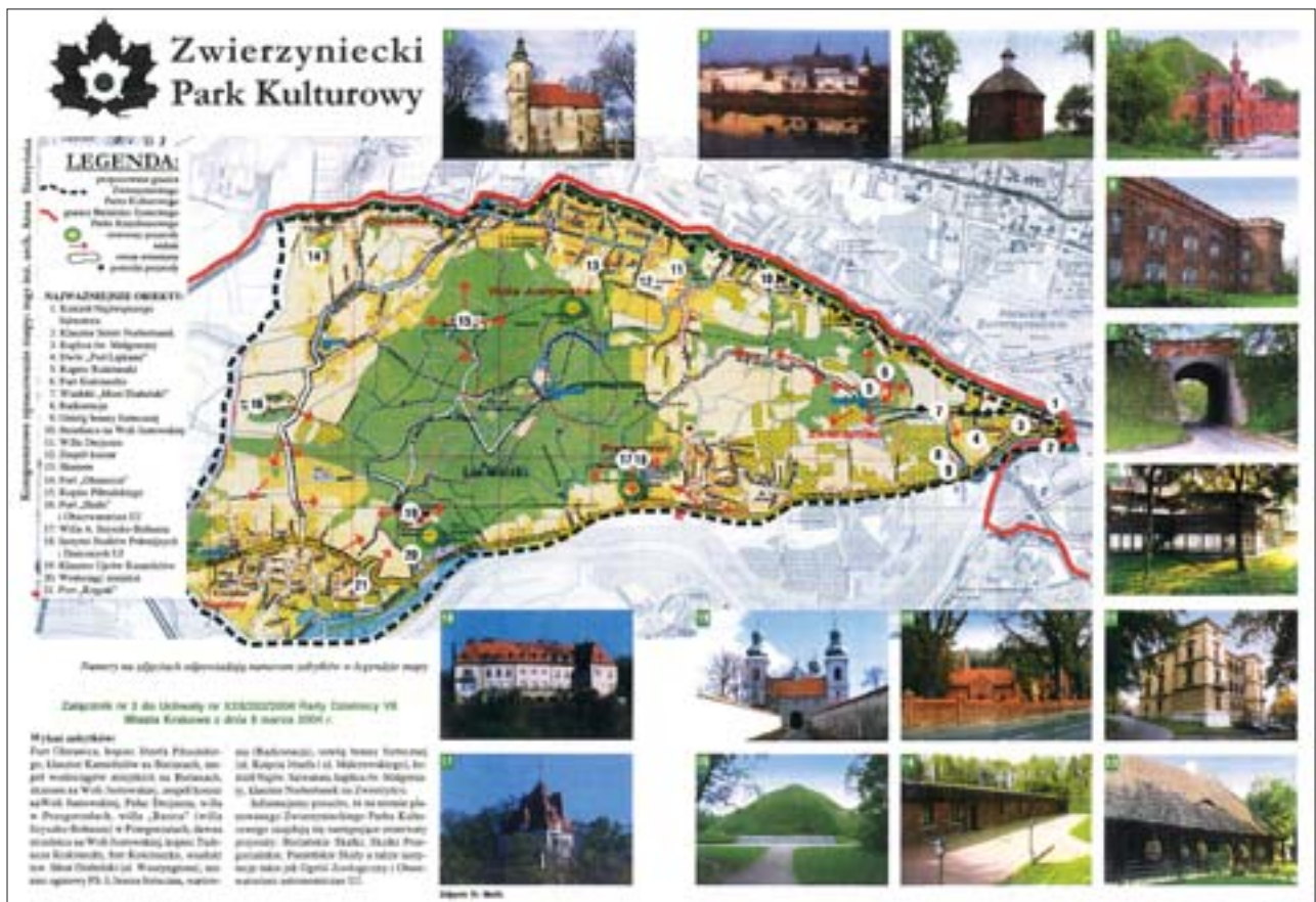
1. Wstępna koncepcja Zwierzynieckiego Parku Kulturowego. Opr. A. Skrzyńska, 2005 r. 1. Initial conception of the Zwierzyniec Cultural Park. Prep. by A. Skrzyńska, 2005.

iż niejako naprzeciw różnorodności krajobrazu „wychodzą” wielość i różnorodność form jego ochrony. Krajobraz jest swoistą fizjonomią – wyrazem środowiska, odbiciem wszelkich zjawisk występujących na Ziemi. Środowisko zarówno naturalne, jak i kulturowe stanowi o „tożsamości miejsca”, a jej zewnętrznym wyrazem jest krajobraz. Nie można ani ukryć, ani nie dostrzegać krajobrazu, choć można być na jego piękno czy ład mniej lub bardziej wrażliwym. Zawsze oddziałuje on na człowieka, choćby tylko w sferze podświadomości. Wobec piękna krajobrazu gór, starej wsi czy zabytkowego miasta trudno pozostać obojętnym.