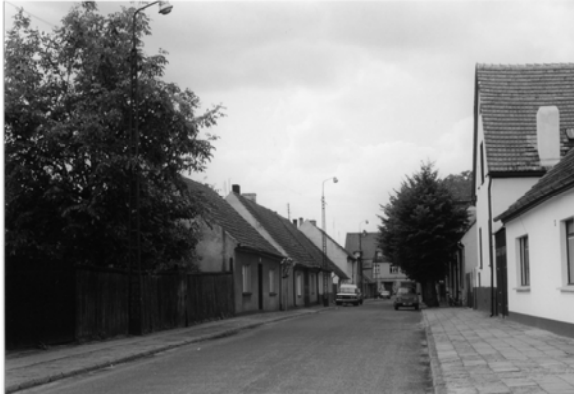
Fot. 4. Ulica w Cieszkowie (fot. Z. Borcz).

Photo 4. The street in Cieszków (photo by Z. Borcz).