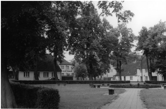
Fot. 3. Rynek w Cieszkowie (fot. Z. Borcz). Photo 3. The market square in Cieszków. (photo by Z. Borcz).

W Cieszkowie zachował się układ urbanistyczny, rynek obsadzony lipami, kilka