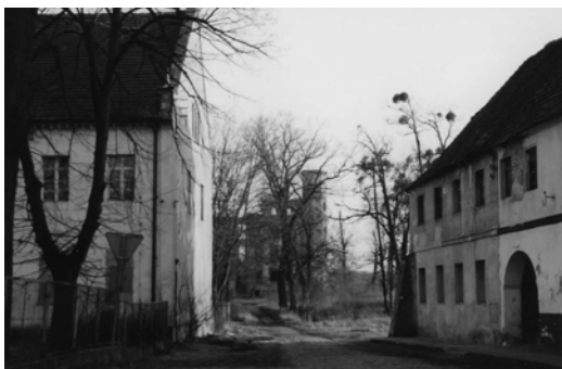
Fot. 1. Ulica wiodąca do zamku w Urazie.

Obecnie pojawiły się propozycje urządzenia przystani dla kajaków i łodzi, a tym samym powiązania Urazu szlakami rowerowymi i wodnymi z Wrocławiem i dalej z miastem powiatowym Brzegiem Dolnym. Sprzyja temu przedsięwzięciu piękna okolica, przybrzeżna przyroda nadodrzańska, m.in. chronione siedliska konwalii.