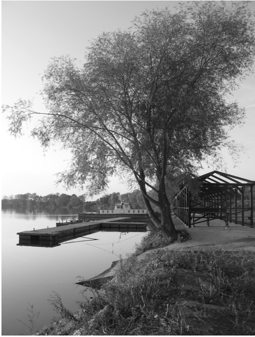
Fot. 2. Przystań rzeczna w Urazie. Photo 2. The river port in Uraz.

nowa szkoła znalazła się na obrzeżu jednorodzinnej zabudowy, „wyznaczając” w pewnym sensie nowe kierunki rozwoju miejscowości. W Urazie przewidziana jest budowa nowej drogi, która pozwoli na lepsze połączenie z Wrocławiem omijając dawne centrum. Liczba mieszkańców Urazu w połowie XIX w. wynosiła 976, z początkiem XX w. osiągnęła najwyższą liczbę 1345, po II wojnie światowej spadła i obecnie wynosi 900 osób.