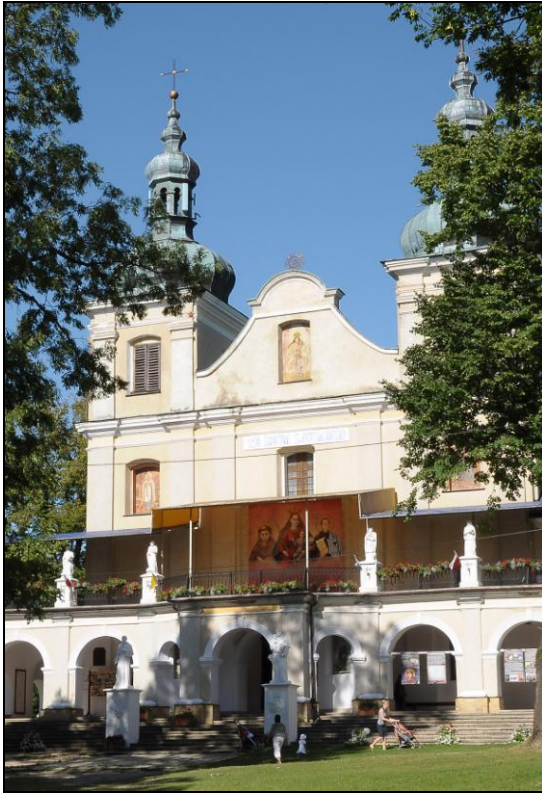
Fot. 1. Kościół w Kalwarii Paclawskiej. Photo 1. Church in Kalwaria Paclawska.