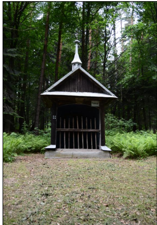
Fot. 4. Kaplica Pożegnanie Maryi z Apostołami. Photo 4. Chapel of farewell to Mary with the Apostels.