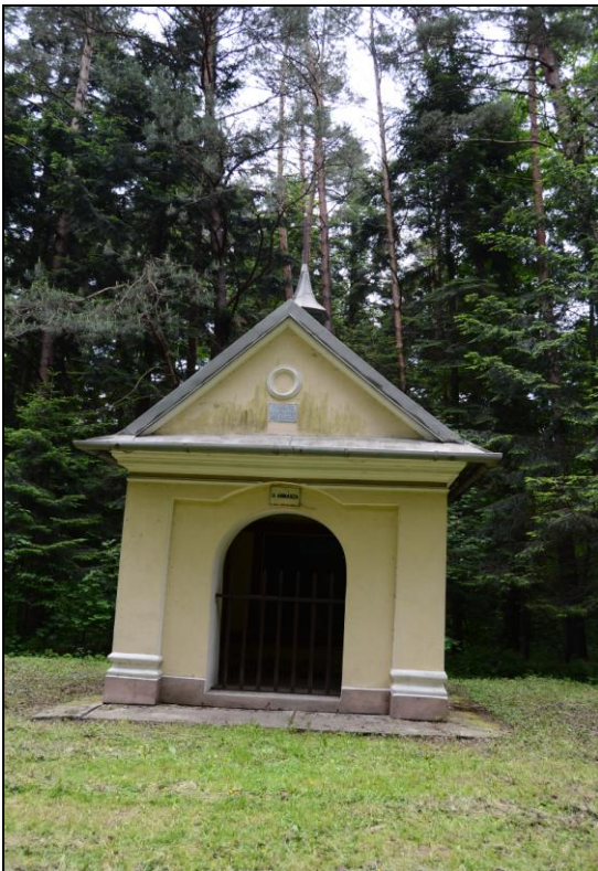
Fot. 3. Kaplica u Annasza. Photo 3. Chapel of Annasz.