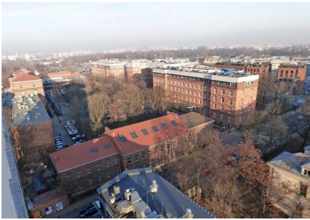
Il. 7. Kampus Politechniki Krakowskiej (pierwotnie koszary Arcyksięcia Rudolfa) – widoczna adaptacja i rewaloryzacja zespołu oraz sąsiedztwo z nową zabudową biurowo-apartamentową, (fot. W. Rymcza-Mazur, 2016).

Ill. Il. 7. The campus of the Krakow University of Technology (originally barracks of Archduke Rudolf) - visible adaptation and revalorisation of the complex with neighbouring new office and apartment development (photo: W. Rymcza-Mazur, 2016).