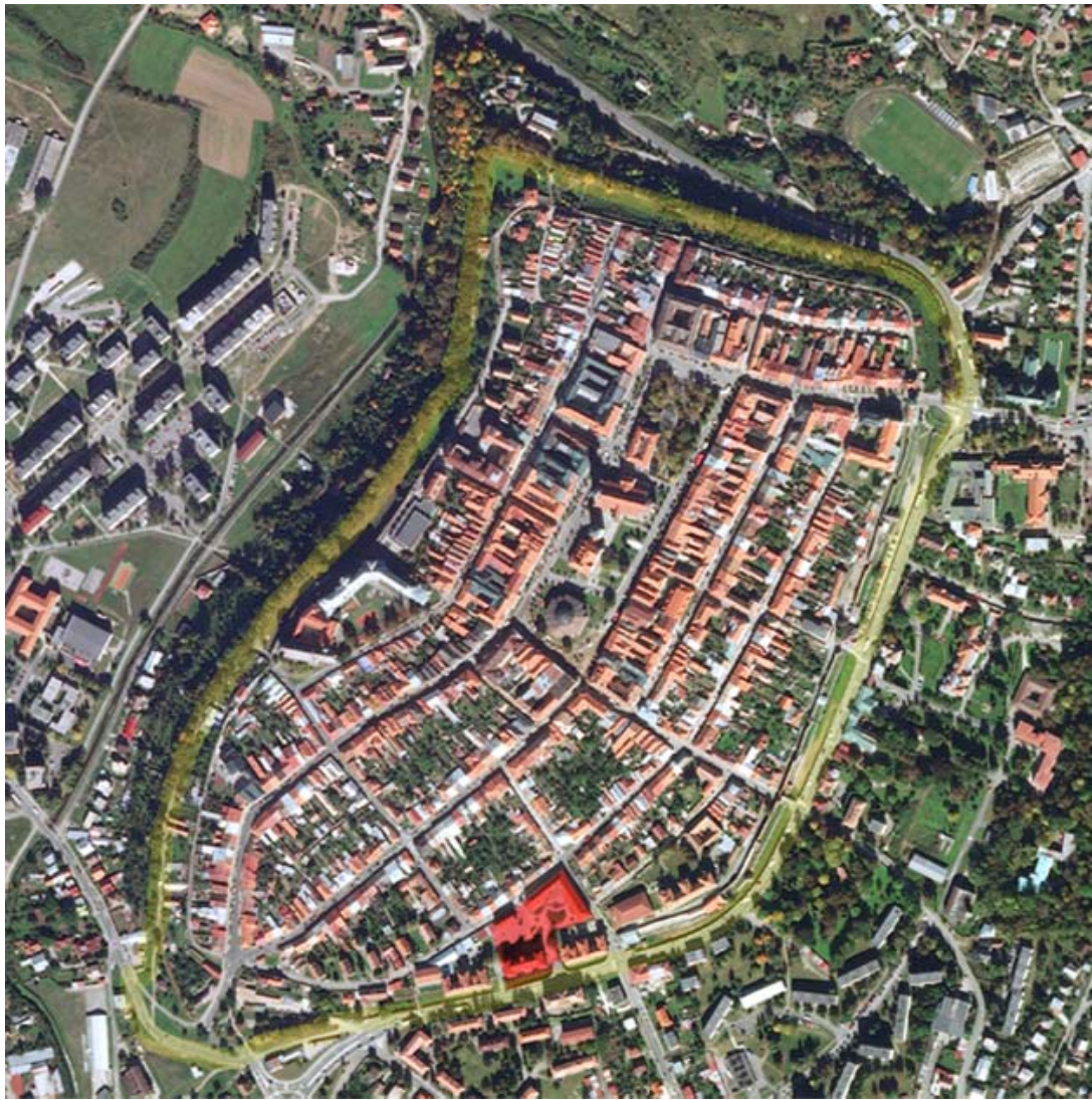
Il.12. Lewocza – zespół koszarowy w urbanistyce rezerwatu starego miasta, [z:] Úrad geodézie, kartografie a katastra SR, Mapový Portál Katastra Nehnutelností, Geodetický a kartografický ústav Bratislava, http://mapka.gku.sk/mapovyportal/?basemap=imagery&zoom=9&lng=20.5904&lat=49.0255 (dostęp: 26.02.2017).