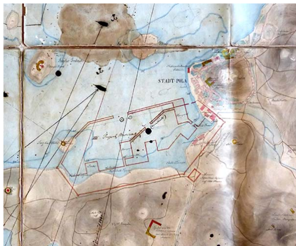
Il. 9. Pola – plan z 1852 roku wyznaczenia nowego układu nadbrzeży portowych, lokalizacji arsenału i garnizonowego miasta, (Sveučilišna knjižnica u Puli).

o tym pierwsze, oparte na planach garnizonowe realizacje z lat 50. i 60. XIX wieku. Obszar garnizonowego miasta wyznaczały potrzeby militarne i industrialne – budowa arsenału, bazy okrętów wojennych i stoczni, co wiązało się z przebudową wybrzeży, ukształtowaniem basenów i nadbrzeży portowych, połączeniem mostem wyspy Oliwnej z lokalizacją doków i stoczni okrętów wojennych [il. 9].