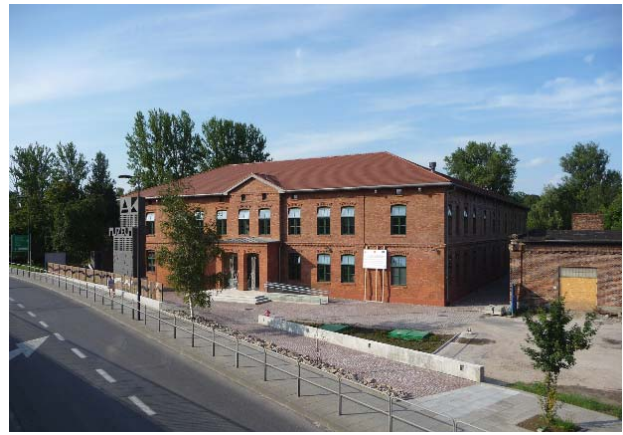
Il. 8. Muzeum Armii Krajowej, adaptacja konserwatorska dawnego garnizonowego założenia – fasada frontowa (fot. W. Rymcza-Mazur, 2011).

Wizja architektoniczna powstałego obiektu stanowi połączenie zachowanej zewnętrznej bryły, jego elewacji z współczesną technologią, pozwalającą poszerzyć ekspozycję o przestrzeń funkcjonalną pod przeszklonym zadaszeniem wewnętrznego dziedzińca, a także włączyć w program symboliki muzeum jego części podziemne. Na uwagę zasługuje fakt, że adaptowany budynek, będący częścią dawnego zespołu aprowizacyjnego Twierdzy Kraków znalazł się obecnie w całkowicie nowej relacji z układami zabudowy miejskiej. Sąsiaduje bowiem z klasztorem Karmelitów Bosych oraz komunikacyjną infrastrukturą związaną z przebudowanym układem drogowym ulicy Wita Stwosza, obsługującym nowy zespół dworca autobusowego pomiędzy infrastrukturą