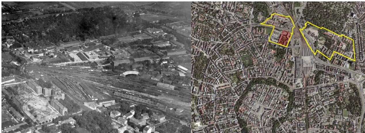
Il. 4. Kraków – widok arialny od strony południowo-zachodniej na kwartał zabudowy koszarowo-zapleczewej z drugiej połowy XIX i początku XX wieku, widoczny zespół koszar Arcyksięcia Rudolfa i zaplecza aprowizacyjne twierdzy, powiązane z układem komunikacyjnym, (MLP, 1919).

Ten największy i najbardziej okazały, modelowy zespół koszarowy w Twierdzy Kraków przetrwał w niezmiennym układzie przestrzennym i architekturze przez kolejne dekady XX wieku. Po upadku Austro-Węgier przejęty został przez Wojsko Polskie (koszary króla Jana III Sobieskiego), a podczas okupacji niemieckiej w koszarach stacjonowały oddziały Luftwaffe. Po II wojnie światowej większą część zespołu koszarowego przekazano dla powołanej wówczas Politechniki Krakowskiej. Proces adaptacji zespołu dla potrzeb uczelni rozpoczęto z końcem lat 40. XX wieku, a prowadzona od lat 60. rozbudowa (nadbudowa gmachu głównego, dwóch budynków batalionowych oraz ich przeszklonych ryzalitów) wzmocniła monumentalny charakter budynków koszarowych, stanowiących do dzisiaj ciekawe zestawienie form modernistycznych z militarną XIX wieczną architekturą. Koszarowy plac ćwiczeń