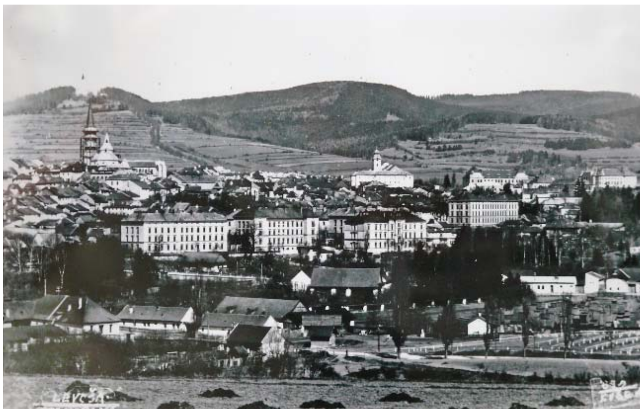
Il. 13. Lewocza – widoczny na archiwalnej fotografii zespół koszarowy z końca XIX wieku na tle panoramy miasta, (Spišské múzeum SNM, Levoča).