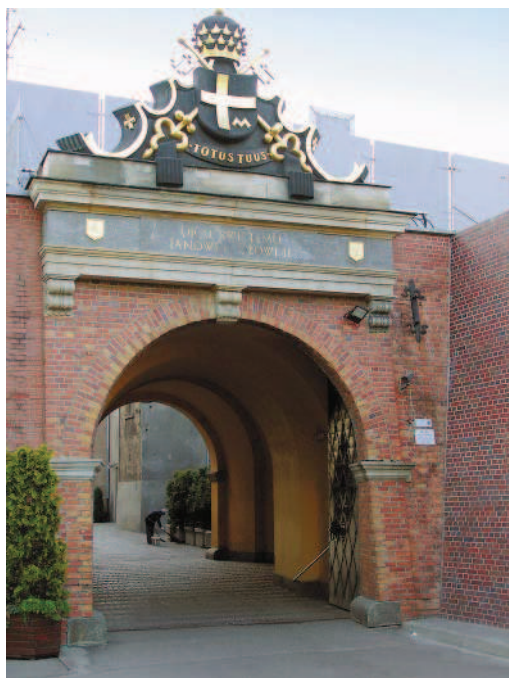
Ryc. 2. Jasna Góra. Brama Jana Pawła II Fig. 2. Jasna Góra, the Gate of Jan Paweł II