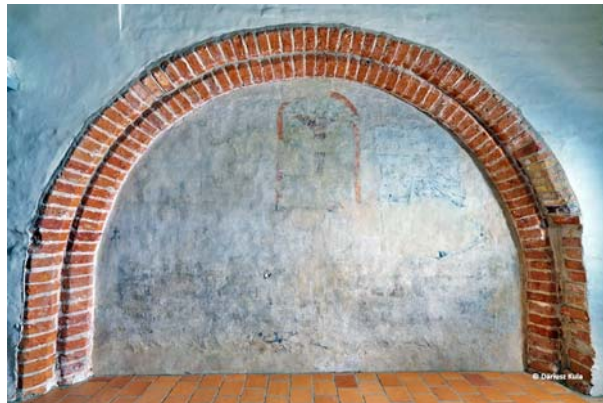
Ryc. 3. Wnęka z malowidłem ściennym „Ukrzyżowanie” i fragmentem draperii po pracach konserwatorskich. Fot. D. Kula, 2017

Jednym z najważniejszych odkryć były relikty malowidła ściennego z 1. poł. XV w. ze sceną „Ukrzyżowania” 3 (ryc. 3). Odnaleziono je w półkolistej wnęcie na zachodniej ścianie wieży (w pomieszczeniu ulokowanym po zachodniej stronie – przy przejeździe). Pozwoliło to na wyjaśnienie dotąd nieznaną lokalizacji kaplicy ratuszowej prawdopodobnie właśnie w tym miejscu. Jak wiadomo została ona poświęcona pod wezwaniem św. Marcina 4 . Malowidło jest niewielkich rozmiarów (ok. 34 × 25 cm) i zachowało się w niedużym stopniu. Namalowano je w technice temperowej na cienkim, wapiennym tynku. Czytelny jest Ukrzyżowany Chrystus w czerwonym, półkolistym obramieniu. Odślonięto też fragment kolejnej, nowożytnej warstwy z linearnie malowaną niebieską draperią. Prawdopodobnie już w XVI w. zasłoniła ona „Ukrzyżowanie”. W tym samym pomieszczeniu znaleziono też fragmentarycznie zachowany malowany fryz, o prostych, powtarzalnych motywach geometrycznych, znajdujący się tuż pod