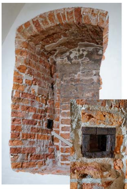
Ryc. 6. Gniazdo w ościeżu okna (wyłożone drewnianymi deskami) po belce służącej do blokowania okiennicy. Fot. D. Kula, 2017