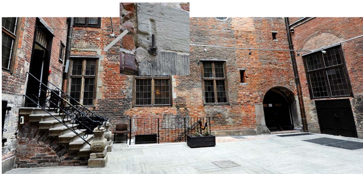
Ryc. 9. Obecny dziedziniec z widokiem na północną – tylną ścianę ratusza. W oknach po lewej stronie zachowane kamienne nadproża z XV w. oraz hak do zawieszania skrzydła okiennego.

further to the west and was probably in use from the 2 nd half of the 16 th century to ca. 1890 8 . That entrance was rectangular and stone-framed. Based on the old photograph, it is known what door joinery looked like. The joinery has a plank structure strengthened inside with cross-bracing and angle struts in the cross configuration, which is indicated by large-head nails at the face. The original entrance to the Excise Chamber was located in the eastern wall, at the Kramarska Street side, the lower part of the entrance having been bricked-up later and the upper part converted into a window.