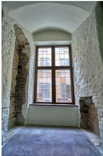
Ryc. 12. Wyeksponowane fragmenty średniowiecznego przejścia w grubości muru (okno wykuto w XVI w.). Stan po pracach. Fot. D. Kula, 2017

Fig. 11. Renovated window dating back to 1865. Photo: D. Kula, 2017