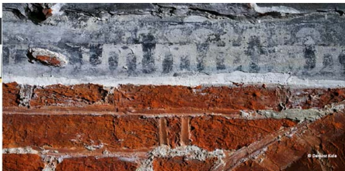
Ryc. 4. Fragment malowanego fryzu o motywach geometrycznych z komputerową rekonstrukcją. U dołu widoczne ślady pierwotnego malowania czerwienią zarówno na cegle jak i na spoinach. Fot. D. Kula, rekonstrukcja K. Darecka, 2017