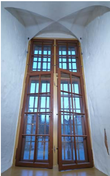
Ryc. 11. Okno z 1865 r. po renowacji.

Fig. 11. Renovated window dating back to 1865.