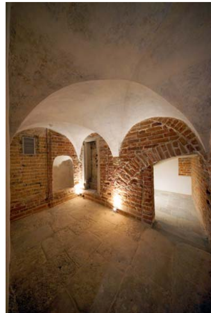
Ryc. 13. Pomieszczenie pod wieżą po pracach konserwatorskich.

Fig. 12. Exhibited fragments of a medieval passage within the wall thickness (the window was cut in the 16 th c.) The condition after the works.