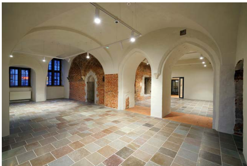
Ryc. 14. Wnętrze połączonej Komory Palowej i Akcyzowej po zakończeniu prac.

Kilka ciekawych detali znajduje się również w niewielkim pomieszczeniu pod wieżą (ryc. 13). Przede wszystkim są to pozostałości dawnego otworu drzwiowego w postaci kamiennego obramienia z hakami po zawiasach i fragmentem metalowej zasuw. Pierwotnie było to przejście, które prowadziło bezpośrednio do sieni ratusza 18 . Zapewniało ono dogodną i jedyną komunikację z pierwszego – reprezentacyjnego piętra ratusza do Komory Palowej. W pomieszczeniu znajduje się nowożytnie sklepienie krzyżowe z jednymi z nielicznych zachowanych tynków, na których odnaleziono kilka warstw szarego wymalowania. Po usunięciu powojennej stalowej posadzki ujawniły się oryginalne kamienne płyty z wapienia olandzkiego zachowane prawie w całości.