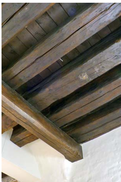
Ryc. 5. Odslonięty spod współczesnego sufitu strop belkowy z końca XIV w. Stan po pracach konserwatorskich. Fot. K. Darecka, D. Kula, 2016