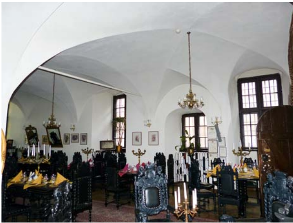
Ryc. 1. Komora Palowa w czasie funkcjonowania restauracji „Palowa”.

Fig. 1. Mooring Fee Chamber during the times of the “Palowa” restaurant.