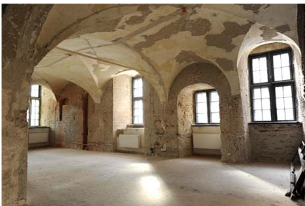
Ryc. 2. Komora Palowa po usunięciu współczesnych cementowych tynków. W głębi widoczne ślady po pierwotnym wejściu oraz oknie.

Fig. 1. Mooring Fee Chamber during the times of the “Palowa” restaurant.