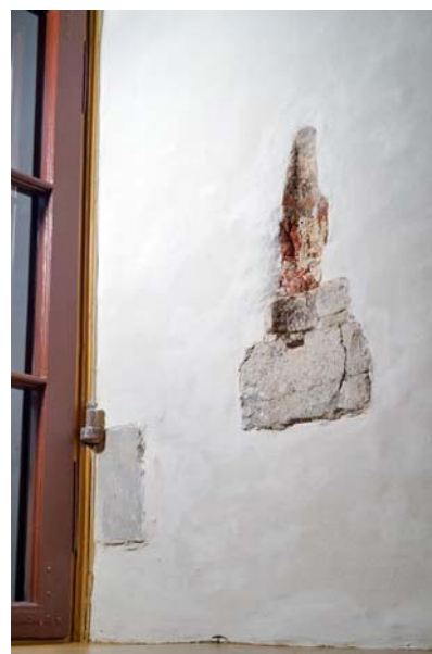
Ryc. 7. Na pierwszym planie średniowieczne kamienne gniazdo z wyłobieniem służące do blokowania belką okiennicy. W głębi – nowożytny hak po okiennicy wzmocniony kamiennym blokiem. Fot. D. Kula, 2017