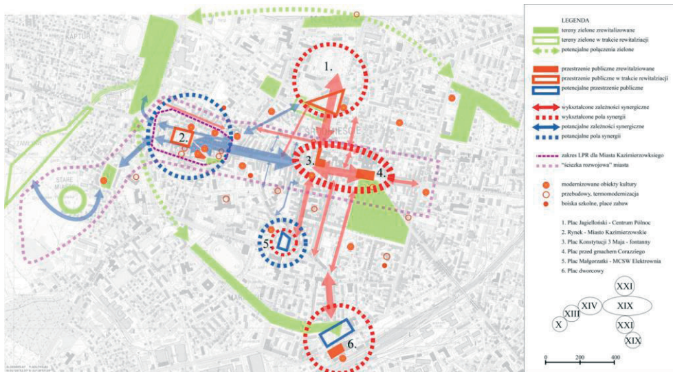
Rys. 3. Analiza wykształconych i potencjalnych zależności synergicznych. Opracowanie własne

Jako podstawę do analizy projektów rewitalizacji przyjęto sieć przestrzeni publicznych (rys. 1). Historycznie wykształcony układ osadniczy z czytelnymi kolejnymi etapami rozwoju miasta stanowi unikalną ścieżkę rozwojową z osią piszą śródmieścia wzdłuż ul. Żeromskiego. Projekty rewitalizacji w śródmieściu zostały podzielone na następujące kategorie dotyczące: przestrzeni publicznej, terenów zielonych, modernizację dróg i chodników, modernizację obiektów kultury, termomodernizację, oraz obiekty sportowe i rekreacyjne (rys. 2). Zestawienie przedstawionych danych z faktycznym życiem miejskim śródmieścia pozwala wyznaczyć następujące wykształcone i potencjalne zależności synergiczne: