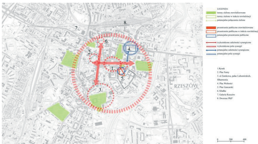
Rys. 5. Analiza wykształconych i potencjalnych zależności synergicznych Rzeszów. Opracowanie własne

Obecnie planowana jest rewitalizacja ul. 3 Maja. Zorganizowany w 2015 r konkurs na plac Gancarski jest interesującym przykładem organizacji konkursu przez SARP na zamówienie prywatnego Inwestora. Zakres projektu dotyczył w znacznej części zabudowy placu budynkiem o mieszanej funkcji wraz z przedstawieniem koncepcji uporządkowania całego kwartału.