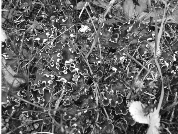
Rysunek 1 Peltigera canina na piasku