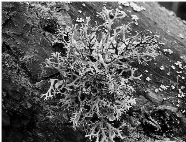
Rysunek 2 Pseudevernia furfuracea