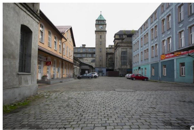
Rys. 3. Dziedziniec fabryki obecnie. [11]

Zachowanie zabudowań fabrycznych, osiedla robotniczego, domu kultury, a także zieleni przy brzegu Soły, czy w dalszej odległości kortów tenisowych stanowi dobry przykład jednostki architektoniczno-krajobrazowej JARK. Biegająca pomiędzy zakładem, a osiedlem ulica Ks. Prałata Stanisława Słonki stanowi ważną oś widokową „na obiekt”, natomiast wieża zegarowa może być świetnym punktem widokowym „od obiektu”. Ostatnim składnikiem są elementy dziedzictwa niematerialnego. W przypadku ŻZP „Solali” S.A. wskazać możemy na umiejętności związane z produkowaniem papieru, chociaż wraz z postępem technologicznym uległ on do pewnego stopnia automatyzacji (rys. 4 i 5), a także przekazy ustne o życiu dawnej społeczności pracowników fabryki.