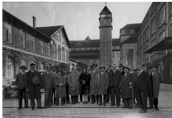
Rys. 2. Polscy i niemieccy dziennikarze ze Śląska na dziedzińcu fabryki. [2]

zegarową z brukowaną nawierzchnią drogową oraz fragmentami szyn kolejki wewnątrzzakładowej (rys. 2 i 3).