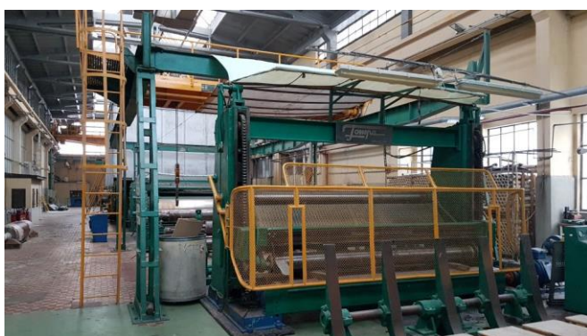
Rys. 5. Fragment współczesnej linii produkcyjnej w „Solali”. [5]