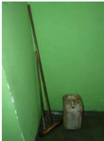
Rys. 4. Niezorganizowana przestrzeń wymagająca wdrożenia metody 5-S. Oprac. własne