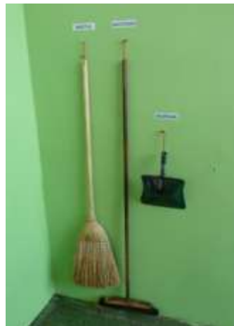
Rys. 5. Kącik czystości z zastosowaniem oznaczenia wyposażenia zamiast tablicy cieni. Oprac. własne