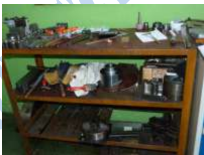
Rys. 2. Regał roboczy przed wdrożeniem metody. Oprac. własne

Na rysunkach 2 i 3 zaprezentowano regał roboczy przed wdrożeniem etapu selekcji i po jego zakończeniu.