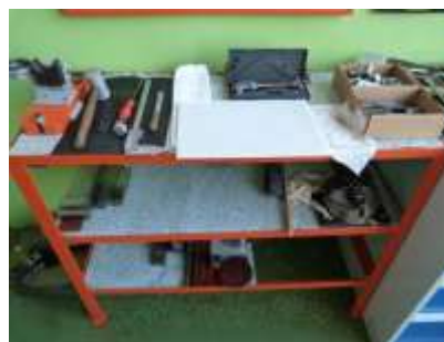
Rys. 3. Regał roboczy po wdrożeniu metody. Oprac. własne