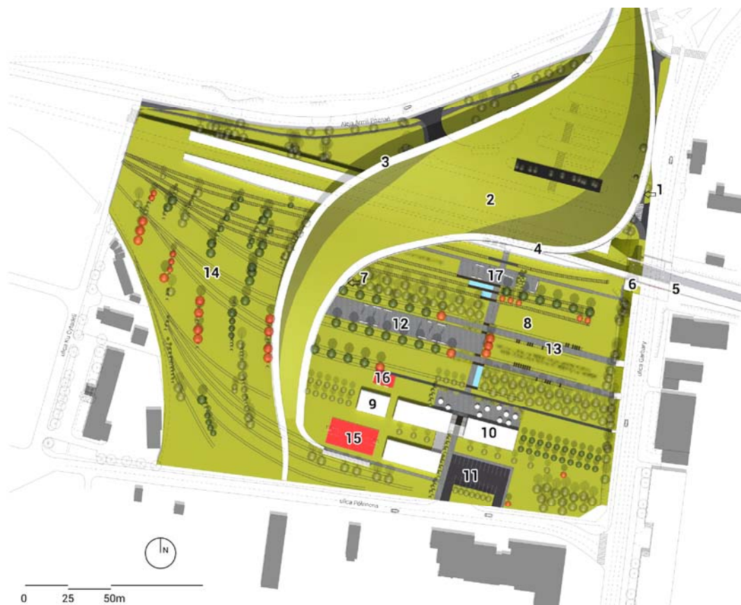
Ryc. 4. Plan zagospodarowania rejonu dworca Poznań-Garbary: 1 – zadaszony węzeł komunikacyjny (dworzec kolejowy, autobusowy, taxi, rowery miejskie), 2 – zielony dach, 3 – ścieżka pieszo-rowerowa, 4 – taras widokowy, 5 – kładka dla pieszych, 6 – pylon z klatką schodową, 7 – strefa usług, 8 – trawnik, 9 – zaplecze sportowe, 10 – strefa gastronomiczna, 11 – parking, 12 – strefa reprezentacyjna, 13 – strefa wypoczynkowa, 14 – strefa parkowa, 15 – boisko sportowe, 16 – plac zabaw, 17 – plac przed dworcem (obszar nr 2 na ryc. 1).

Fig. 4 Development plan of the Poznań-Garbary Railway Station: 1 – covered hub (train, bus, taxi, city bikes), 2 – green roof, 3 – pedestrian and cycling path, 4 – observation deck, 5 – pedestrian footbridge, 6 – pylon with a staircase, 7 – service zone, 8 – lawn, 9 – sports facilities, 10 – catering zone, 11 – car park, 12 – representative zone, 13 – recreation zone, 14 – park zone, 15 – sport field, 16 – playground, 17 – station forecourt (area No.2 in fig.1).