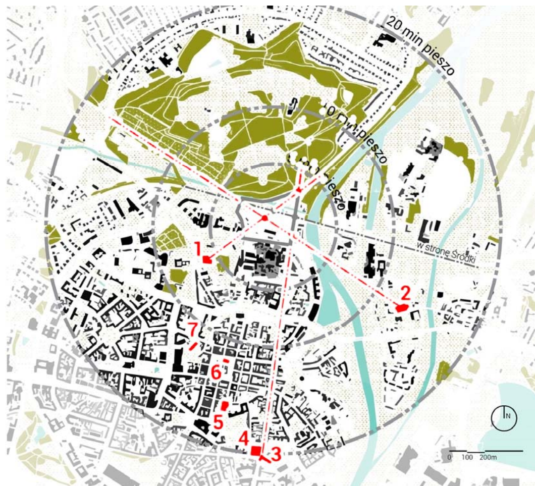
Ryc. 3. Relacje przestrzenne i kompozycyjne między dworcem Poznań-Garbary (w środku okręgu) a centrum miasta: 1 – kościół św. Wojciecha, 2 – bazylika archikatedralna św. św. Apostołów Piotra i Pawła na Ostrowie Tumskim, 3 – kościół św. Franciszka Serafickiego, 4 – pl. Bernardyński, 5 – fara poznańska, 6 – Ratusz na Starym Rynku, 7 – Zamek Królewski.

Fig. 3. Spatial and composition connections between the Poznań-Garbary Railway Station (in the middle of the circle) and the city centre: 1 – St. Adalbert Church, 2 – Cathedral Basilica of St. Peter and Paul, Tumski Island, 3 – St. Francis Seraph Church, 4 – Observant Square, 5 – Parish Church, 6 – City Hall, the Old Market Square, 7 – Royal Castle.