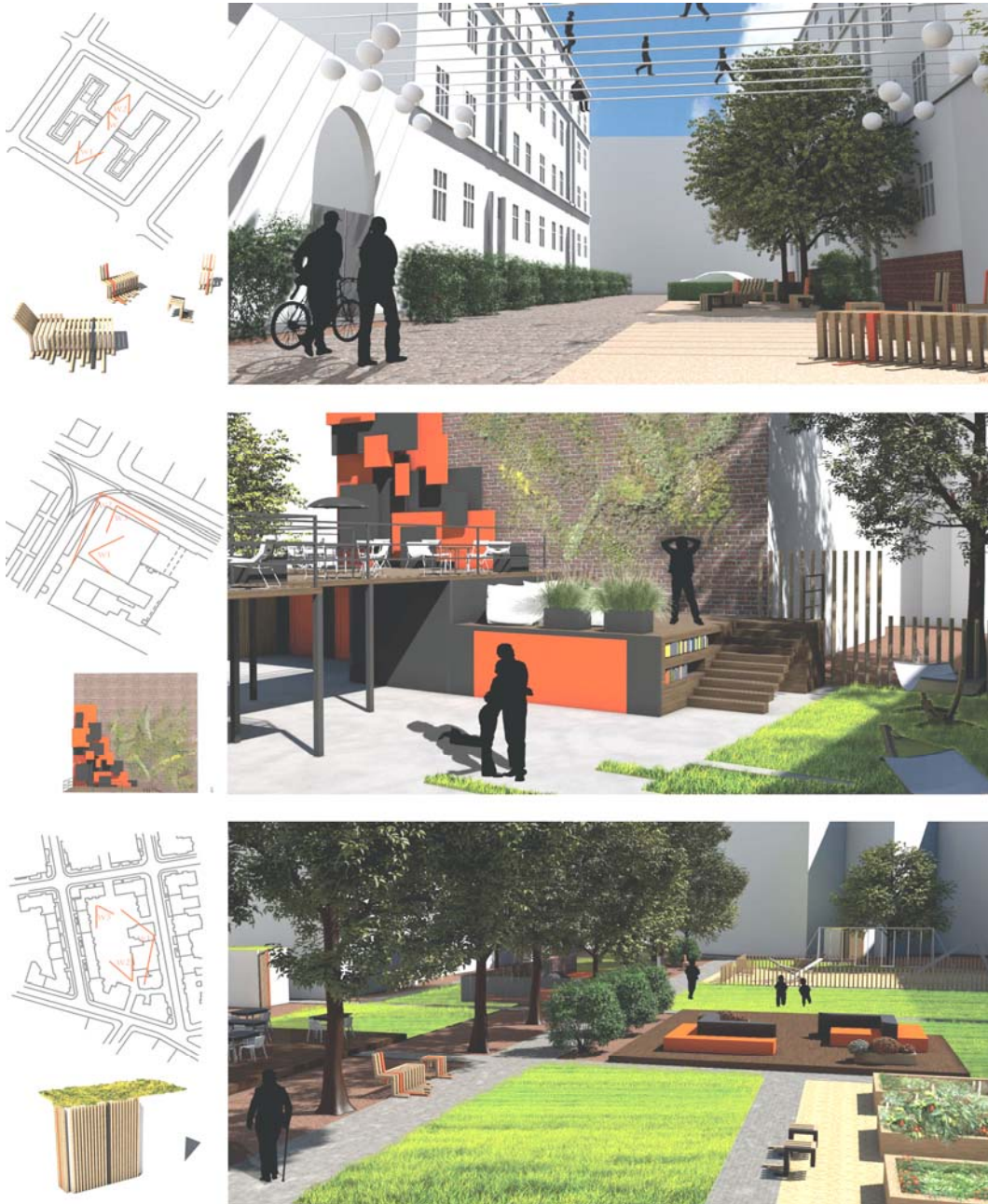
Ryc. 5. Rozwiązania projektowe na Łazarzu: ciąg uliczny jako przestrzeń półprywatna nazwana między sąsiadami , z widocznymi elementami integracji mieszkańców w postaci zieleni i sylwet sąsiadów balansujących na linach przeciągniętych między bliźniaczymi budynkami; pusta narożnikowa działka między ulicami udostępniona mieszkańcom i poszukiwaczom niekonwencjonalnych „klimatów”; wnętrze i podwórze o integracyjnej funkcji, nazwane między kamienicami pokazuje, że możliwe jest opanowanie chaosu przy zachowaniu dotychczasowej funkcji uzupełnionej m.in. o szpaler drzew, plac zabaw dla dzieci, taras wypoczynkowy, ogród miejski, mini wybieg dla psów (obszar nr 3 na ryc. 1).