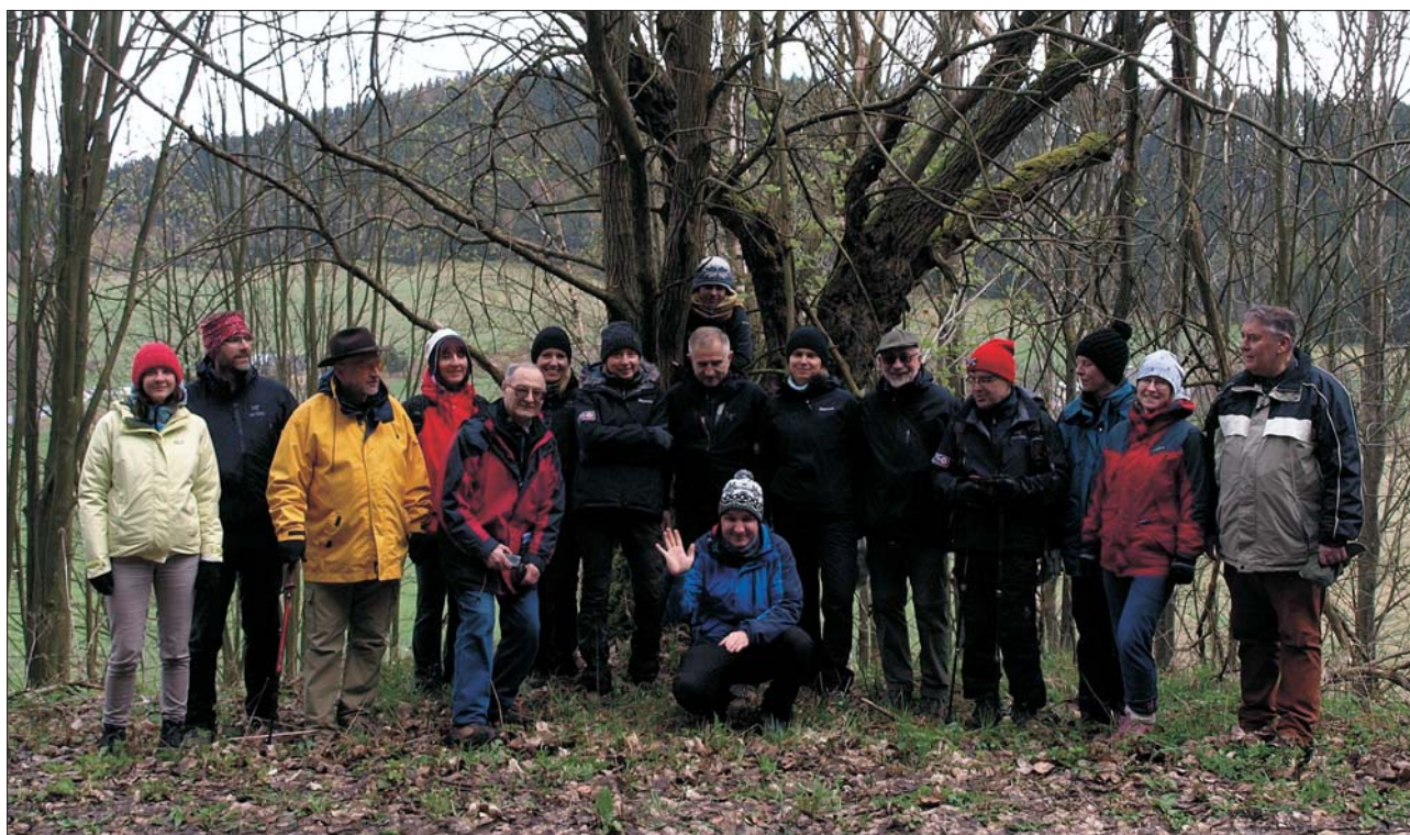
Ryc. 5. Uczestnicy warsztatów terenowych Współczesne Problemy Kartografii Geologicznej w Polsce – Postępy w Kartografii Geologicznej Sudetów w 2017 r. Coll. A. Kowalski

Od jesieni 2008 r., w porozumieniu z dyrekcją Instytutu Nauk Geologicznych UW., postanowiono czwartkowe posiedzenia naukowe oddziału organizować wspólnie. W wyniku tej reorganizacji wzrosła liczba odczytów w semestrze oraz zwiększyło się grono słuchaczy, głównie