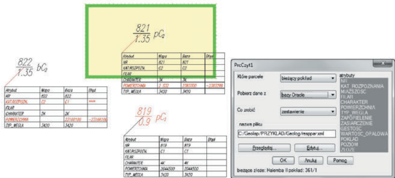
Rys. 3. Porównanie danych opisujących tę samą parcelę na rysunku z danymi znajdującymi się w zewnętrznej bazie danych Fig. 3. Comparison of data from the figure describing the parcel and the external database

i innych parametrów jakości węgla. Program na podstawie tej bazy umożliwi wygenerowanie izolinii i mapy zakresów dowolnego parametru jakości węgla, a także obliczenie średniej wartości na wskazanym obszarze.