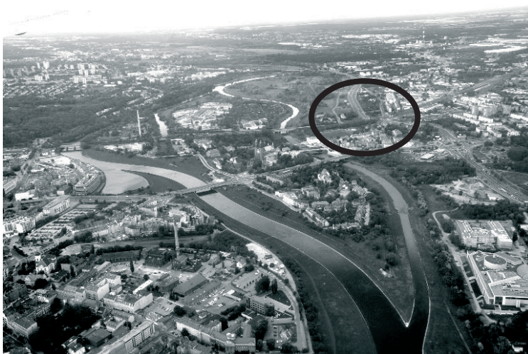
Fot. 2. Widok Ostrowa Tumskiego w widłach Warty i Cybiny, na wschód od niego leży Śródka ograniczona dwiema arteriami, rondem, linią kolejową i korytem Cybiny z odbudowanym już mostem i kładką ICHOT.