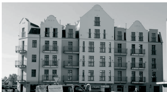
Fot. 5. Hotel Śródka 2015.

W ślad za opisanymi inwestycjami i zmianami, na głównej ulicy pojawiły się nowe lokale gastronomiczne i sklepy. W 2015 roku został oddany do użytku Hotel Śródka. Jest to adaptacja dwóch sąsiednich kamienic z lat 1906 – 1908, tworzących pierzeję naprzeciw kościoła św. Małgorzaty. Obok mieszkań kamienice mieściły lokale usługowe i handlowe. Częściowo zniszczone w czasie wojny zostały odbudowane. Ich gruntowna przebudowa przywróciła centrum dzielnicy budynek o skromnym secesyjnym wystroju i potrzebnej funkcji. „Powróciła” restauracja, która niegdyś znajdowała się w parterze kamienicy narożnej. [22].