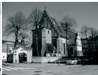
Fot. 6. Kościół św. Małgorzaty.

Działalność Rady Osiedla, która stara się osobność, wydzielenie Śródki przekuć w jej atut była i jest bardzo intensywna. Organizowane już od lat 90. XX w. imprezy integrujące mieszkańców otrzymały wsparcie programu rewitalizacji i dotacji pro-społecznych umożliwiających organizację imprez o szerszym niż dotąd zasięgu. Most Biskupa Jordana od 2007 roku stał się centrum tych działań. Cyklicznymi wydarzeniami są m.in. Śródeckie Spotkania (VIII edycja w 2015 roku), Targi Średniowieczne (VI edycja), Koncerty Śródeckie w kościele św. Małgorzaty, cykl imprez „A w niedzielę po sumie na moście”, Dzień Sąsiada, Przechadzki po Śródce. Dużą rolę odgrywa Ośrodek Szkolno-Wychowawczy dla