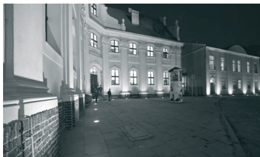
Fot. 3. Katedralna Szkoła Muzyczna w dawnym klasztorze Filipinów i Domu Ludowym.