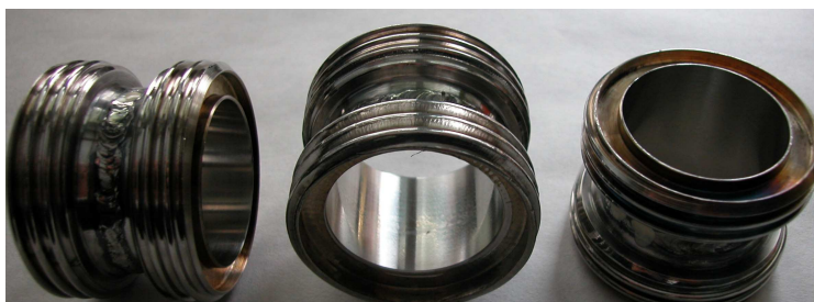
Rys. 1. Odcinek rury poddawany procesom brudzenia i mycia (element badawczy)

Powierzchnią, którą poddawano brudzeniu, myciu i ocenie była wewnętrzna powierzchnia 5 centymetrowego odcinka rury o średnicy 35mm, z dwóch stron zakończony gwintem z nakrętką (rys.1). Umożliwia to zalanie elementu czynnikiem brudzącym. Powierzchnia wewnętrzna jest szlifowana i polerowana.