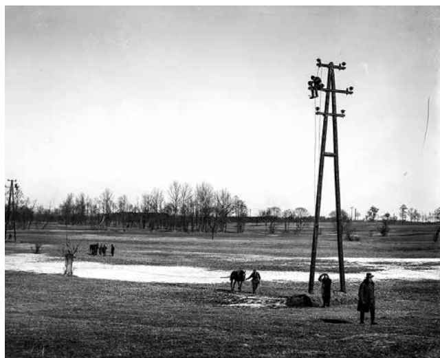
Fot. 1. Montaż linii napowietrznej do Pabianic

Jak prąd dotarł do Łodzi i kto zbudował pierwszą prywatną elektrownię w naszym mieście? Historię powstania Elektrowni Łódzkiej przybliżamy w poniższym artykule oraz... pokazujemy w Centrum Nauki i Techniki EC1.