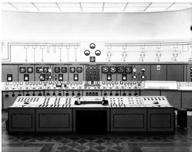
Fot. 6. Pomieszczenie nastawni Elektrowni Łódzkiej

18 września 1907 roku włączono do sieci turbozespół nr 1 o parametrach 3000 V, 1300 kVA. Elektrownia Łódzka była wówczas drugą co do wielkości po Warszawskiej w Królestwie Polskim.