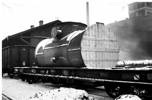
Fot. 3. Transport elementów elektrowni – odgazowywacza (po lewo) i stojana prądnicy (po prawo)

W okolicy położonych było wiele osad fabrycznych o większym znaczeniu przemysłowym, jak Zgierz czy Pabianice, ale Łódź szybko rozwinęła się do rozmiarów potężnego ośrodka przemysłu włókienniczego z coraz większym zapotrzebowaniem na energię elektryczną. Również oświetlenie gazowe nie było już wystarczające dla rozrastającego się miasta. Skutkuje to ogłoszeniem w 1895 roku przez Magistrat przetargu na elektryczne oświetlenie Łodzi. Swoją ofertę złożyła firma Siemens&Halske, która 5 lat później otrzymała koncesję na budowę i eksploatację elektrowni, lecz jej nie sfinalizowała. W 1906 r. odkupiło ją petersburskie Towarzystwo Elektrycznego Oświetlenia z 1886 roku, mające już na swoim koncie budowę elektrowni w Petersburgu i Moskwie. Możliwość rozpoczęcia prac na przydzielonym przez miasto terenie przy ul. Targowej 1 kosztowała spółkę 10 mln rubli.