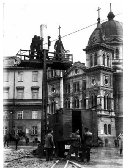
Fot. 2. Montaż lamp ulicznych na ulicach Łodzi