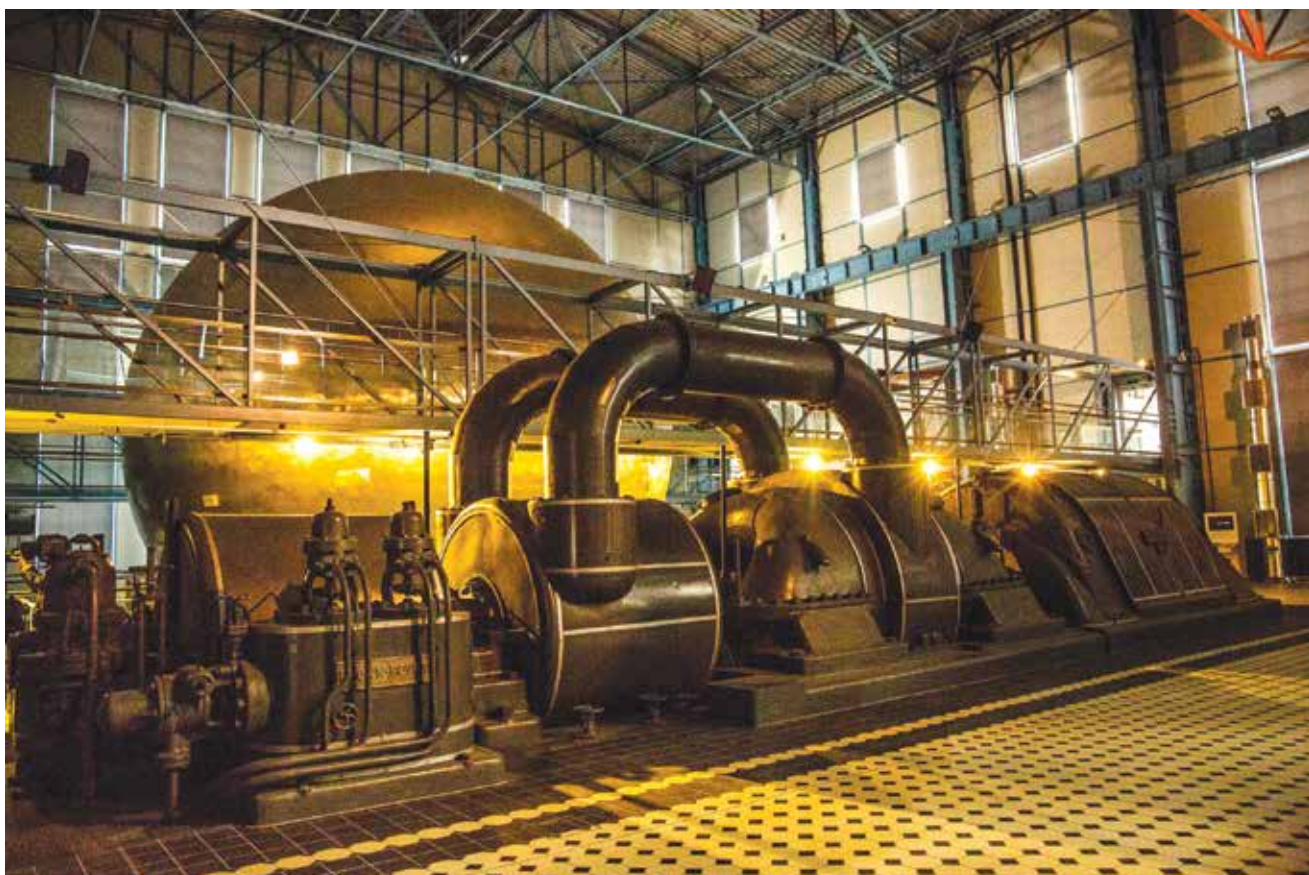
Fot. 7. Odrestaurowany oryginalny turbozespół firmy Brown&Boveri

Było to możliwe dzięki rozbudowie, która w 1930 roku pozwoliła na stworzenie tzw. nowej centrali – nowoczesnej, wyposażonej w nowinki techniczne samowystarczalnej części elektrowni. W jej budynkach znajduje się obecne Centrum Nauki i Techniki, gdzie pomiędzy oryginalnymi elementami wyposażenia kotłowni czy nastawni można znaleźć eksponaty, makiety i infokioski, które przybliżą Zwiedzającym pełną historię Elektrowni Łódzkiej – późniejszej EC1.