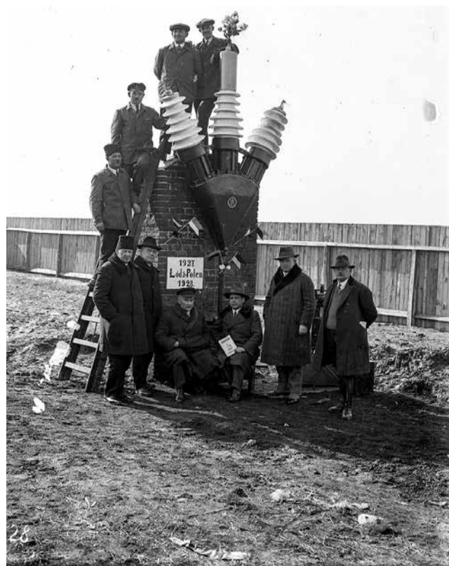
Fot. 5. Słup stacji transformatorowej