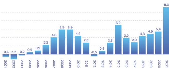
Wynik finansowy netto firm budowlanych w Polsce (mld zł)

Uwaga: dane dla firm zatrudniających powyżej 49 pracowników