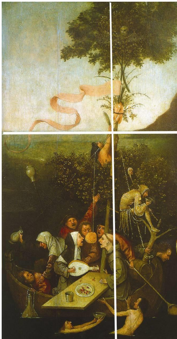
Rys. 2. Zastosowanie złotego podziału w malarstwie jako antycznej greckiej idei jedności przeciwieństw, czyli współistnienia podobnego z kontrastowym. Równoważenie akcentów – góra i dół i kontrapost (Hieronymus Bosch, „Statek głupców”, olej, 58x33 cm, 1494-1510 cm, Luwr)