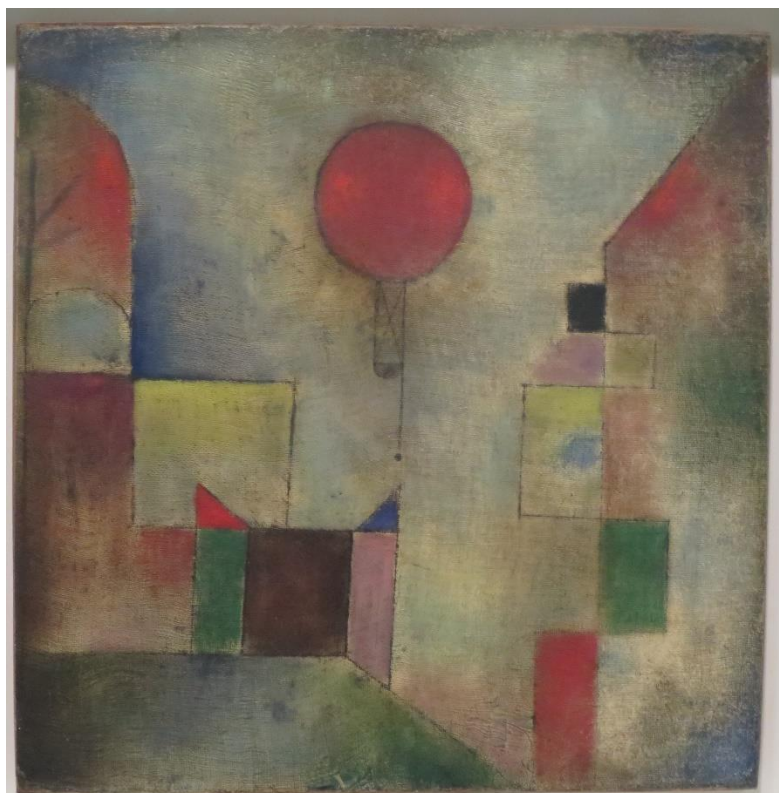
Rys. 8. Surrealistyczne zaprzeczenia przestrzenności dla różnych iluzji przestrzeni połączonych w jedno przedstawienie (Paul Klee, „Czerwony balon”, olej, 31,7x31,1 cm, 1922 r., Solomon R. Guggenheim Museum)