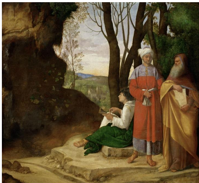
Rys. 3. Plany w malarstwie renesansowym dla świetlistego i jasnego tła wyrażającego harmonię świata, według praw działających w naturze (Giorgione, „Trzej filozofowie”, olej, 125,5x140,2 cm, 1508-1509 r., Kunsthistorischen Museum, Wiedeń)