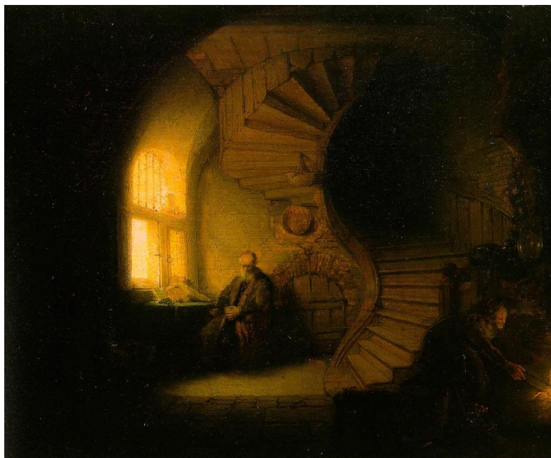
Rys. 7. Barokowy rozkład światłocienia w malarstwie. Stosunek powierzchni występowania światła do cienia wynosi 1/9 (Rembrandt van Rijn, „Medytujący filozof”, olej, 1632 r.)