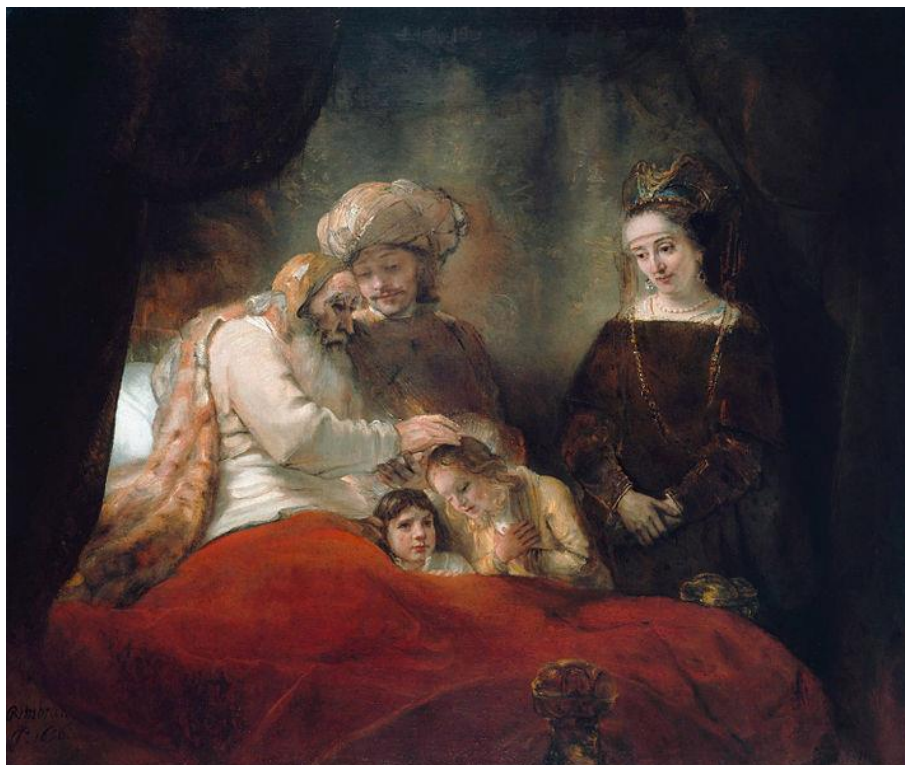
Rys. 5. Harmonia kolorów (barw) oparta na barwach pokrewnych: z czerwieni – koloru podstawowego namieszano pozostałe, dodając biele i czernie jako barwy achromatyczne (Rembrandt van Rijn, „Jakub błogosławi dzieci Józefa”, olej, 173x209 cm, 1656 r., Rijksmuseum, Amsterdam)