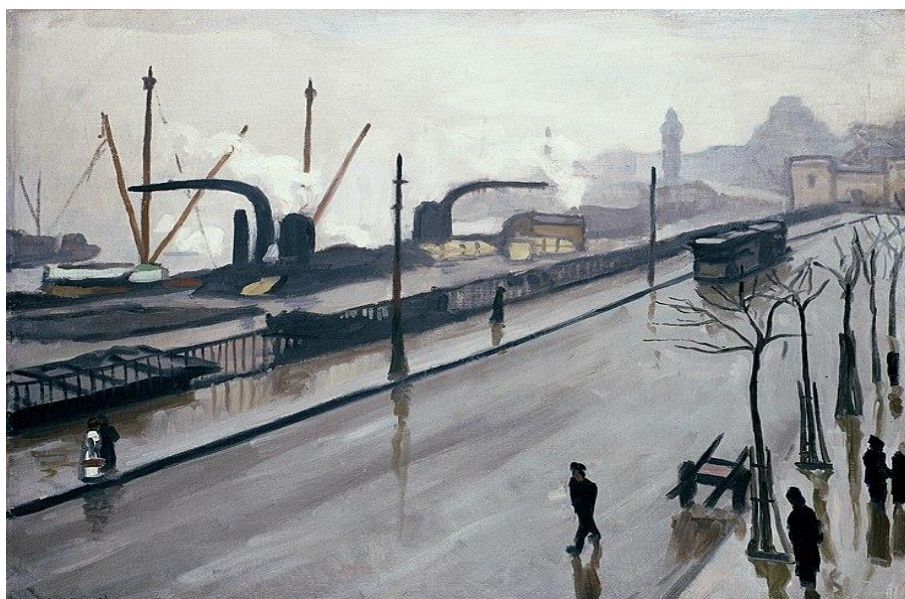
Rys. 6. Harmonia kolorów (barw) oparta na tonacji szarości (Albert Marquet, „Bez tytułu”, olej)