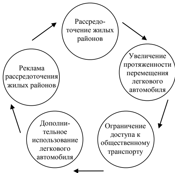
Рис. 10. Принцип ошибочного нескончаемого круга [2]

По мере отдаления от центра мегаполисной области, растет роль индивидуального транспорта, согласно принципу ошибочного нескончаемого круга, который иллюстрирует рисунок 10.