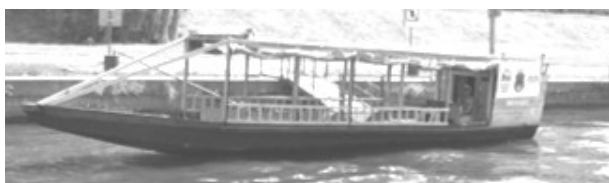
Рис. 3. «Краковский водный трамвай» [7]

Краков гордится своим водным городским транспортом, осуществляющим рейсы по двум маршрутам с высокой периодичностью движения. Одно из судов ходит по городскому маршруту (рис. 3), а второе – по маршруту Краков – Тынец. Поскольку «Краковский речной трамвай» может забрать на борт только 12 пассажиров, его нельзя отнести к судам городского общественного транспорта.