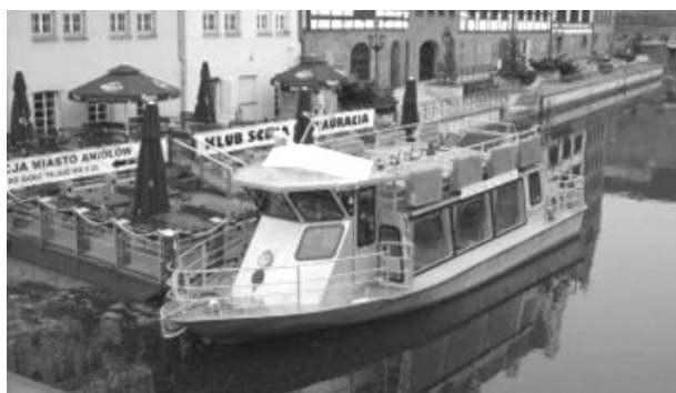
Рис. 5. Речной трамвай «Generał Kutrzeba» [9]

В Варшаве также используется свой речной трамвай. Судно 3–4 раза в день ходит по маршруту Подзамче – Понятовский – Ципель – Подзамче и называется «Generał Kutrzeba». Это судно на польских внутренних водах появилось в 2005 году. Оно строилось под надзором