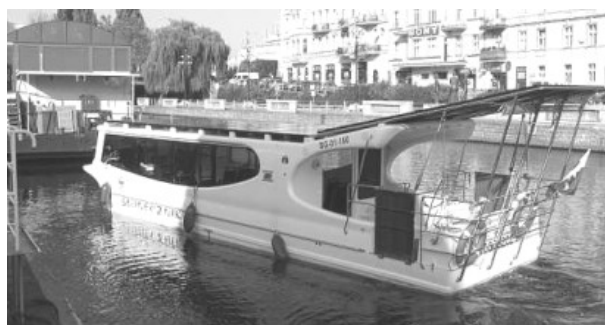
Рис. 2. Судно «Słonecznik» в Быдгоще [6]

О новом этапе развития водного транспорта в Быдгоще можно говорить в связи с вводом в эксплуатацию водных трамваев, работающих на солнечных батареях, «Słonecznik» (рис. 2) и «Słonecznik II». Эти суда, курсирующие по водам Брды, являются первыми пассажирскими речными судами в Польше, на которых основным источником энергии являются солнечные батареи. Генерированная этими батареями энергия накапливается в двух комплектах аккумуляторных батарей, емкости которых хватает на 10 часов плавания со скоростью 6 км/ч. Максимальная скорость передвижения судна – 12 км/ч. Высокую маневренность судну обеспечивают два кормовых азимутальных