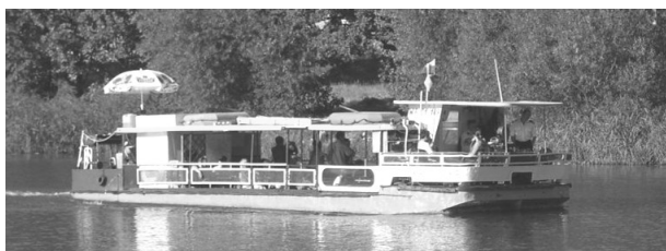
Рис. 4. «Kaczuszka» на маршруте рейса [8]

Во Вроцлаве интенсивное развитие водного транспорта начиналось с судна «Kaczuszka» (рис. 4), которое в прошлом функционировало как речной трамвай. В настоящее время «Kaczuszka» ходит по туристическому маршруту, базируясь на пристани Звежинецка во Вроцлаве.