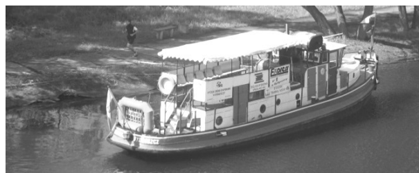
Рис. 1. Судно «Bydgoszcz» на водах Брды [5]

В Быдгоще судно «Bydgoszcz» (рис. 1) ходит по реке Брдзе с 2004 года. История судна начинается с 1913 года и за этот долгий период менялись как владельцы, так и его эксплуатационное назначение. В настоящее время судно ходит по туристическому маршруту, только по выходным, размещая на борту 24 человека. Скорость судна не превышает 10 км/ч.