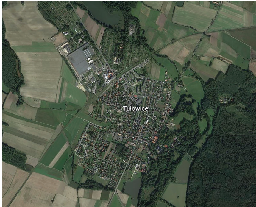
Rys. 2. Układ przestrzenny współczesnych Tutowic; źródło: https://earth.google.com/web

Wieś Tutowice (niem. Tillowitz) wzmiankowana była po raz pierwszy w 1447 r. Pierwotnie należała do Piastów opolskich. Po wygaśnięciu książęcej linii w 1532 r. dobra tutowickie należały kolejno do rodów von Promnitz, Zierotin i Praschma. Ostatnimi właścicielami Tutowic była rodzina von Frankenberg-Ludwigsdorf (1835–1929), której inicjatywą obok wielu działań była przebudowa pałacu w stylu neorenesansu wraz z założeniem parkowym w stylu angielskim. Historia miejscowości od XVIII w. łączy się z lokalnym przemysłem. Wówczas z inicjatywy rodziny von Praschma w pobliskich Tutowicach Małych (niem. Asche, później