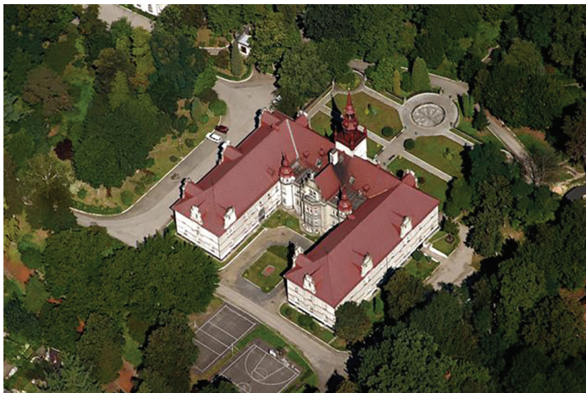
Rys. 5. Dawne założenie pałacowo-parkowe rodziny von Frankenberg-Ludwigsdorf: neorenesansowy pałac i park w stylu angielskim, obecnie siedziba Zespołu Szkół, widok z lotu ptaka; źródło: R. Hlawacz, 2005

gospodarką leśną i produkcją ceramiki. W pobliżu zespołu pałacowo-parkowego zlokalizowany jest zespół obiektów Nadleśnictwa Tułowice, które gospodaruje na gruntach należących administracyjnie do 3 powiatów (opolskiego, brzeskiego i nyskiego). W granicach miasta znajduje się podstrefa Specjalnej Strefy Ekonomicznej „Starachowice” SA utworzona w 2005 r. na terenach dawnych zakładów porcelitu. Na jej obszarze funkcjonują zarówno przedsiębiorstwa z branży ceramicznej kontynuujące tradycyjną dla tych terenów formę wytwórstwa, jak i przedsiębiorstwa z branży wyrobów aluminiowych, odzieżowej oraz meblarskiej [7].