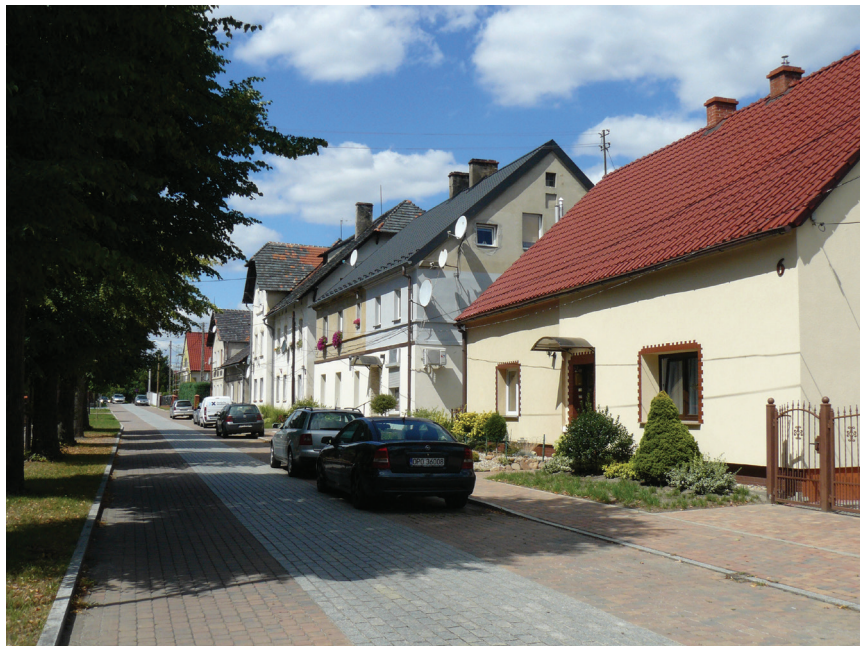
Rys. 3. Zabudowa ulicy Szkolnej w obszarze najstarszej jednostki morfogenetycznej Tutowic

Theresienhütte) uruchomiono hutę (wielki piec i 2 fryszerki), kontynuując wcześniejsze tradycje hutnicze miejscowości. Z początkiem XIX w. w Tutowicach zainicjowano produkcję fajansu w oparciu o lokalne złoża glin ceramicznych [2].