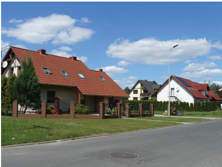
Rys. 4. Fragment nowego zespołu zabudowy mieszkaniowej jednorodzinnej o miejskim charakterze w południowo-zachodniej części Tułowic

w rękach rodziny Frankenberg, po modernizacji została przystosowana do produkcji porcelany. Na początku XX w. Erhard Schlegelmilch z Turyngii, z rodziny fabrykantów porcelany, początkowo dzierżawca fabryki, wybudował nowy zakład produkcji porcelany na terenach korzystnie położonych przy stacji kolejowej. W 1910 r. fabryka zatrudniała już 600 osób. Tułowicką porcelanę produkowaną w oparciu o nowoczesną technologię cechowała wysoka jakość oraz różnorodność form, większość produkcji eksportowano. Wraz z uruchomieniem nowej fabryki w jej sąsiedztwie powstały budynki mieszkalne dla pracowników. Rodzina Schlegelmilch wyznania ewangelickiego była fundatorem kościoła dla tułowickiej wspólnoty protestanckiej, wniosła również wkład w budowę szkoły ewangelickiej.