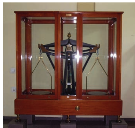
Waga legalizacyjna z 1952 r.

Najbardziej dramatycznym wydarzeniem w historii okręgu wrocławskiego była wielka powódź w 1997 r., w wyniku której mocno ucierpiała część budynków, będą-