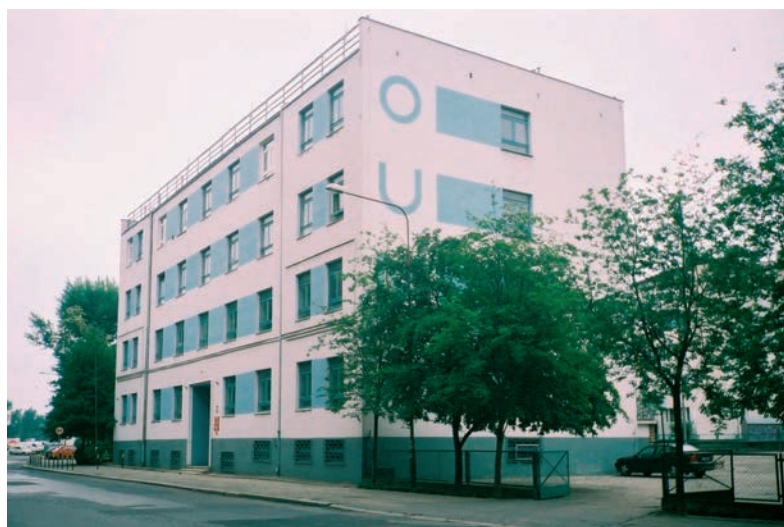
Siedziba Okręgowego Urzędu Miar we Wrocławiu

Od 19 stycznia 2006 r. OUM we Wrocławiu Zespół Laboratoriów Wzorcujących posiada akredytację PCA w zakresie następujących dziedzin pomiarowych: długość, kąt, geometria powierzchni, spektrofotometria, ciśnienie, objętość, siła, twardość, masa, czas i częstotliwość, wielkości elektryczne DC i mała częstotliwość, akustyka, wielkości chemiczne, temperatura.