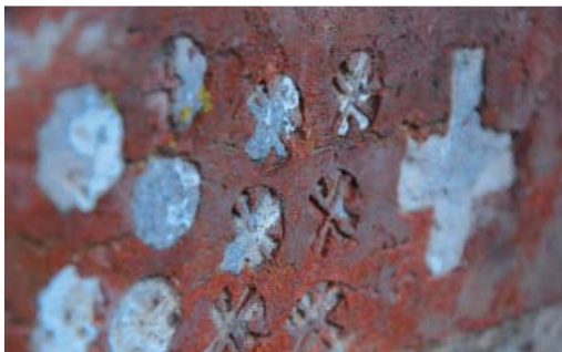
Fot. 4. Cegła z odciskami okrągłych stempli i krzyża, na elewacji północnej zamku joannitów w Słońsku (pow. sulęciński), fot. A. Duda.