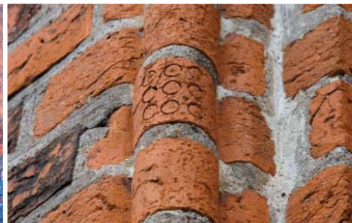
Fot. 6. Zwielokrotniony odcisk okręgów wykonany w kształtce ceramicznej w ościeża otworu okiennego kościoła parafialnego pw. Matki Bożej Różańcowej w Lubniewicach (pow. sulęciński), fot. A. Duda.

które zlokalizowano podczas badań terenowych na obszarze województwa lubuskiego. Szczegółowe zestawienie wyników tych badań zawarte zostanie w odrębnym opracowaniu katalogowym.