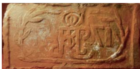
Fot. 7. Cegła odnaleziona na terenie Starego Miasta w Kostrzynie nad Odrą, prezentowana na ekspozycji Muzeum Twierdzy Kostrzyn. Na płaszczyźnie widnieją odcisk specjalnie przygotowanego stempla z datą 1751 oraz monogramem, fot. A. Duda.

Interesujący materiał ceramiczny zlokalizowany został na terenie dawnej twierdzy w Kostrzynie nad Odrą. Najstarsze cegły, wydobyte podczas badań archeologicznych na obszarze tzw. Starego Miasta, mają oznaczenia wykonane ręcznie w formie rysunków i dat oraz odcisków tworzących motyw słoneczny. Jedna z nich, prezentowana na ekspozycji muzealnej, zawiera odcisk specjalnie przygotowanego stempla, obejmującego całą płaszczyznę cegły, zawierającego datę 1751 i monogram, ujęte w formę uproszczonej wici roślinnej (fot. 7). Na dwóch kolejnych ceglach odcisnięty został motyw słoneczny oraz trzy odciski racic. Ponadto w reliktach murów w rejonie Bramy Gorzyńskiej, zachowane są liczne cegły wyprodukowane maszynowo, które posiadają sygnatury cegielni w formie stempli. Wśród nich zidentyfikowano cegłę z cegielni Carla Ericha Seyringa i jego synów w Birkenwerder, o czym świadczy okrągły stempel o średnicy 3 cm z napisem Birken - werder C ESS 8 , oraz cegłę