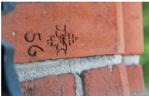
Fot. 9. Jedna z sygnowanych cegieł w elewacji budynku dawnego szpitala na terenie zespołu szpitalnego księżnej Doroty de Talleyrand-Périgord w Żaganiu.