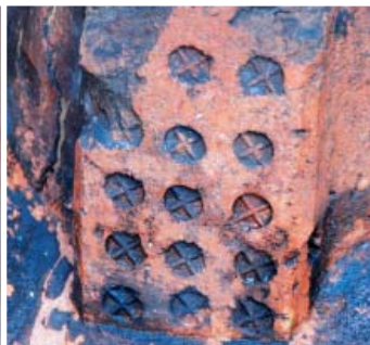
Fot. 5. Jedna z kilku ceramicznych baz w portalu głównym katedry św. Piotra i Pawła w Brandenburgu nad Hawelą, fot. A. Duda.