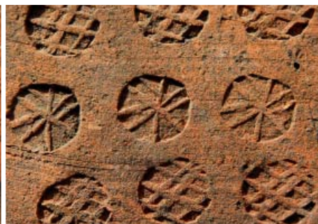
Fot. 3. Fragment dachówki karpiówki w typie tzw. ogona bobra (niem. Biberschwantz), z odciskami stempli. Egzemplarz pochodzący z dachu kościoła pw. św. Marcina w Świdnicy (pow. zielonogórski), fot. A. Duda.