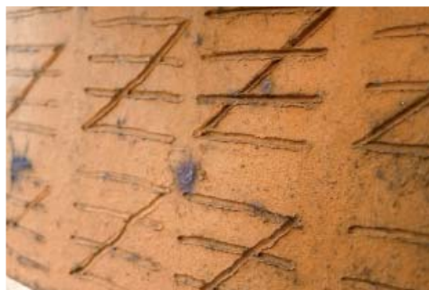
Fot. 1. Przykład cegły z utrwalonym w niewypalanej glinie wizualnym odliczaniem produktu przez strycharza, fot. A. Duda.