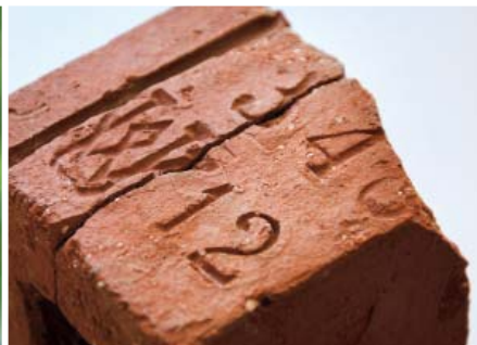
Fot. 10. Kształtka ceramiczna opatrzona stemplem numerycznym i sygnaturą producenta, przechowywana w zbiorach Muzeum Śląsko-Łużyckiego w Żarach, fot. A. Duda.

sygnowaną prostokątnym stemplem z napisem KUNHEIM & Co. / FREIENWALDE a/O.