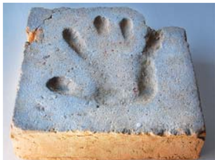
Fot. 8. Płytkę posadzkową z odciskiem dłoni odnalezioną w kościele filialnym pw. św. Judy Tadeusza w Rudnie (pow. nowosolski), fot. A. Duda.