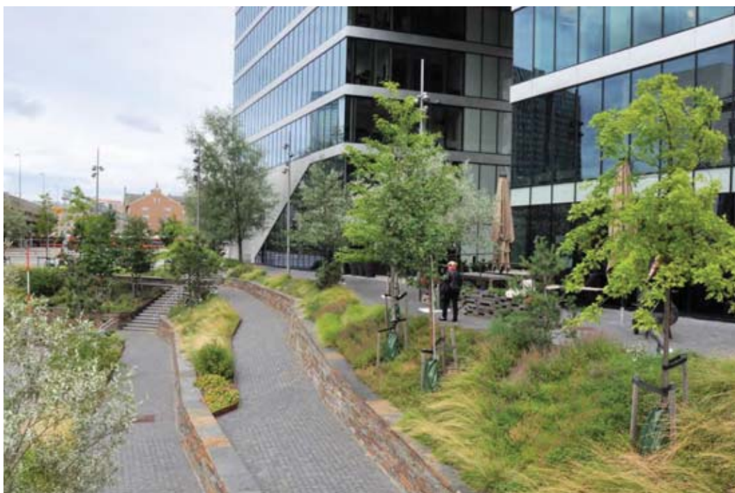
Il. 7. Starannie zaprojektowana strefa rekreacyjna w bezpośrednim otoczeniu biurowca Price Waterhouse Coopers - widok od zachodu, w głębi po prawej – w zagłębieniu strefa wejściowa do budynku

Ill. 6. The Price Waterhouse Coopers office