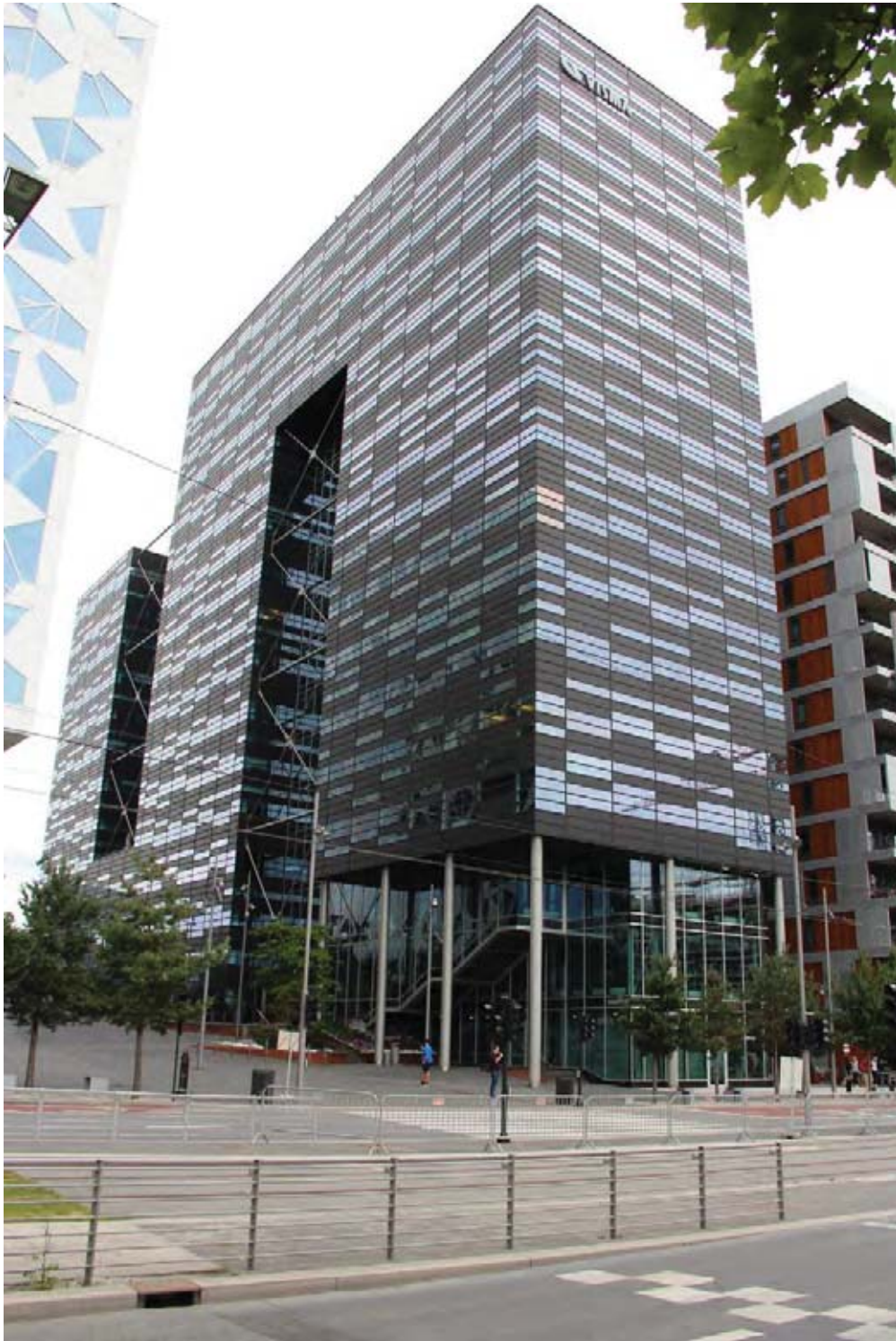
Il.12. Biurowiec Visma , widok strefy wejściowej