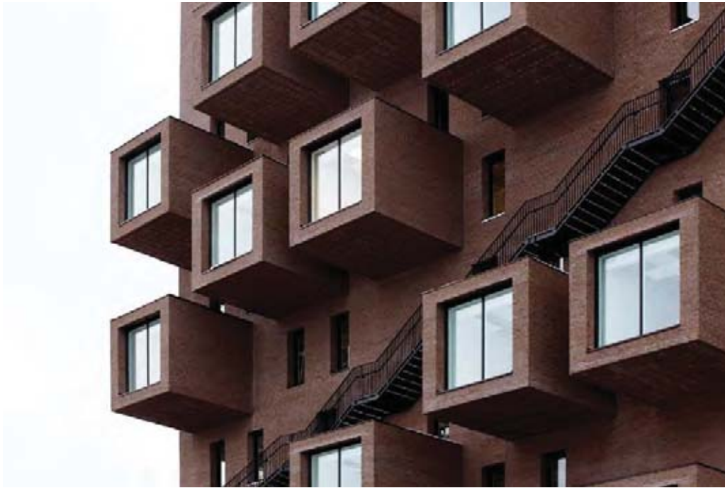
III. 21. Budynek The Wedge cechuje charakterystyczny układ wystających poza lico budynku wykuszy - sal konferencyjnych oraz zewnętrznej klatce ewakuacyjnej

II. 21. The Wedge building is characterized with the distinctive arrangement of the protruding bay windows – conference rooms, and the outer escape staircase ( source: a-lab.no , 18.06.2018 access)