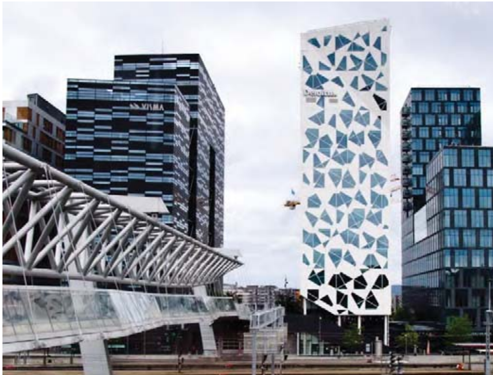
Il.10. Biurowiec Deloitte (po prawej stronie kładki) wyróżnia się wśród biurowców nieregularnym układem okien oraz jasną kolorystyką elewacji.