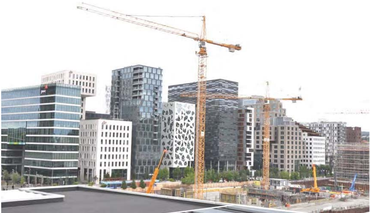
Il. 3. Widok na pierzeję północną Kodu Kreskowego , stan z lipca 2017 roku