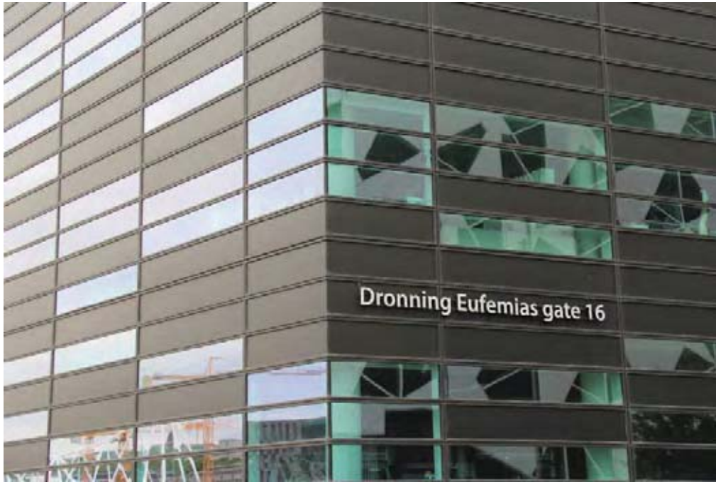
Il.13. Detal elewacji biurowca Visma . Elewacja budynku została wykonana jako tzw. „fasada pikselowa” o nieregularnym układzie okien