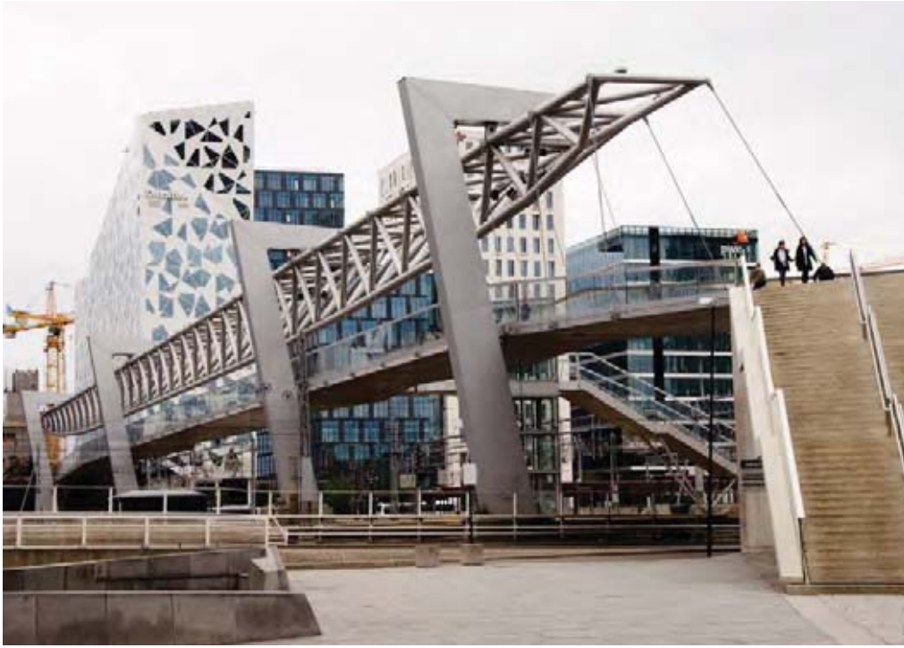
Il. 4. Widok na kładkę Akrobaten przerzuconą ponad torami głównego Dworca Głównego w Oslo, łącząca dwie dzielnice Gronland i Bjorvika