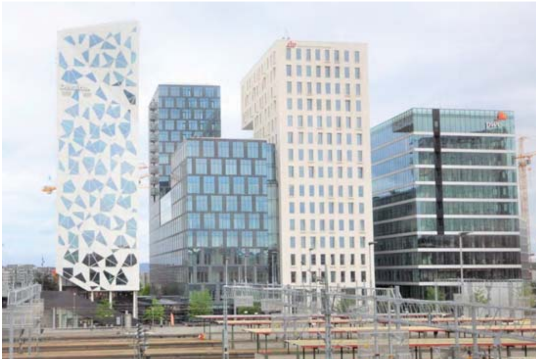
Il.8. Siedziba Kommunal Landspensjonskasse . Budynek to układ dwóch brył kontrastowych wizualnie, połączonych przewiązką (biurowiec w środku kadru) (fot. Katarzyna Zawada-Pęgiel, 2017)