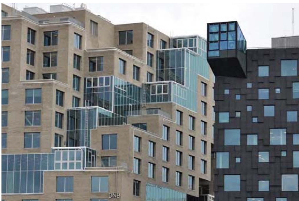
Il. 17. Budynek DNB „A” to biurowiec o rozbudowanej strefie przestrzeni wspólnych (tarasy, wykusze, nisze, komunikacja pionowa)

Ill. 17. The DNB „A” building is the office with a complex zone of the common spaces (terraces, bays, niches, vertical communication)