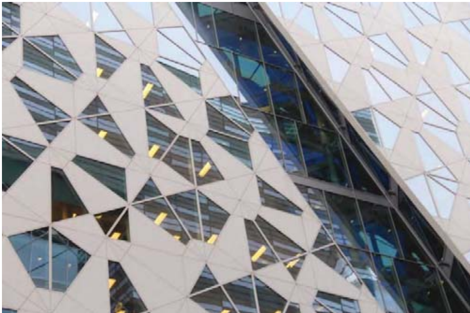
Il.11. Detal elewacji siedziby Deloitte . Kształt okien i paneli jest inspirowany jest formą odłamków brył lodu