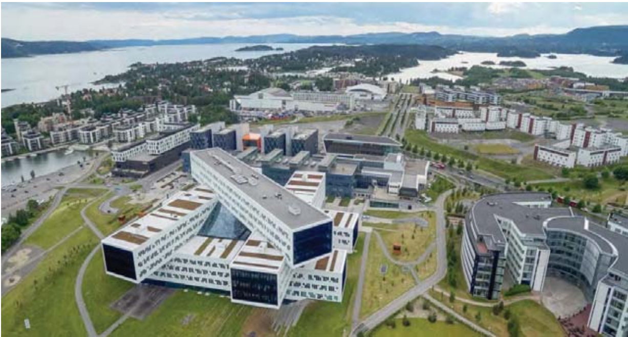
Il. 2. Widok z lotu ptaka na założenie Fornebu – nową wielofunkcyjną dzielnicę biznesową powstałą na terenie byłego lotniska. Na pierwszym planie siedziba biur międzynarodowych koncernu Statoil