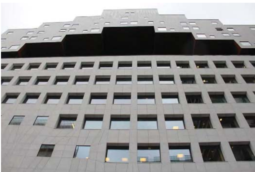
Il. 18. Biurowiec DNB „B”. Biurowiec charakteryzuje się uproszczoną formą z wielowymiarowym rysunkiem (podziałem płyt elewacyjnych) na elewacjach i charakterystycznym schodkowym zwieńczeniu formy

Ill. 17. The DNB „A” building is the office with a complex zone of the common spaces (terraces, bays, niches, vertical communication)