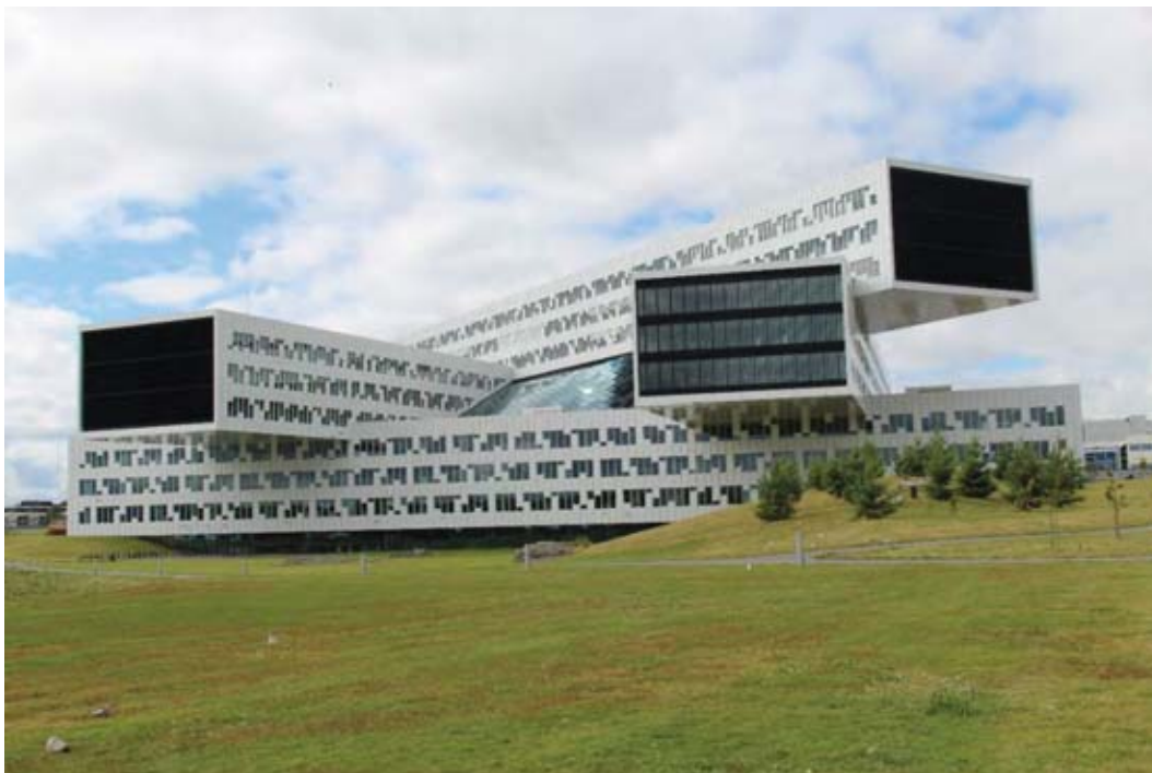
II. 22. Siedziba Statoil w Fornebu . Forma składa się z pięciu krzyżujących się ze sobą prostopadłościennych brył oraz atrium

II. 21. The Wedge building is characterized with the distinctive arrangement of the protruding bay windows – conference rooms, and the outer escape staircase