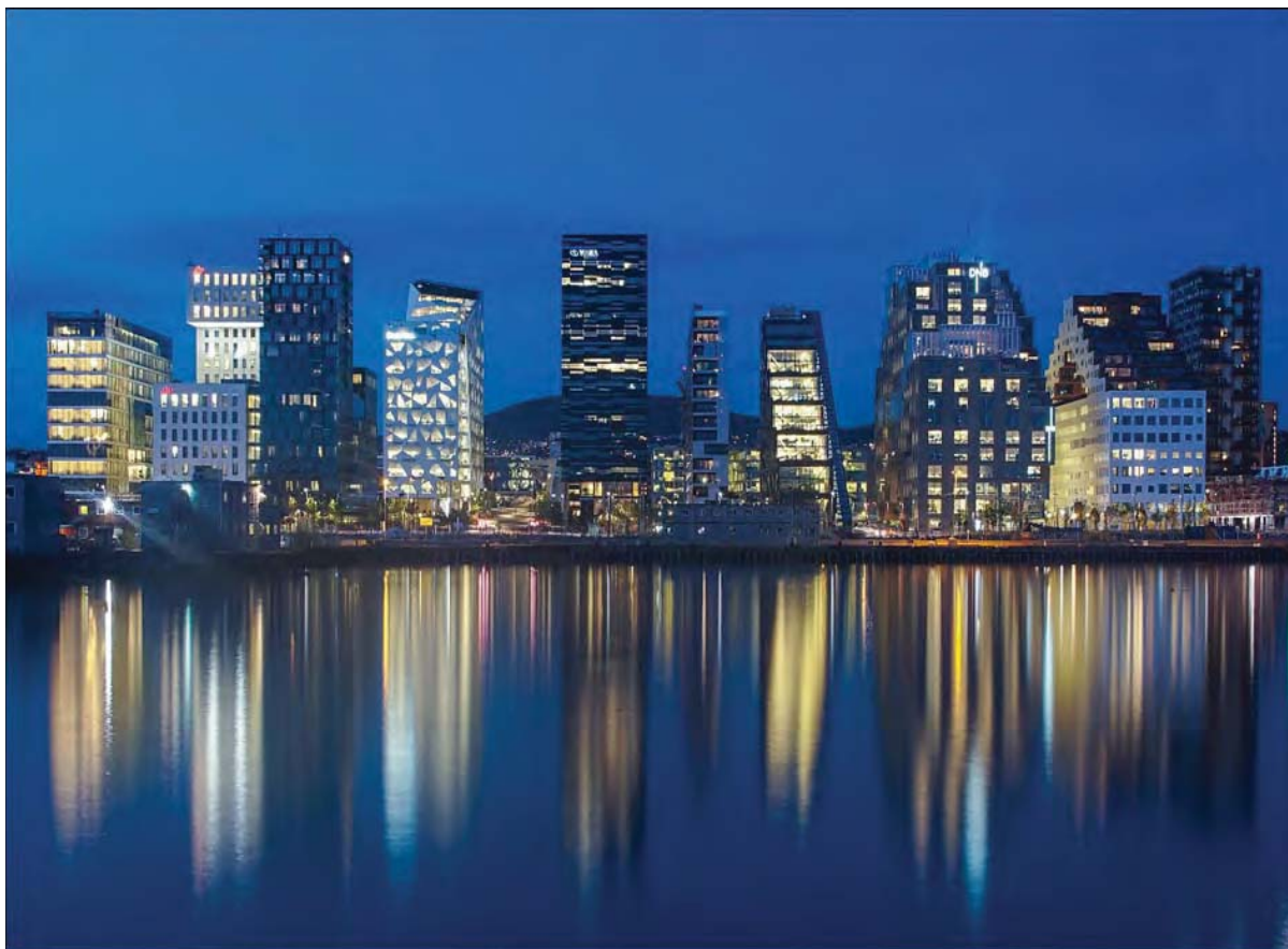
Il. 1. Widok nocny na zespół Kodu Kreskowego w Oslo z wód fiordu – stan z września 2014

To co może u nas budzić zazdrość we wznoszeniu rozleglejszych założeń biurowych, to ich spójność i widoczne myślenie o całości układu, zarówno we względzie funkcjonalnym (wspólne parkingi podziemne, wspólne usługi, funkcje pomocnicze i układ przejść pieszych) jak i formalnym uporządkowaniu i czytelności kompozycyjnej. Reasumując, można powiedzieć, że spójność i dyscyplina w skali urbanistycznej idzie w parze ze swobodą i różnorodnością w formowaniu i szukaniu indywidualnego wyrazu. Porównując realizacje polskie, choćby licznie realizacje na terenie naszej Stolicy, trudno z ubolewaniem nie zauważyć różnicy w kulturze zagospodarowania miasta i w kształtowaniu jego przestrzeni. Można mieć tylko nadzieję, że z czasem odpowiedzialność za obraz miasta, za jego układ i zalety funkcjonalne, stanie się powszechnością w myśleniu i działaniu inwestycyjnym również u nas.