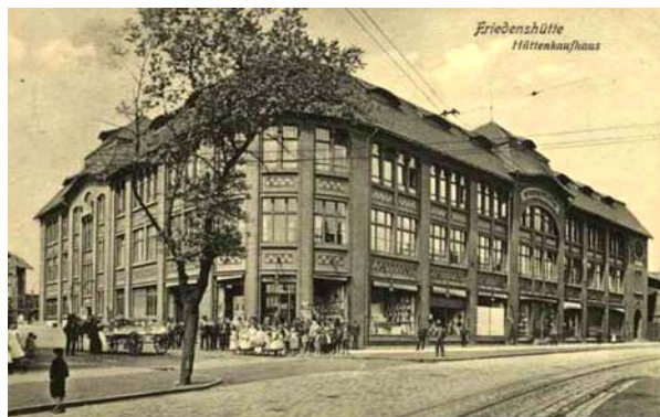
Ryc. 3 Kaufhaus w 1. połowie XX wieku na archiwalnej pocztówce.