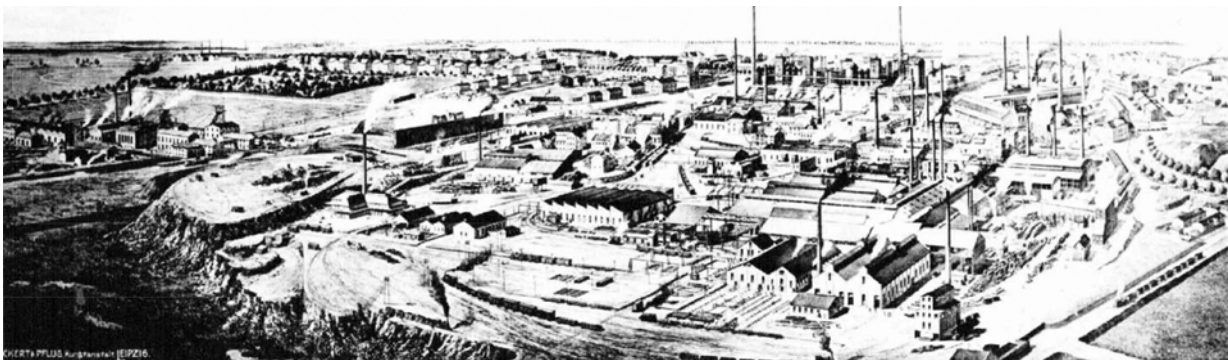
Ryc. 1. Friedenshütte – panorama z 1906 r. Rycina [w:] http://www.wirtualnaruda.pl/BK/1295-BK.pdf