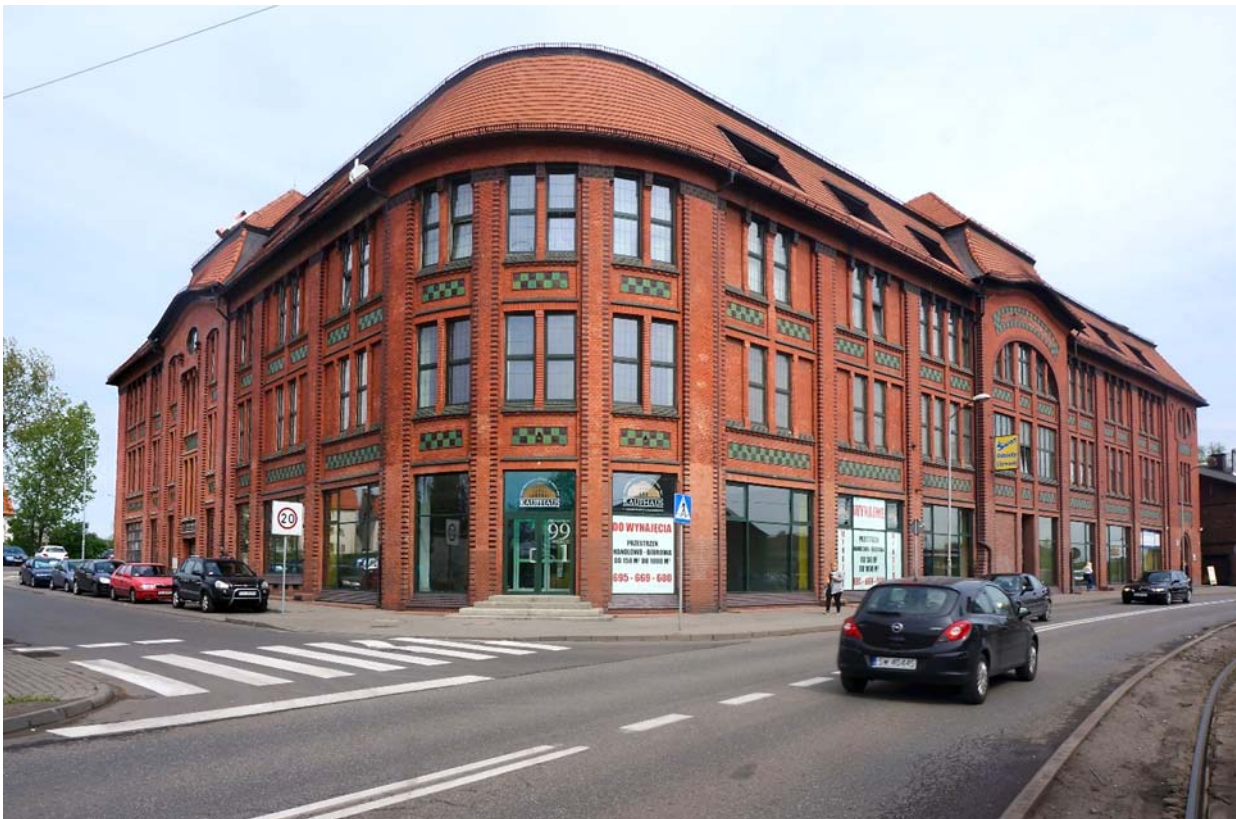
Ryc. 6 Kaufhaus po rewaloryzacji. Fot. [w:] archiwum autora, kwiecień 2018 Fig.6 Kaufhaus after revalorisation. Photo: [in:] author's archive, April 2018