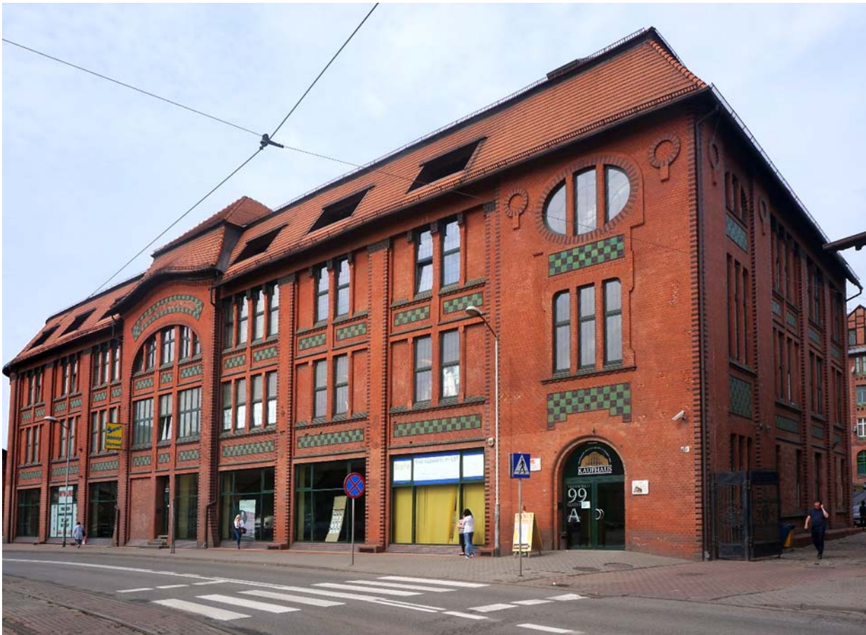
Ryc. 5 Kaufhaus po rewaloryzacji. Fot. [w:] archiwum autora, kwiecień 2018 Fig.5 Kaufhaus after revalorisation. Photo: [in:] author's archive, April 2018