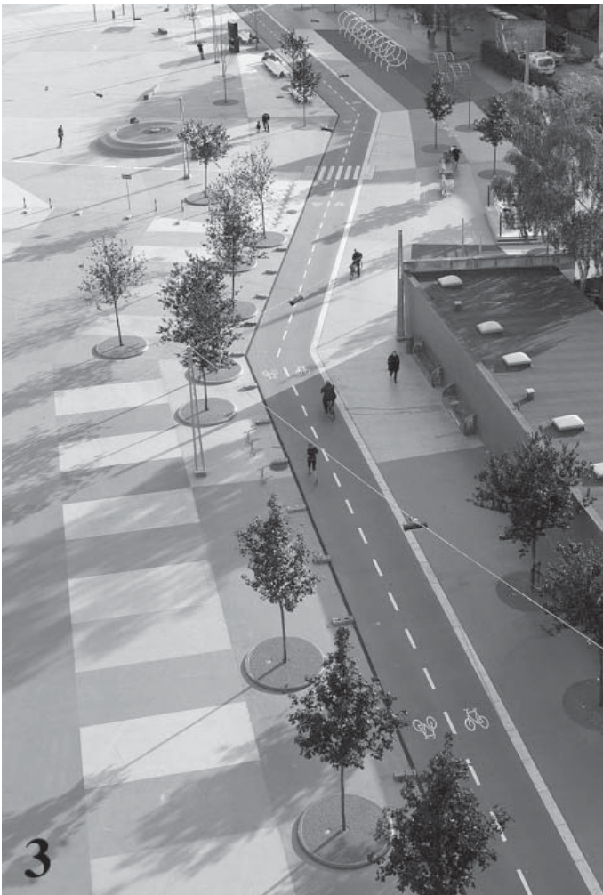
il. 3. Widok placu Czerwonego / View of the Red square. Author: Iwan Baan. Source: www.archdaily.com

funkcjonalnego. Następnie skonfrontowanie braków, niedostatków z potencjalnymi możliwościami rozwojowymi i zmianami możliwymi do przeprowadzenia. Kolejnym krokiem jest sprecyzowanie czytelnych celów procesu odnowy danego terenu w zakresie architektonicznym, urbanistycznym z włączeniem celów społecznych. Po trzecie w każdym z przypadków prowadzonej działalności w zakresie re-użycia przestrzeni następuje etapowanie projektu, podział na poszczególne cele szczegółowe. Począwszy od podziału na pojedyncze obszary, przypisywanie zamiennego sposobu użytkowania, podział na nowe i określenie doinwestowania istniejących funkcji, propozycje szczegółowych rozwiązań architektonicznych i w zakresie elementów wyposażenia. Ostatecznie następuje precyzowanie materiałowe, w zakresie użytej kolorystyki przestrzeni, wnętrza i wzornictwa. Na koniec, w ostatnim etapie mamy do czynienia z oceną efektów uzyskanej przemiany i porównanie ich z założeniami fazy wstępnej całego procesu, jednak taka ocena może być przeprowadzona po pewnym czasie użytkowania.