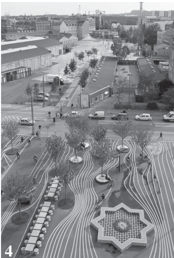
il. 4. Widok na plac Czarny i Czerwony / View of the Black and Red square. Author: Iwan Baar. Source: www.archdaily.com

Oprócz sztuki i kultury, przestrzeń sportowa została wprowadzona do projektu jako uniwersalna, a największą prezentacją jest tutaj nowo wybudowana część