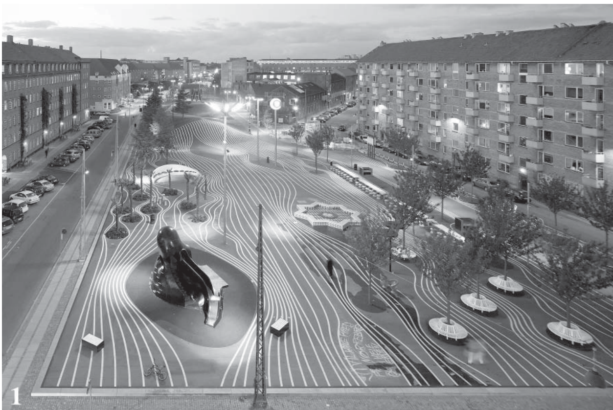
il.1. Widok placu Czarnego / View of the Black square. Author: Iwan Baan. Source: www.archdaily.com

Development and design of public spaces should be subordinated to the contemporary trends related to eco-development of the city. This is the reason for being so eager to draw attention to existing locations, which can be reused to reduce the incon-