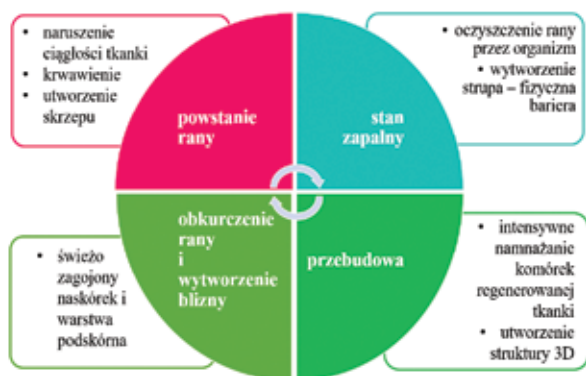
Rysunek 1 Schemat prawidłowo przebiegającego procesu gojenia rany

Rany chroniczne są ranami trudno gojącymi się, gdzie czas leczenia przekracza zakładane 12 tygodni. Niejednokrotnie rany te odnawiają się. Często są zanieczyszczone i charakteryzują się znacznym ubytkiem tkanki, dodatkowo prowadząc do uszkodzenia głębszych struktur ciała takich, jak mięśnie i ścięgna, czy naczynia krwionośne i nerwy. Rany te nie ulegają gojeniu, co w rezultacie prowadzi do zakłócenia normalnego procesu rekonstrukcji. Istnieje kilka istotnych czynników, które prowadzą do powstania rany chronicznej. Są to między innymi: