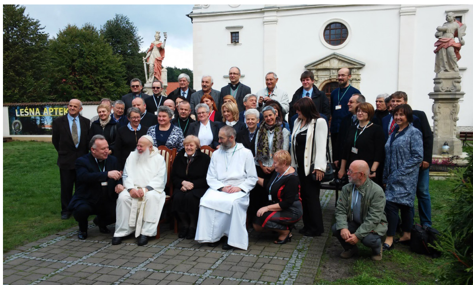
Fot.3 Rytwiany, uczestnicy Sympozjum Jubileuszowego i honorowi goście: przeor eremu w Monte Rua i przeor pustelni na Bielanych w Krakowie - przed fasadą kościoła. Fot. E. Brykowska-Liniecka, 2017

oraz księgę opisującą dzieje Rytwian na tle regionu 24 .