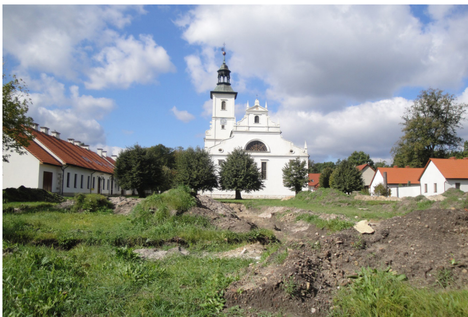
Fot.1 Rytwiany, Relaksacyjno-Kontemplacyjne Centrum Terapeutyczne SpeS, widok od wschodu; badania archeologiczne na terenie eremitorium.