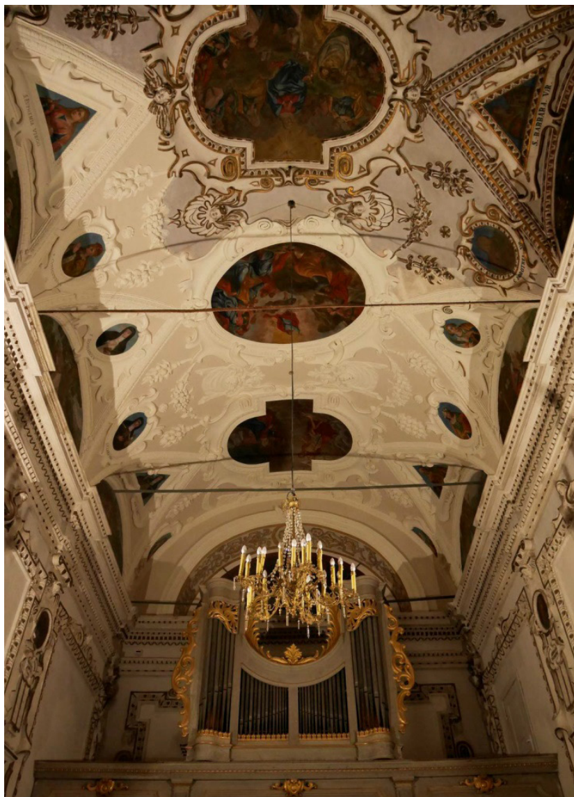
Fot.2 Rytwiiany, kościół, wnętrze nawy, widok sklepienia podczas prac konserwatorskich.

i Międzynarodowej Unii Architektów (UIA). Nie ma wątpliwości, że dzięki sprawnemu od początku zarządzaniu w procesie rewaloryzacji, konserwacji i adaptacji zachowano najważniejsze oryginalne wartości zabytkowe, architektoniczno-przestrzenne i artystyczne zespołu, jednocześnie zapewniając użytkownikom atrakcyjny program funkcjonalny i standardy współczesne 20 .