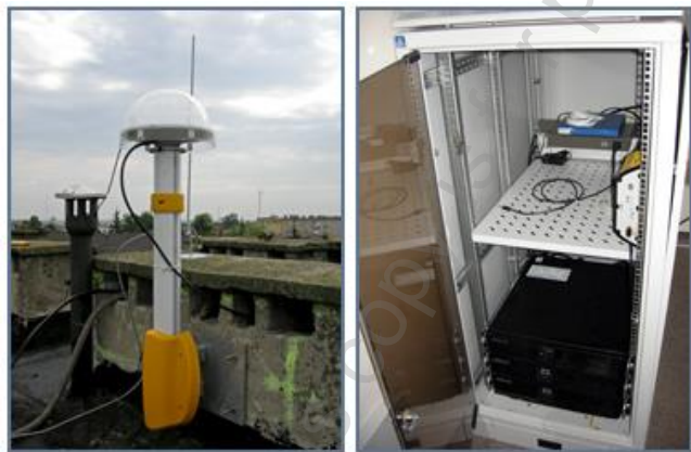
Rys. 5. Infrastruktura techniczna stacji referencyjnej RYKI [14]

W eksperymencie zostały wykorzystane dobowe obserwacje GPS w formacie RINEX 2.11 ze stacji referencyjnej RYKI w województwie lubelskim. Stacja RYKI stanowi część systemu precyzyjnego pozycjonowania satelitarnego na obszarze Polski (ASG-EUPOS), a jej infrastruktura została umieszczona na dachu Starostwa Powiatowego w Rykach (rys. 5).