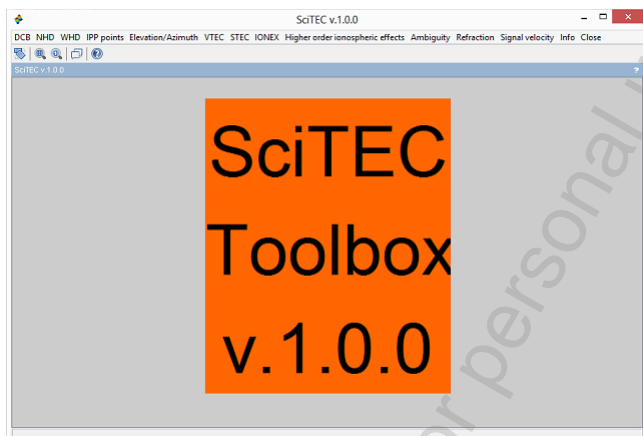
Rys. 4. Interfejs programu SciTEC Toolbox 1.0.0

Mapy jonosfery VTEC zostały wyznaczone przy pomocy programu SciTEC Toolbox 1.0.0 (rys. 4), napisanym przez autora w edytorze Scilab 5.4.1.