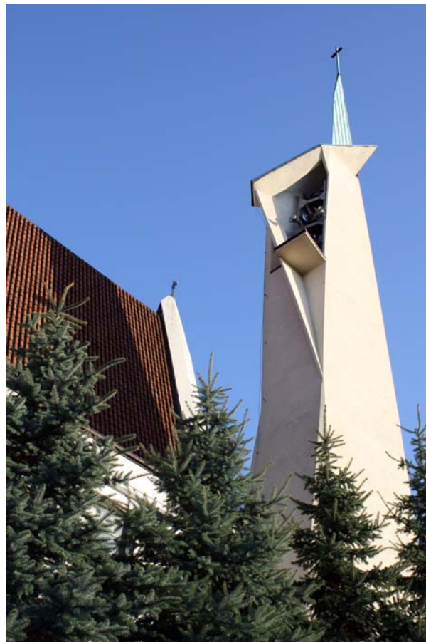
Ryc. 3. Kościół pw. Matki Bożej Fatimskiej w Tarnowie (1957–60), proj. Jerzy Kozłowski, Krystian Seibert, Zbigniew Wolak, współpraca Kazimierz Pencakowski, wieża

Takiego zadania podjął się zespół architektów w 1957 roku w składzie: Jerzy Kozłowski, Krystian Seibert, Zbigniew Wolak we współpracy z Kazimierzem Pencakowskim, którzy zaprojektowali kościół