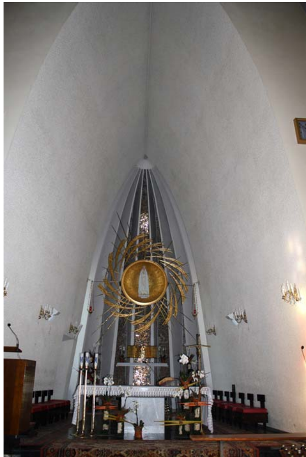
Ryc. 5. Kościół pw. Matki Bożej Fatimskiej w Tarnowie (1957–60), proj. Jerzy Kozłowski, Krystian Seibert, Zbigniew Wolak, współpraca Kazimierz Pencakowski, prezbiterium

pw. św. Józefa i Matki Bożej Fatimskiej w Tarnowie, ukończony w 1960 roku 12 (ryc. 2). Budowla jest założeniem jednorodnym o konfiguracji dachowo-ściennej z namiotowym korpusem. Obrys rzutu kościoła jest asymetrycznym wielobokiem. Tradycyjna trójnawowa osiowość założenia naruszona została poprzez niesymetryczne usytuowanie zakrystii i kaplicy o nieortogonalnym obrysie murów (ryc. 3). Trójnawowy korpus o łącznej szerokości 22 m i długości 45 m w południowo-zachodnim narożniku zdominowany został wieżą o łącznej wysokości 45 m, wykonaną z cegły stężonej pionowymi i poziomymi płaszczyznami betonu. Wieża, zwieńczona stalową iglicą obłożoną blachą miedzianą, utrzymana została w konwencji konstruktywistycznej (ryc. 4). Dach przykryty dachówką mnich-mniszka nawiązuje do tradycyjnych materiałów używanych w budynkach kościelnych. Cokół budowli zbudowany został z cegły i obłożony płytami z kamienia pińczowskiego. Stropy w nawach bocznych i kaplicy wykonane zostały z prefabrykowanych płyt żelbetowych. Przestrzeń wewnętrzna zdominowana jest sklepieniem nad nawą główną, której harmonijne przenikanie płaszczyzn doprowadza do punktu kulminacyjnego, jakim jest prezbiterium (ryc. 5). Ceglane sklepienie nad nawą główną i absydą oparte zostało