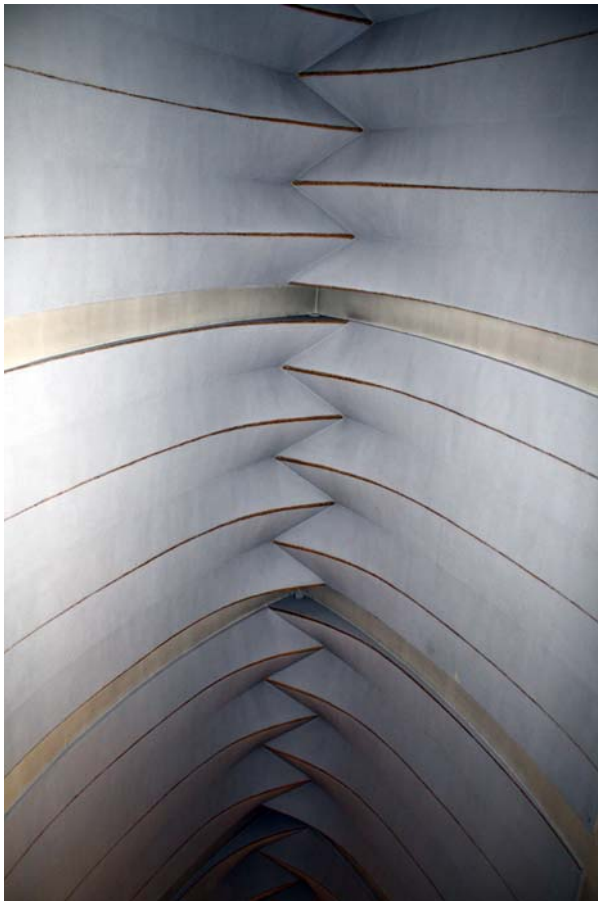
Ryc. 6. Kościół pw. Matki Bożej Fatimskiej w Tarnowie (1957–60), proj. Jerzy Kozłowski, Krystian Seibert, Zbigniew Wolak, współpraca Kazimierz Pencakowski, sklepienie nawy głównej