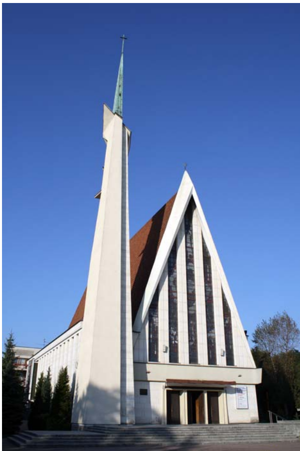
Ryc. 2. Kościół pw. Matki Bożej Fatimskiej w Tarnowie (1957–60), proj. Jerzy Kozłowski, Krystian Seibert, Zbigniew Wolak, współpraca Kazimierz Pencakowski