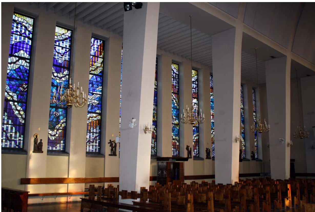
Ryc. 8. Kościół pw. Matki Bożej Fatimskiej w Tarnowie (1957–60), proj. Jerzy Kozłowski, Krystian Seibert, Zbigniew Wolak, współpraca Kazimierz Pencakowski, nawa boczna