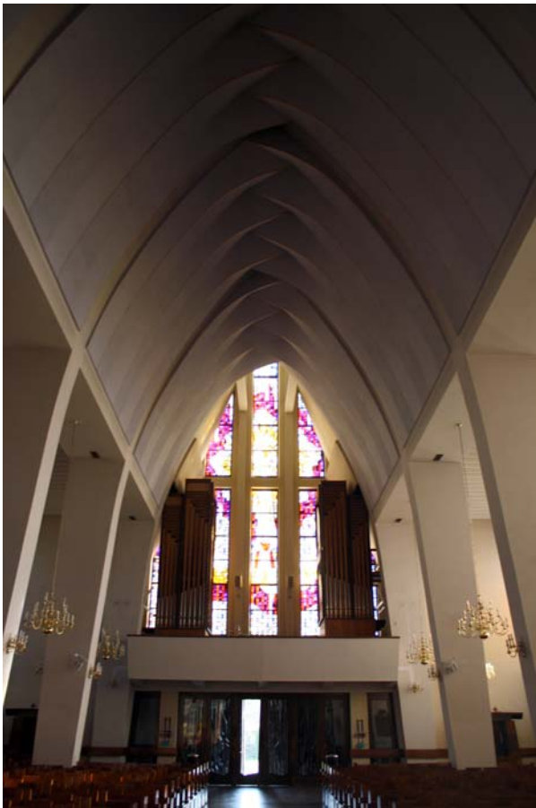
Ryc. 7. Kościół pw. Matki Bożej Fatimskiej w Tarnowie (1957–60), proj. Jerzy Kozłowski, Krystian Seibert, Zbigniew Wolak, współpraca Kazimierz Pencakowski, chór