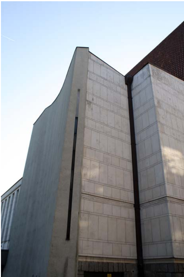
Ryc. 4. Kościół pw. Matki Bożej Fatimskiej w Tarnowie (1957–60), proj. Jerzy Kozłowski, Krystian Seibert, Zbigniew Wolak, współpraca Kazimierz Pencakowski, elewacja wschodnia

Fig. 4. Our Lady of Fatima church in Tarnów (1957–60), designed by Jerzy Kozłowski, Krystian Seibert, Zbigniew Wolak, cooperation Kazimierz Pencakowski, the eastern elevation