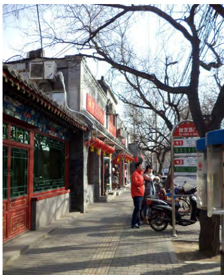
Ryc. 3. Ulica mieszkaniowo-handlowa w dzielnicy mieszkaniowej – Wrocław i Pekin