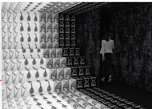
Fot. 3. Pawilon – Chóry (projekt: Ewelina Mamet)