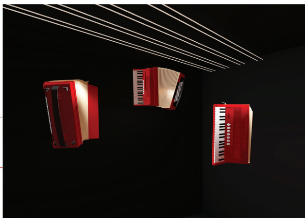
Fot. 7. Pawilon – Zespoły instrumentalne (projekt: Ewelina Mamet)