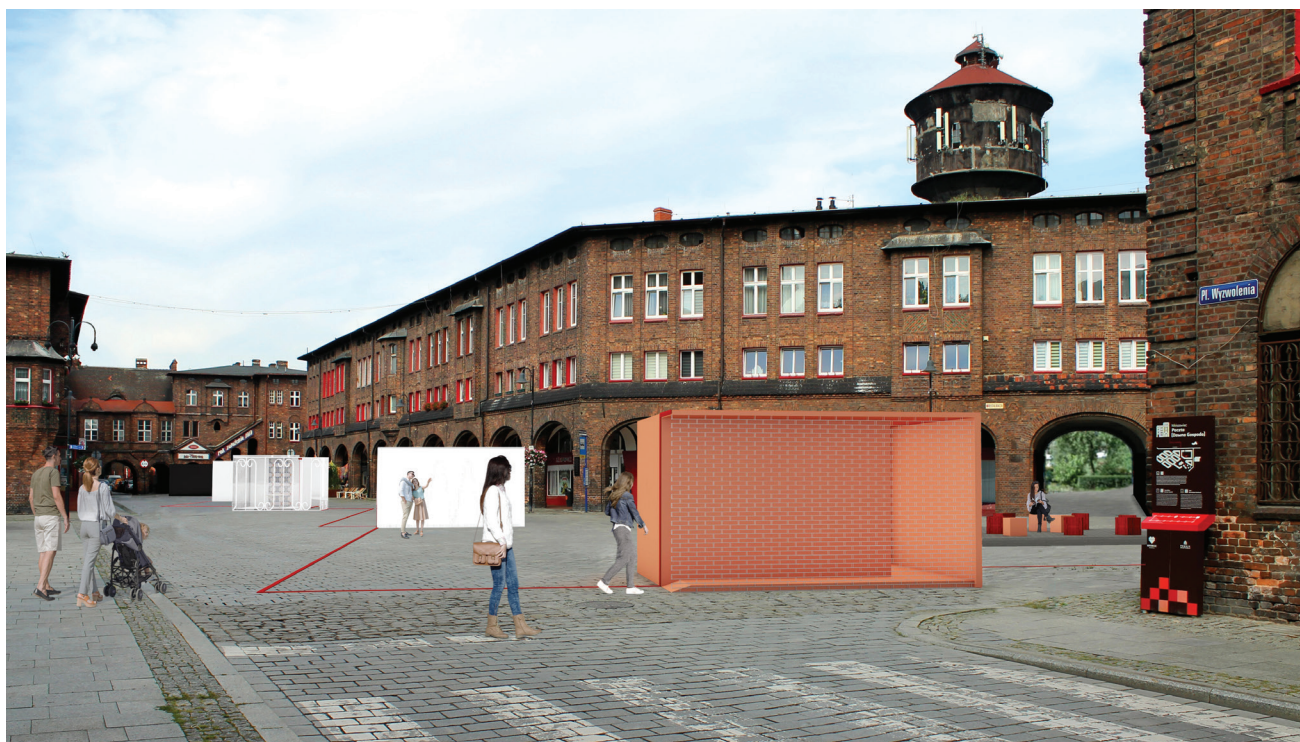
Fot. 1. Widok pawilonów wystawienniczych w wybranej lokalizacji (projekt: Ewelina Mamet)

zyki – kontekst śląski [3] wraz z informacją o przeprowadzonych badaniach, sposobie budowy koncepcji wystawienniczej oraz strukturze scenariusza. Ideą przywołanej wystawy jest kreacja skupiona wokół muzyki, która jako niematerialna część zasobu kulturowego została zinterpretowana przy użyciu języka architektury i sztuk plastycznych. Koncepcję wystawy zbudowano na tle śląskiej tradycji, co stanowi kluczowy element narracji projektowej. Jednocześnie odnosi się do lokalnej obyczajowości oraz cech tożsamościowych miejsca, w którym jest zlokalizowana.