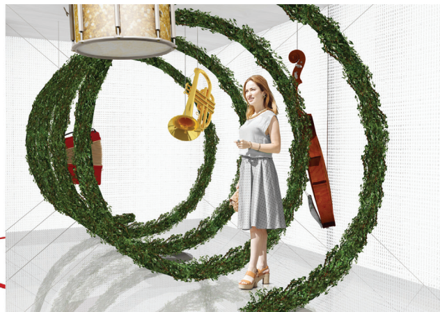
Fot. 5. Pawilon – Muzyka weselna (projekt: Ewelina Mamet)