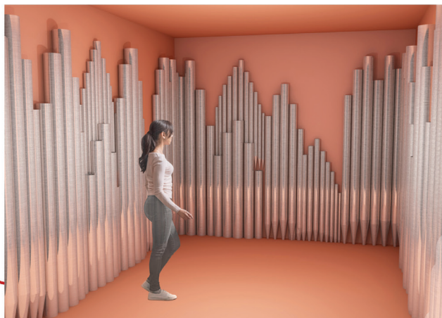
Fot. 6. Pawilon – Muzyka organowa (projekt: Ewelina Mamet)

się w ten sposób do śląskiej tradycji mirtowych wianków ślubnych. Natomiast luźno podwieszane instrumenty przywołują skład instrumentalny orkiestr weselnych. Ściany pokryte materiałem tworzącym transparentną strukturę nawiązującą do welonu, przenosząc akcent na osobę panny młodej.