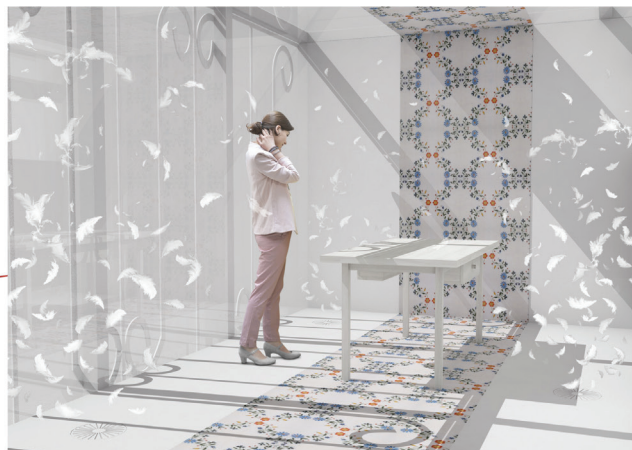
Fot. 4. Pawilon – Pieśni ludowe (projekt: Ewelina Mamet, źródło wzoru [23])

przejawów jego związków z muzyką. W skład instrumentalny orkiestr działających zwykle przy kopalniach zaliczają się trąbki, kornety, sakshorny, tuby, klarnety, dwumembranowe bębny lub zestawy perkusyjne [6]. Górniczy będący członkami orkiestry dętej są ubrani w mundury górnicze i co ważne, czerwony kolor pióropusza z czako, czyli czapki górniczej, został zarezerwowany wyłącznie dla nich [7]. Te charakterystyczne atrybuty ubioru i instrumentów muzyków orkiestr dętych stały się inspiracją dla projektu pawilonu orkiestr dętych. Ściany wewnętrzne, podłoga oraz sufit pawilonu zostały pokryte połyskującym złotym kolorem nawiązującym do materiału, z którego wykonane są instrumenty dęte. Z sufitu zwieszono czerwone pióropusze pochodzące z górniczego czako. Rozpięte są na różnej wysokości, wznoszą się pomiędzy poziomem podłogi a sufitem. Czarne ściany zewnętrzne, kontrastujące ze złotym wnętrzem pawilonu, nawiązują bezpośrednio do munduru górniczego. Ażurowa struktura zlokalizowana przy wejściu do obiektu stanowi przeskalowany fragment trąbki, której tloki o różnych wysokościach mają przywołać na myśl grający instrument.