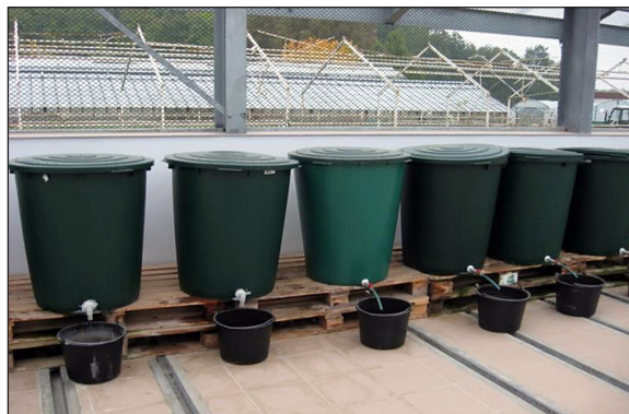
Rys. 1. Stanowisko badawcze Fig. 1. Experimental set-up

Do wykonania wypełnienia filtrów posłużył żwir, powszechnie stosowany w systemach