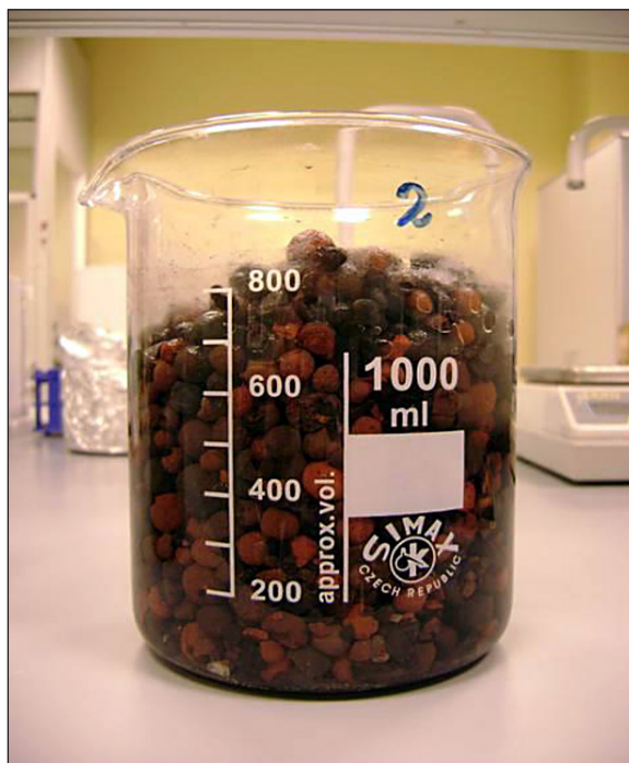
Rys. 2. Granulat powstały ze spalania osadów ściekowych Fig. 2. Filling composed of fly ashes from sewage sludge thermal treatment

gruntowo-roślinnych oraz granulatu typu LECA, w którego składzie znajdował się popiół powstały podczas procesu spalania osadów ściekowych (rys. 2). Popioły do przygotowania granulatu pochodziły ze spalarni osadów ściekowych znajdującej się na terenie Grupowej Oczyszczalni Ścieków „Dębogórze” w Gdyni. Metoda wytwarzania wypełnienia polegała na mechanicznym uplastycznieniu i rozdrobnieniu surowca, a następnie wypaleniu kuleczek w temperaturze 1200^\circ\text{C} w piecu obrotowym [Białowiec i in. 2009b]. Uzyskane wypełnienie charakteryzuje się gęstością właściwą równą 3,00 \text{ g/m}^3 oraz wytrzymało-