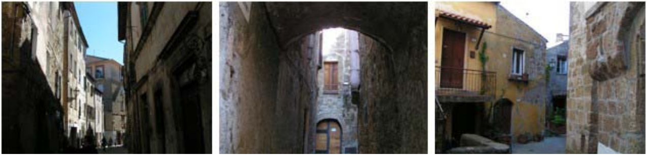
Il. 8, 9, 10. „Wnętrza” krajobrazów miasteczka Pitigliano w Toskanii. Fot. Anna Mitkowska, 2017