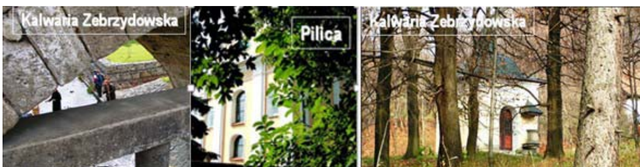
Il. 5, 6, 7. Okna (z lewej i w środku) i przełotki widokowe (z prawej). Wybrane przykłady uformowań sztucznych (budowlanych) i przyrodniczych (roślinność). Fot. Anna Mitkowska, 2004, 2005 (Pilica)

czone liczby obiektów o charakterze organicznym i malowniczym. Poczynając od XIII wieku, wraz z rozpowszechnianiem się postaw franciszkańskiego umiłowania przyrody i rozwijającą się stopniowo estetyką zmierzającą do renesansu, rezydencje, miasta i ogrody coraz częściej zaczynały otwierać się na przyrodę i doceniać jej piękno.