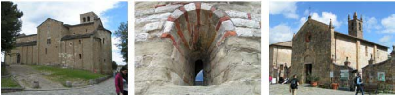
Il. 11, 12, 13. Romańskie kościoły typu pieve w Toskanii, San Leo i Monteriggioni (z prawej). Fot. Anna Mitkowska, 2017