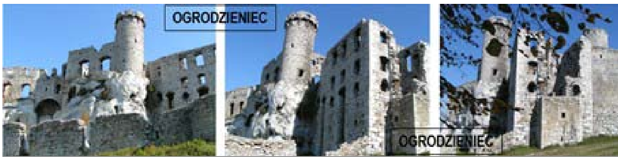
Il. 1, 2, 3. Ruiny zamku w Ogrodzieńcu, Jura Krakowsko-Częstochowska. Fot. Anna Mitkowska, 2007