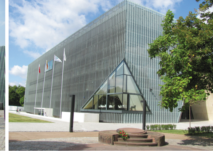
II. 1. II Pomnik Bohaterów Getta i Muzeum Żydowskie na Skwerze Willy’ego Brandta w Warszawie – fot. M. Gyrkovich / II Monument of the Heroes of the Ghetto and the Jewish Museum at Willy Brandt Garden Square in Warsaw— phot. by M. Gyrkovich II. 2. I Pomnik Bohaterów Getta i przed Muzeum Żydowskim w Warszawie – fot. M. Gyrkovich / I Monument of the Heroes of the Ghetto in front of the Jewish Museum in Warsaw – phot. by M. Gyrkovich