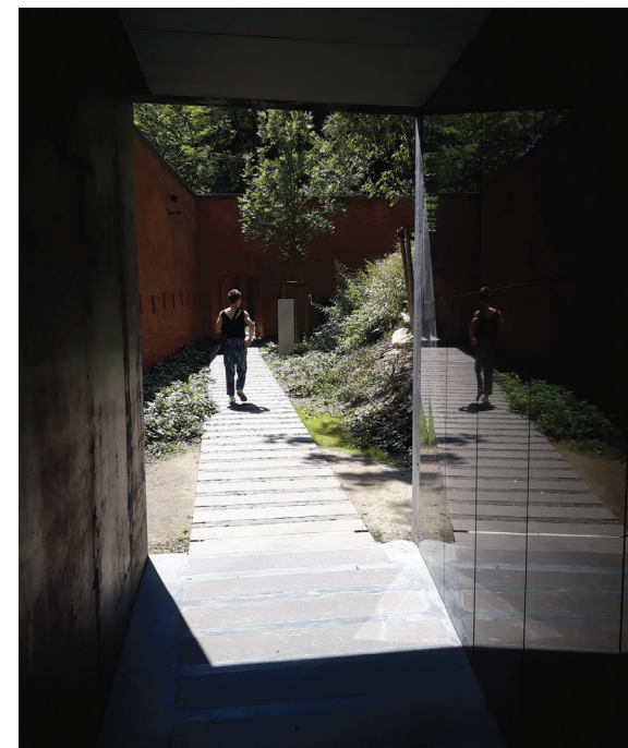
II. 17. Muzeum Katyńskie – Instalacja Aleja Nieobecnych w dawnej fosie / The Katyn Museum—the Aleja Nieobecnych (Alley of the Absent in English) installation in the former moat