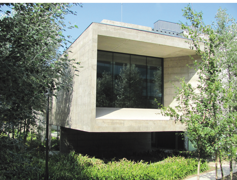
II. 11. Kwitnące wiśnie w styczniu na małym dziedzińcu Can Framis / Blooming cherry trees in January on the small courtyard of Can Framis