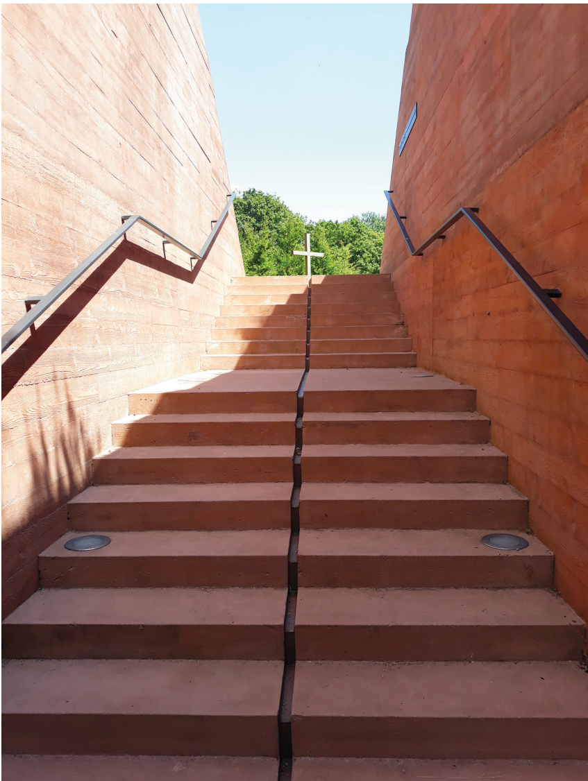
II. 19. Muzeum Katyńskie- schody prowadzące ze Strefy Pamięci w kierunku Placu Apelowego / The Katyn Museum—stairs leading from the Memorial Space in the direction of the drill square