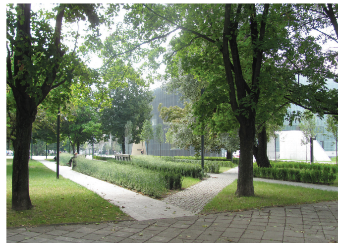
II. 4. 5. Skwer Willy’ego Brandta- zielone serce Muranowa / Willy Brandt Garden Square—the green heart of Muranów