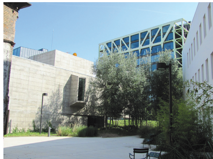
II. 8. Can Framis- główny wejściowy dziedziniec- widok w stronę ogrodów / Can Framis—main entrance courtyard—view in the direction of the gardens