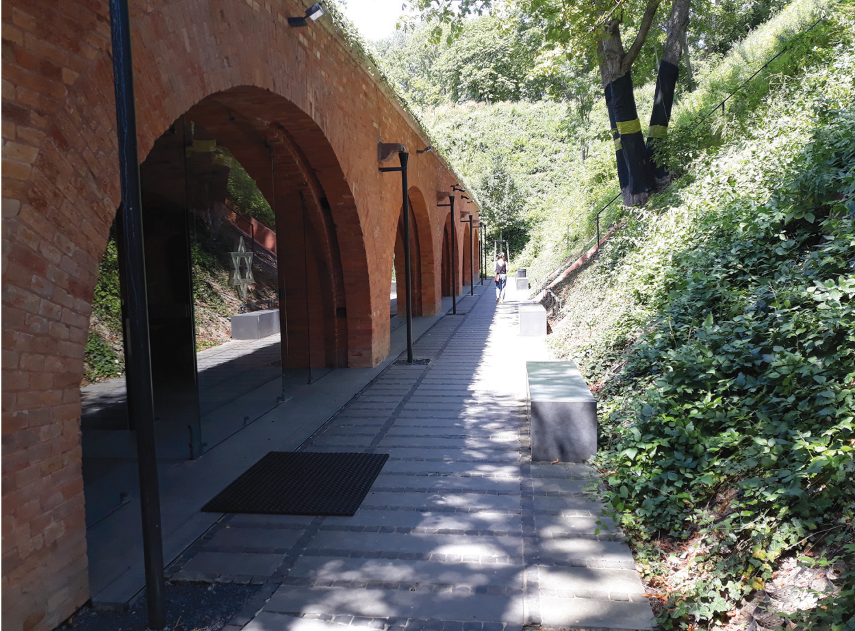
II. 18. Muzeum Katyńskie – Strefa Pamięci w arkadach dawnej baterii bazowej / The Katyn Museum—the Memorial Space in the arcades of the former flanking battery