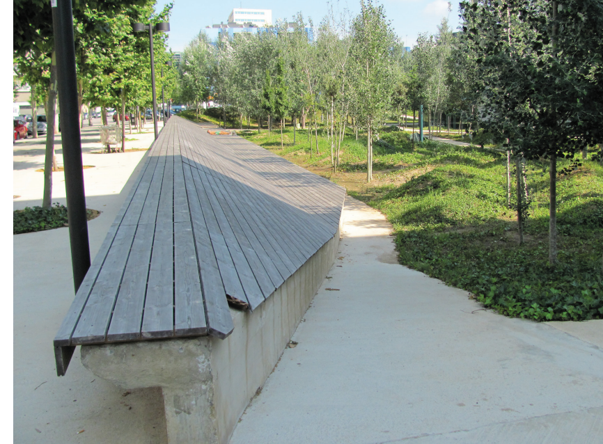
II. 12. Gęsta zieleń ogrodów Miquel Martí i Pol stanowi oazę chłodu w czasie letnich miesięcy / The thick greenery of the Miquel Martí i Pol gardens constitute an oasis of coolness during the summer months