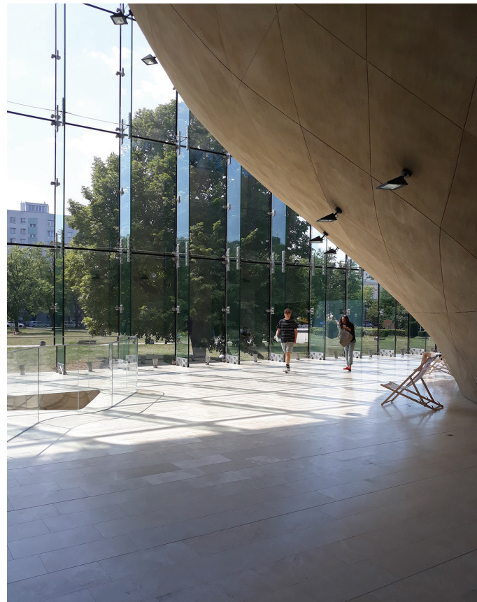
II. 3. Skwer Willy’ego Brandta widziany z muzealnego foyer / Willy Brandt Garden Square seen from the museum’s foyer