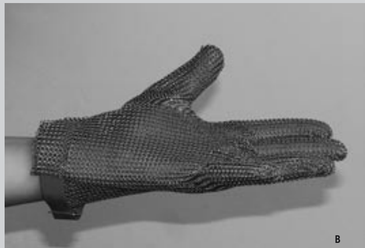
Fot. Rękawice z plecionki pierścieni metalowych: A – z długim mankiem, B – z krótkim mankiem

Fot. Chain-mail gloves A – with long cuff, B – with short cuff