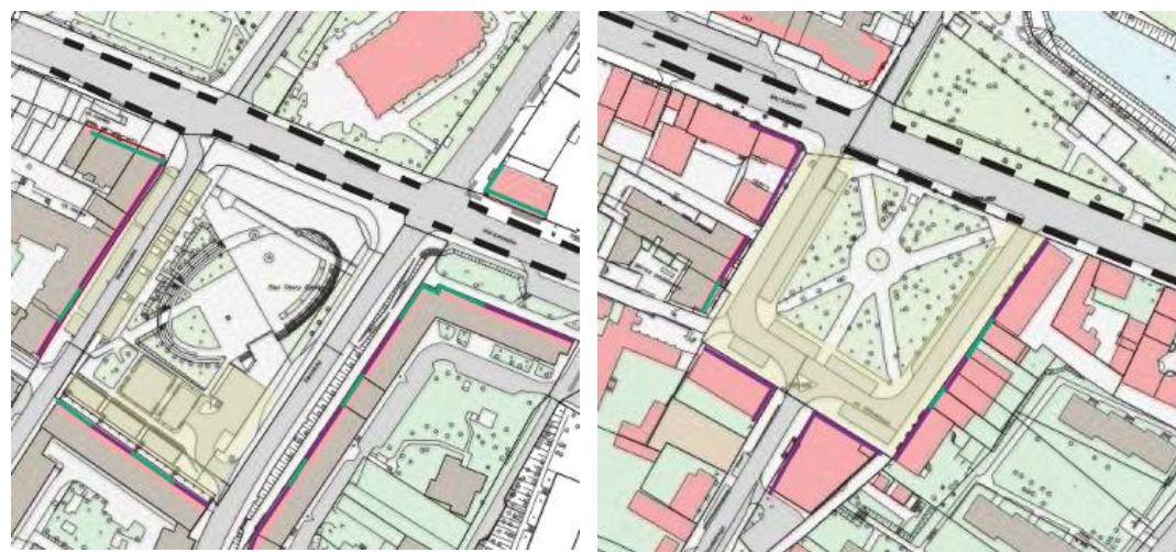
Fig.8 Old Market Square and Kilińskiego Square, Functional inventory of the oldest part of the city, with marked active and passive facades.

Ryc.8. Zagospodarowanie Starego rynku (a) i Placu Kilińskiego (b)- bierne i aktywne fasady.