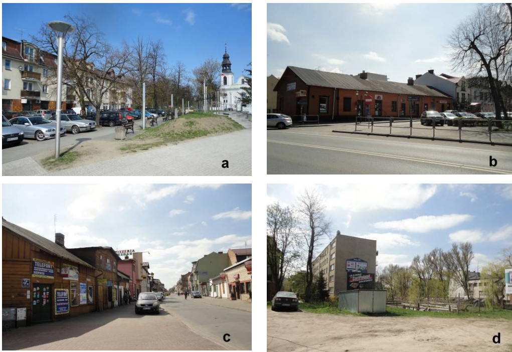
Fig. 7. Old city of Mińsk - a), b) Old Square and Sendomierski Square separated from the park with barriers and cars, c) Exit from ul. Piłsudskiego – spatial chaos, d) Undeveloped 200 m fragment of ul. Warszawska connecting both of the market squares.

tion guidelines for the first plan from 1951 [7, p. 36-38] proposed ascribing different functions to the squares in Mińsk: commercial (Old Market Square), social (Górki Market Square), and administrative (Sendomierz Market Square). The guidelines were not implemented. Three-storey multi-family housing (part in the style of Socialist realism from the 1950's, and a younger part) completes the building development around the square well, although the former parcellation divisions were entirely destroyed. On the east side, the rhythm of the building development imitates them to a certain degree, whereas the west side, constructed in modern times, does not correspond with the former parcellation division. The dominant of the church is preserved on the axis of the square in spite of cutting it off by the national road (Fig. 6). The market square of Renaissance Sendomierz was transformed into a city square in the 19 th century. The building development of the west and partly east side of the market square was destroyed during the war. Right after the war, an additional road connection was introduced running from the south-east corner (currently after constructing a service building here, it was liquidated) (Fig. 6) The pre-war building development emphasising the axial character of the exit from ul. Piłsudskiego (former ul. Karczewskiej) was destroyed, and its remains and new elements with different styles and dimensions cause spatial chaos in this important place (Fig.7c).