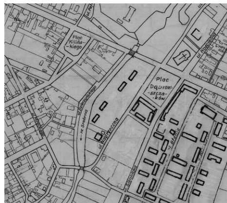
Fig. 5 Fragment of the city plan from 1960 with new multi-family building development introduced in the 1950s.

Ryc. 4 Fragment planu miasta z 1930r. ukazujący zabudowę wokół Rynku Starego i Sandomierskiego.