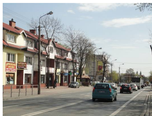
Fig.2 Ul. Warszawska – dominated by cars and dividing the city in half.

Ryc. 1 Ul. Kościuszki - centralna ulica miasta, zabudowa z lat 90. XX w. - brak miejsca dla pieszych.