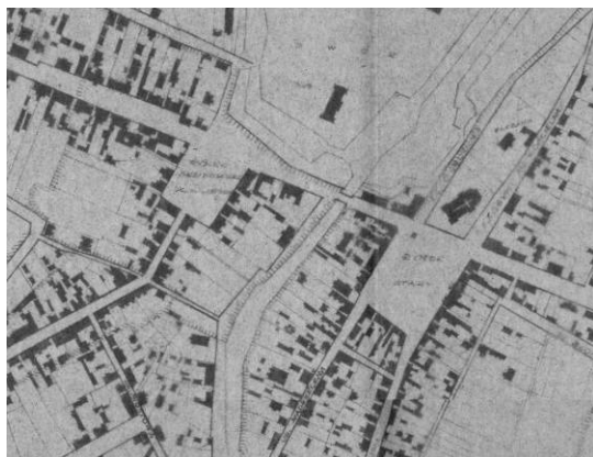
Fig. 4 Fragment of the city plan from 1930, showing building development around the Old and Sandomierski Market Squares.

developed still in the 19th century, the square constitutes the supplementation of the modern city centre, although functions concentrated here do not correspond in terms of importance to those in the pre-war period 6 . The Old Market Square located on the other side of the Srebrna River remained on the side of the centre (Fig. 3, 6, 7a).