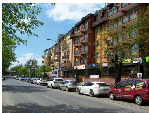
Fig.1 Ul. Kościuszki – central street of the city, building development from the 1990's – no pedestrian areas.

period (unfortunately subject to strong destruction) and modern ones built in different styles. Multi-family and service building development is particularly concentrated in the middle (central) part of the city. They are so-called blocks of flats from the Socialist period, supplemented with buildings constructed after 1990. The modern physiognomy of the city was dominated by multi-family and single-family housing with very diverse dimensions and architectonic style. This results in spatial chaos and lack of individualism (it is particularly visible in the city centre). Streets are dominated by cars, and public spaces are not very friendly for pedestrians (Fig. 1, 2).