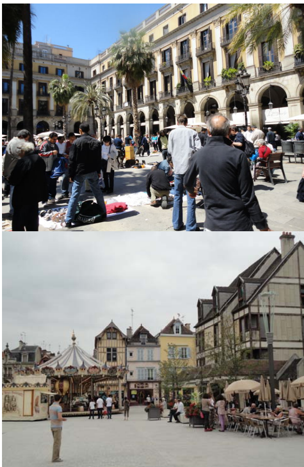
Fig. 9. Forum of urban activity. a) Barcelona st. Jaume Square, b) Trois, Old Market Square.

Modern cities willing to provide their residents with comfort of life and enable conducting diverse social activities must strive for the reactivation of the urban space. Centres of cities and districts are frequently depopulated degraded spaces, particularly if they are historical districts with building development not meeting modern standards, but often reflecting the cultural landscape of the city. Negative accumulated throughout years phenomena in central zones can be corrected as a result of revitalisation works. They lead to the “retrieval of space” for residents and potential tourists [6, p. 52]. Mińsk Mazowiecki is a city with a high potential for development. Its number of residents is continuously growing, and the demographic structure is favourable – dominated by people in the productive age and children – potential users of urban spaces. The discussed market squares cannot be called “degraded space”. On the contrary, attempts of the city authorities to improve the quality of the space are evident. However, activities aimed at the elimination of tedious car traffic and increase of the attractiveness and multi-functionality of the space management are lacking, although necessary for creating friendly urban space [8, p. 236], [3, p. 75]. The development of local urban landscape expressing the specific genius loci of a given place is also of particular importance [10, p. 38].