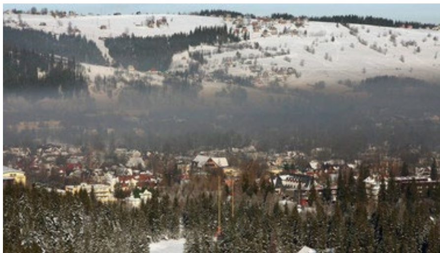
Fig. 3. Rabka-Zdrój

Ryc. 3. Rabka-Zdrój