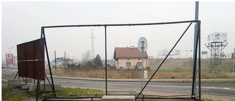
Ryc. 2. Reklamy przydrożne

reklam przydrożnych, a więc tyczy zaledwie czubka góry lodowej. W zakresie szerzej pojmanego lica Ziemi, czyli tego co widać spoza billboardowych „parawanów”, akt ten przynosi korzyści iluzoryczne. Większość zawartych w nowej ustawie pomysłów z powodzeniem zmieściłaby się w zakresie istniejącego systemu prawnego, zwłaszcza w formule planów miejscowych. Ale samorządy zostały beztrąsko zwolnione z ich wykonywania w 1994 roku! Wystarczyło zatem ten obowiązek przywrócić. Wówczas nie byłoby jednak pretekstu, aby chwalić się nową, prokrajobrazową inicjatywą.