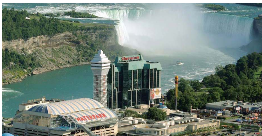
Fig. 1. Niagara Falls