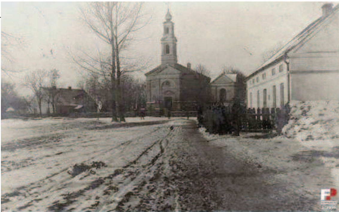
Kościół Parafialny Rzymsko – katolicki pw. Przemienienia Pańskiego w Gizycach z okresu międzywojennego