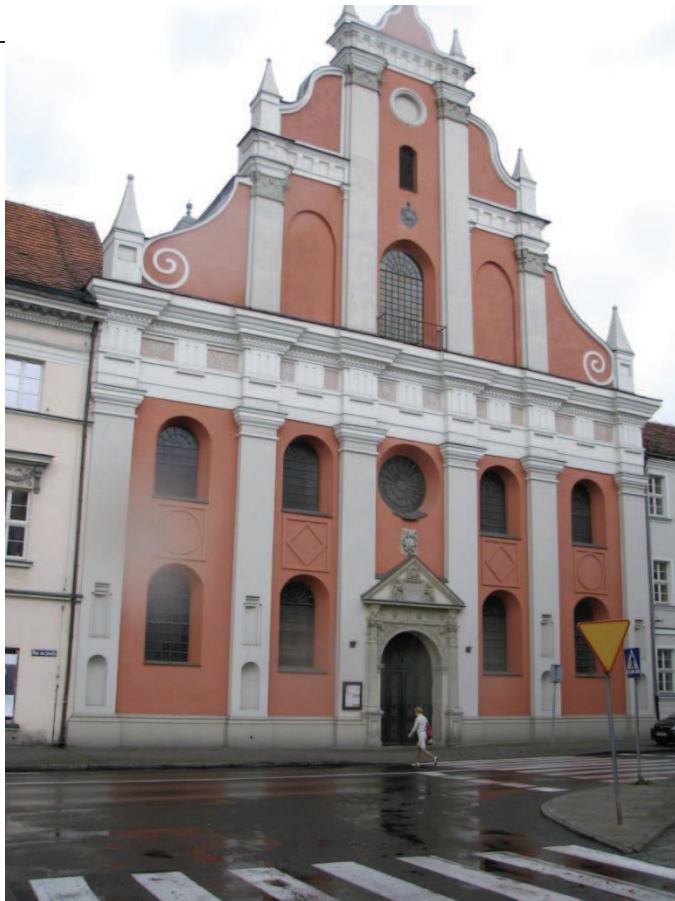
ZŁOTOWANIE ĆRODOWISKA № 12, 2015 — Kościół Garnizonowy w Kaliszu, fot. Z.J. Małecki, kwiecień 2016r.