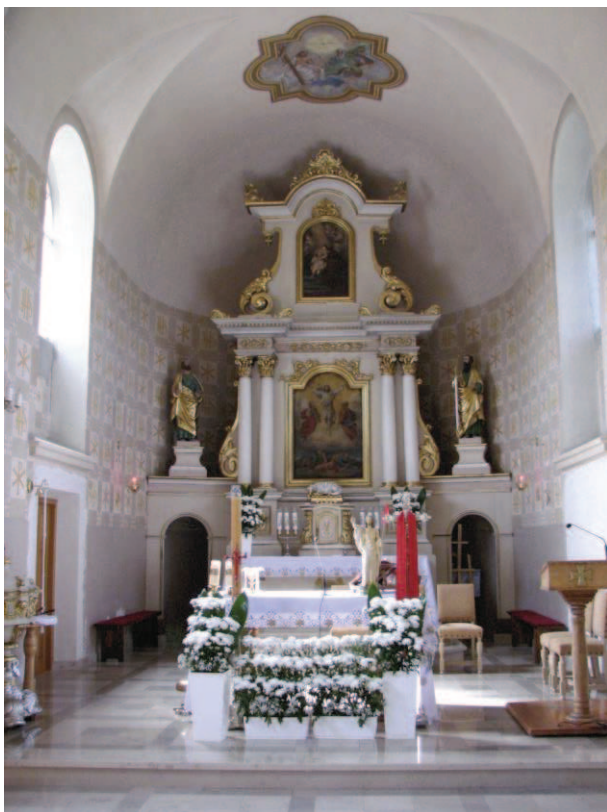
Ołtarz główny w Kościele Parafialnym Rzymsko – katolickim pw. Przemienienia Pańskiego w Gizycach , fot. Z.J. Małecki, kwiecień 2016r.