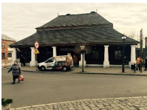
Fig.1. Austeria Inn. Probable date of foundation – 1701. Photo by O. Kania, 2016.

Without a doubt, Sławków constitutes one of the oldest and most important, from a historical point of view, towns of southern Poland. The priceless historical monuments of the land of Sławków include the medieval urban layout, with a centrally located market with a square floor plan. The buildings that surround it are from later times, while the oldest preserved historical structure in the area of the market square is the inn – the Austeria (fig. 1, 2), which is dated to the year 1701. Other significant structures, which are a testament to the many centuries of the history of the grod on the Biała Przemsza river, are the ruins of the castle and the church.