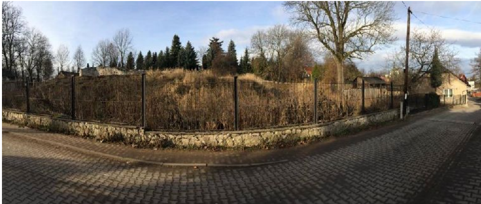
Fig. 4. Castle Hill.

The most important evidence of the reign of the bishops of Kraków in Sławków is the castle (fig. 4), which has not survived, and the construction of which is estimated to have occurred in the XIII century. Its construction was initiated by the bishops of Kraków, of whom we can single out Paweł of Przemanków. The original castle was probably 123 by 90 m, and had a floor plan in the shape of an irregular rectangle. The walls had a thickness of between 2 m – 3 m and a height of around 7 m [Pierzak 2002: passim ].