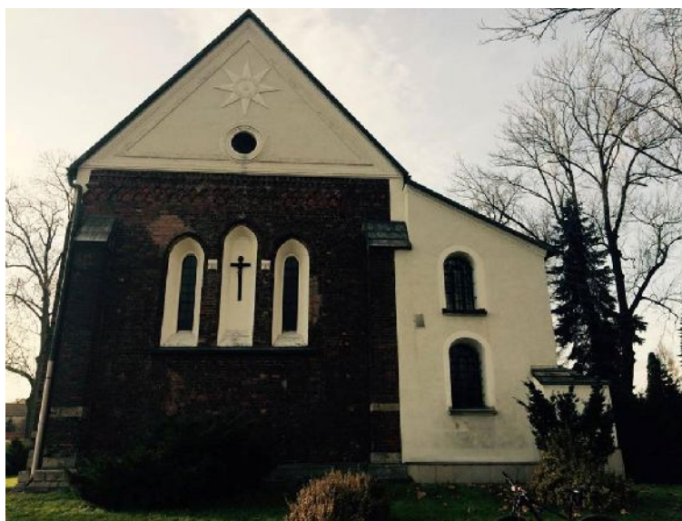
Fig. 3. Church of St. Nicholas. View on the medieval chancel. Photo by O. Kania, 2016.

The Church of St. Nicholas is a very important preserved element of the historical pedigree of the lands of Sławków. This structure is from the XIII century. The appearance of these types of building was invariably linked with the aforementioned transformation from a village into an urban centre. It is highly probable that the site of the church was previously occupied by a timber religious structure. The presbytery of the church (fig. 3), with a rectangular shape, is dated to pre-incorporation times, which is attested by the use of the following architectural details – brick was used in the construction of its walls, while the vaulted ceilings and plinths were made from stone, the eastern facade features a grouping of three windows, of which the central one is positioned slightly higher. In addition, decorative elements, such as friezes, cornices, and the pattern of the bricks within the wall that is typical of the turn of the XIII century (two facing with the side, one facing with the front), attest to its resemblance to monastic churches, the construction of which is also dated to the XIII Century (Sandomierz, Mogiła) [Szydłowski 1928:93-95].