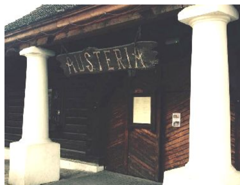
Fig. 2. Austeria. View of the façade with arcades from the market side.

Ryc. 1. Karczma Austeria, której powstanie datuje się na 1701 rok.