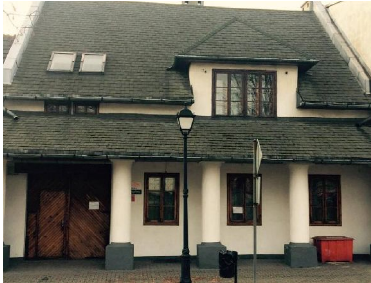
Fig. 6. Arcade house in Sławków. A house in the southwestern part of square.

should also mention the second oldest building of Sławków's historical urban tissue – the castle of the bishops of Kraków and the castle hill itself, featuring the remains of the medieval fortification system. The shape of the castle hill, with elements of the moat and fragments of the defensive walls, has survived to this day in the area of Browarna, Staropocztowa and Zamkowa streets.