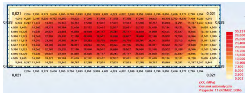
Rys. 4. Naprężenia – szyba GL 2 1430 x 4900 (66.2); kombinacja obciążeń: ciężar własny (wsp. bezp. 1,10), siła pozioma (wsp. bezp. 0,66), ssanie wiatru (wsp. bezp. 1,10), ssanie wewnętrzne (wsp. bezp. 0,66), ciśnienie izochoryczne (wsp. bezp. 0,66)