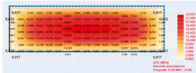
Rys. 3 Naprężenia – szyba GL 2 1430 x 4900 (66.2); kombinacja obciążeń: ciężar własny (wsp. bezp. 1,10), siła pozioma (wsp. bezp. 0,66), parcie wiatru (wsp. bezp. 1,10), ssanie wewnętrzne (wsp. bezp. 0,66), ciśnienie izochoryczne (wsp. bezp. 0,66)

Symulacja ugięć i naprężeń dla omawianej szyby zastosowanej w segmencie ściany ostłonowej wraz z podaniem częściowych współczynników bezpieczeństwa przyjętych do kombinacji obciążeń: