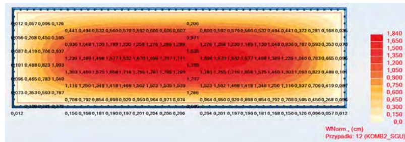
Rys. 6. Ugięcia – szyba GL 2 1430 x 4900 (66.2); ciężar własny (wsp. bez. 1,0), siła pozioma (wsp. bez. 0,2), parcie wiatru (wsp. bez. 0,9), parcie wewnętrzne (wsp. bez. 0,2), ciśnienie izochoryczne (wsp. bez. 0,2)