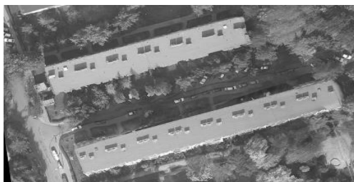
Rys. 2. Fragment ortofotomapy, dla której wykorzystano do ortorektyfikacji NMPT z wszystkich punktów skaningu laserowego o gęstości 16 \text{ pkt/m}^2 .

Dla dużej gęstości skanowania laserowego ( 16 \text{ pkt/m}^2 - odpowiedź co około 6cm), podobnie jak w przypadku danych o mniejszej gęstości nie wystarczy do wykonania przetwarzania true ortho zastosowanie danych wejściowych do modelu w postaci gęstej chmury surowych punktów laserowych. Gołym okiem widać bowiem na fragmencie ortofotomapy mankamenty tego rozwiązania: poszarpane krawędzie dachów, pofalowana droga pomiędzy budynkami, oraz nienaturalnie rozmazane korony drzew (Rys. 2). Takie true ortho jest również nie do zaakceptowania.