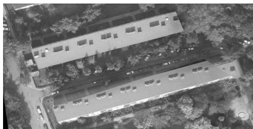
Rys. 1. Fragment ortofotomapy, dla której wykorzystano do ortorektyfikacji NMT z punktów skaningu laserowego o gęstości 16pkt/m 2 (podobny wynik uzyskano dla gęstości 1.5pkt/m 2 ).

Dla obszarów zabudowanych, niezależnie od gęstości danych laserowych będących podstawą do obliczeń NMT, na obu fragmentach ortofotomapy widoczne są identyczne przesunięcia radialne dachu budynku w stosunku do podstawy, oraz linia szwu sztucznie przebiegająca przez budynek, spowodowana automatycznym mozaikowaniem (Rys. 1). Widać, że nawet duża gęstość skanowania laserowego, rzędu 16 pkt/m 2 nie gwarantuje poprawnego wyglądu budynków na ortofotomapie, co w znaczącym stopniu obniża jej jakość i staje się, szczególnie dla wielkoskalowego produktu dużym mankamentem.