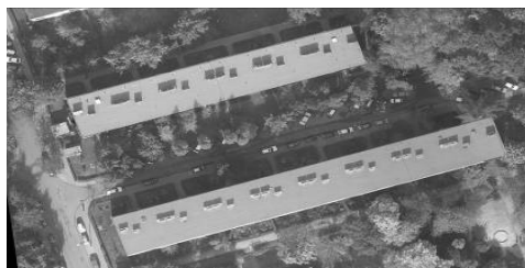
Rys. 4. „Prawdziwa” ortofotomapa z danych laserowych o gęstości 16 pkt/m 2 powstała w oparciu o NMT oraz Model Budynków z automatyczną ekstrakcją krawędzi.

Oprogramowanie TerraPhoto, które posłużyło do przeprowadzenia ortorektyfikacji, daje możliwość automatycznego generowania wektorów - krawędzi budynków. Szukane krawędzie są interpolowane z punktów zakwalifikowanych do warstwy „ building ”. Dla porównania wyników przeprowadzono wstępną ekstrakcję krawędzi budynków dla próbek o różnych gęstościach. W przypadku pierwszego projektu krawędzie nie do końca zostały poprawnie wykryte. W wyniku zbyt małej gęstości punktów wykryta krawędź jest linią o licznych załamaniach skierowanych w głąb dachu budynku. W tym przypadku do prawidłowego zrektyfikowania obiektu konieczna jest korekta manualna. W przypadku drugiej próbki, gdzie gęstość danych była około 14 razy większa, widać znaczną poprawę wykrycia krawędzi: linia jest prosta, przebiegająca wzdłuż brzegu dachu, może więc być uwzględniona w ortorektyfikacji. Ostatecznie „prawdziwa” ortofotomapa została wykonana na podstawie punktów należących do NMT, oraz wybranych punktów NMPT opisujących jedynie budynki, z automatycznie wykrytymi krawędziami dachów. Widać wyraźnie, że zwiększenie gęstości danych wpłynęło w dużym stopniu na jakość i automatyzację generowania true ortho .