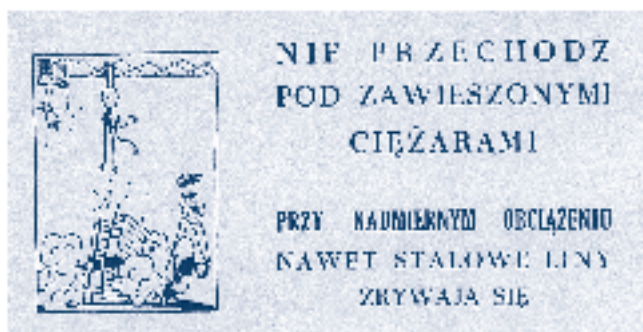
Rys. 3.

Prawdziwą kopalnią wiedzy na temat bogactwa form popularyzatorskich są roczniki miesięczników „Ochrona Pracy” i „Przyjaciel przy Pracy”. Można w nich przeczytać informacje o różnych konkursach – na najlepszy plakat czy na pomysły racjonalizatorskie. Nagradzane prace stanowią swoistą galerię najlepszych plakatów i rysunków z dziedziny bhp (rys. 4).