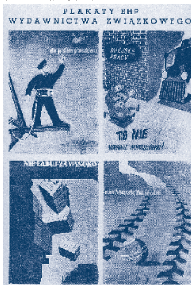
Rys. 4.