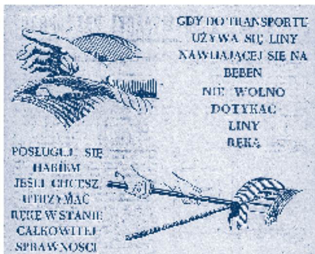
Rys. 2.

Do szkoleń i instruktażu robotników z zakresu bezpieczeństwa i higieny pracy przywiązywano dużą wagę. Zdawano sobie sprawę z tego, że przekazywane treści muszą być jasne, przejrzyste, łatwo i szybko trafiające do robotników (rys. 2).