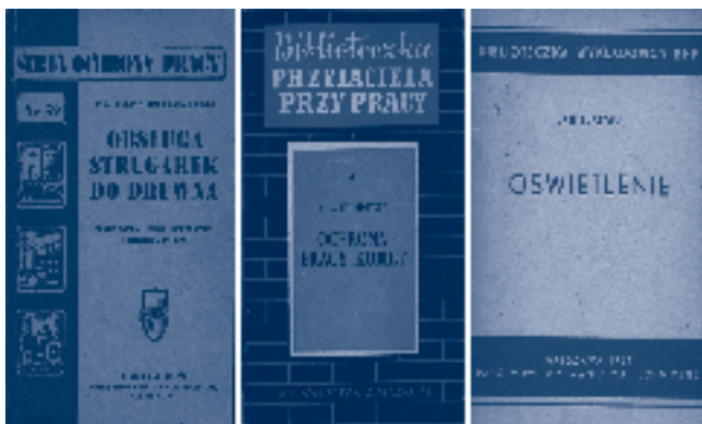
Fot. 1. Okładki ze zbiorów biblioteki CIOP-PIB z lat 50.

W szkoleniach nieocenioną pomocą były publikacje wydawane przez Wydawnictwo Związkowe, Państwowe Wydawnictwa Techniczne, Państwowy Zakład Wydawnictw Lekarskich, Zakład Wydawniczy Ministerstwa Pracy i Opieki Społecznej w znanych seriach (fot. 1.).