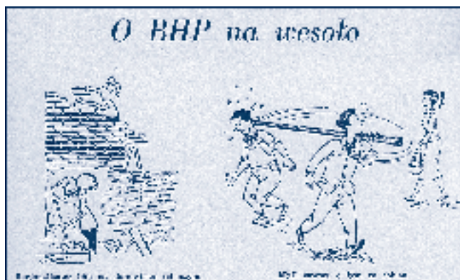
Rys. 6. Źródło „Przyjaciel przy Pracy”, 1958

Aby czytelnikom ułatwić dotarcie do jakże ciekawych publikacji, które z racji daty wydania nazywamy mianem historycznych i doceniając ich znaczenie dla rozwoju dziedziny jaką jest bezpieczeństwo i ochrona zdrowia człowieka w środowisku pracy, w bibliotece CIOP-PIB są prowadzone prace mające na celu retrokonwersję kart katalogowych. Oznacza to, że za pomocą Internetu czytelnicy będą mogli uzyskać informacje o wydawnictwach z lat 1950 – 1970 i wcześniejszych (rys. 7.).