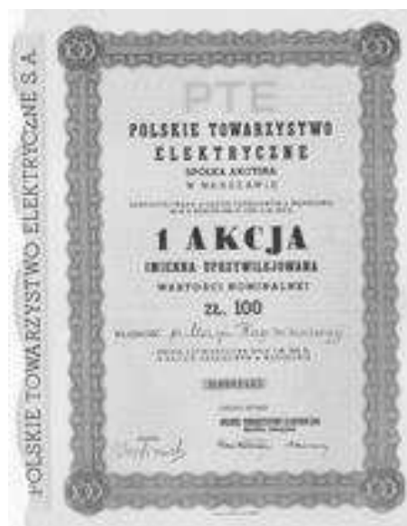
Rys. 7. Akcja imienna, uprzywilejowana (PTE)