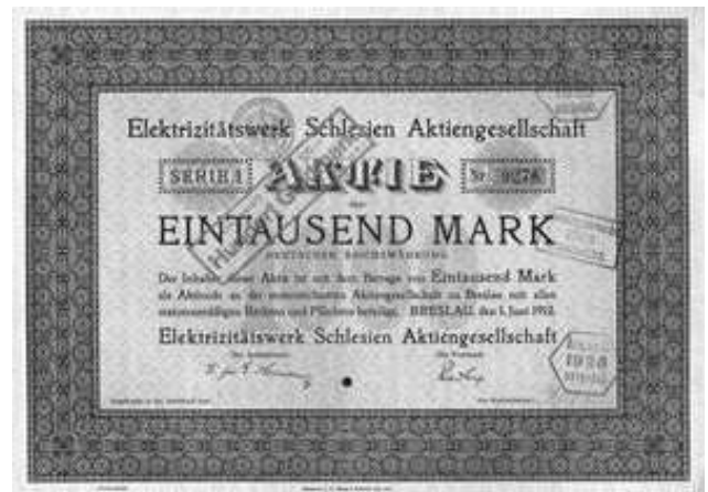
Rys. 12. Rekordzista wśród akcji energetycznych. Ukazuje ponad 150 serii emisji tych akcji (Elektrizitätswerk Schlesien AG).

Kolejny problem, to jakie zbierać papiery wartościowe. Mogą to być akcje, obligacje, notgeldy, znaczki pocztowe i banknoty z wizerunkiem elektrowni.