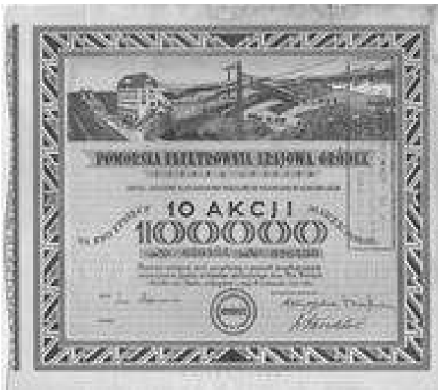
Rys. 4. Pomorska Elektrownia Krajowa Gródek , akcja zbiorowa 10x10000 mkp

Trzy zabory, to również trzy waluty używane w niepodległej Polsce. Pogłębia o to zamieszanie walutowe na rynku. Stąd też pojawiają się akcje ułamkowe przy przejściu np. z koron austriackich na marki polskie a później na złote. Współczesne prawodawstwo nie dopuszcza dzielenia akcji na części.