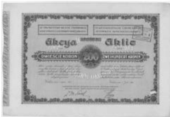
Rys. 1. Akcja Elektrowni Siła i Światło – wtedy jako Towarzystwo Akcyjne Zachodnio-Galicyskich Elektrowni Okręgowych, wybudowana z kapitałów polskich i austriackich, 1913r.

Akcje to jeden z rodzajów papierów wartościowych. Wydawane przez spółki akcyjne obrazujące kapitał zakładowy firmy. Właściciel takiego papieru staje się kapitalistą i mając nawet tylko jedną akcję ma takie same prawa jak właściciel sporego udziału w spółce. Po odzyskaniu przez Polskę niepodległości w 1919 roku pierwszą utworzoną spółką akcyjną była firma energetyczna Siła i Światło, zarejestrowana w Sądzie Okręgowym w Warszawie, Rejestr, dział B, nr 97, w dniu 30.04.1919 roku. Wcześniej, w okresie zaborów, spółki energetyczne tworzone były przeważnie z udziałem kapitałów innych niż polskie.