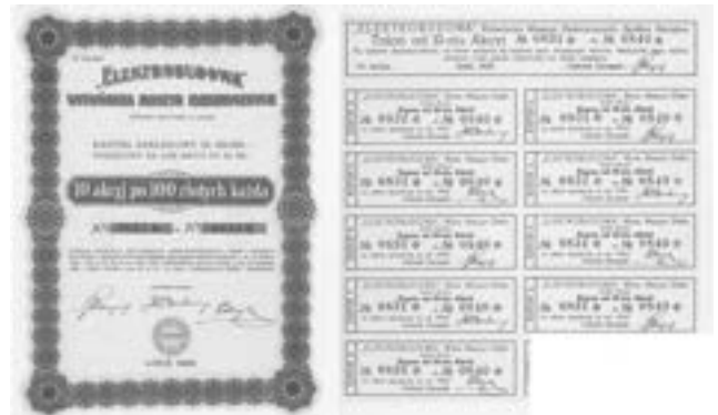
Rys. 11. Elektrobudowa Wytwórnia Maszyn Elektrycznych.

Mamy koncerny, które skupiają kilka elektrowni, mamy banki, bądź przedsiębiorstwa, które budują i eksploatują, a przez jakiś czas je eksploatowały. Osobną działy kolekcjonerów są przedsiębiorstwa elektrotechniczne. Jak to pogodzić.