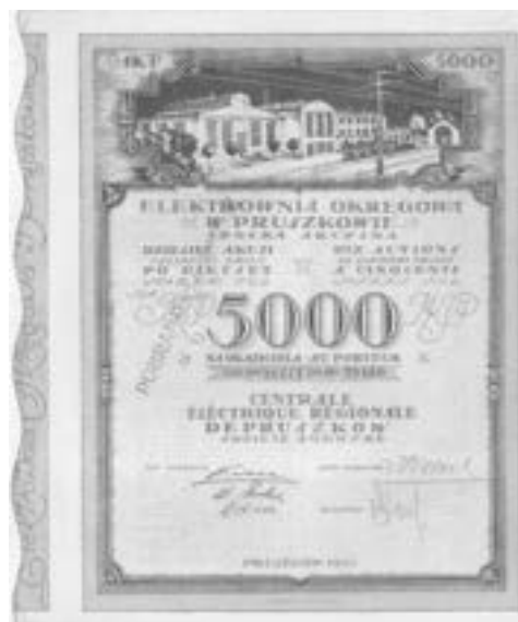
Rys. 3. Elektrownia Okręgowa w Pruszkowie, akcja zbiorowa 10x500 mkp, zwraca uwagę budynek elektrowni, linia przesyłowa i trakcja elektryczna.

Pierwsze akcje wydawane były przez elektrownie, koncerny miały swój indywidualny charakter, często z elementami energetycznymi.