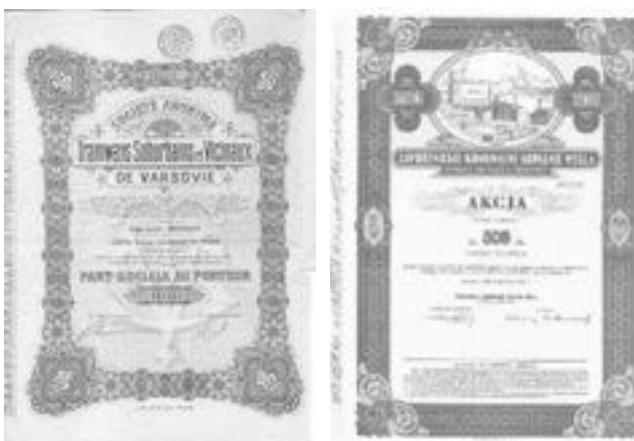
Rys. 10. Warszawskie tramwaje oraz Jaworznickie Komunalne Kopalnie Węgla z rysunkiem elektrowni znanej później jako Jaworzno I.

Jak klasyfikować przedsiębiorstwa energetyczne to dylemat kolekcjonera tych walorów. Oprócz tzw. elektrowni zawodowych (wtedy okręgowych) mamy też elektrownie przemysłowe, kopalniane, tramwajowe.