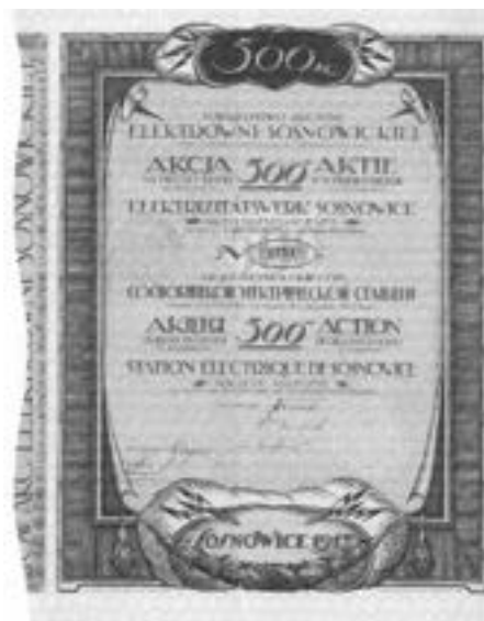
Rys. 2. Akcja elektrowni sosnowieckiej o nominale 500 rubli z 1917 roku

Pierwsze akcje wydawane były przez elektrownie, koncerny miały swój indywidualny charakter, często z elementami energetycznymi.