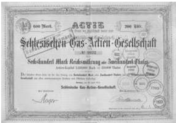
Rys. 9. Pieczęć wypłaty dywidend (Schlesischen Gas AG, z pieczęcią nowej nazwy firmy Elektrizität und Gas A.G. Breslau)

Innym sposobem potwierdzania wypłaty dywidendy było opieczutowanie obrazu akcji.