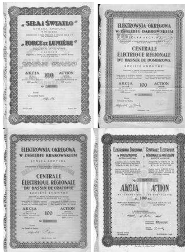
Rys. 6. Elektrownie wchodzące w skład koncernu Si i Światło

Wraz ze zmianą w właścicieli, przejmowaniem elektrowni przez koncerny energetyczne, zmienia się obraz akcji. Były one ujednolicane, drukowane wg podobnego wzoru. Pojawiają się znaki wodne, suche pieczęcie, ozdobne bordiury - dekoracyjne obramowanie kompozycji graficznej, w formie pasa z ornamentem geometrycznym.