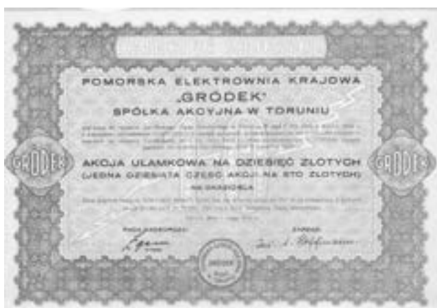
Rys. 5. Akcja ułamkowa Pomorskiej Elektrowni Krajowej Gródek , 1/10 akcji, z podpisem A. Hoffmana.

Trzy zabory, to również trzy waluty używane w niepodległej Polsce. Pogłębia o to zamieszanie walutowe na rynku. Stąd też pojawiają się akcje ułamkowe przy przejściu np. z koron austriackich na marki polskie a później na złote. Współczesne prawodawstwo nie dopuszcza dzielenia akcji na części.