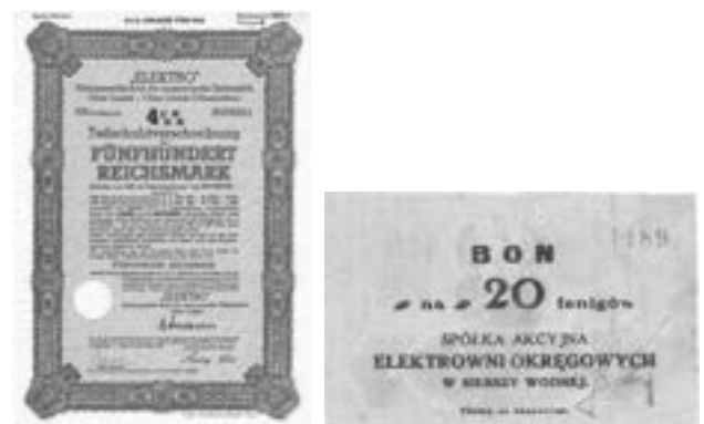
Rys. 13. Obligacja Firmy Elektroaziska Górne. Pieniądz zastępczy notgeld Elektrowni Siersza Wodna.

Kolejny problem, to jakie zbierać papiery wartościowe. Mogą to być akcje, obligacje, notgeldy, znaczki pocztowe i banknoty z wizerunkiem elektrowni.