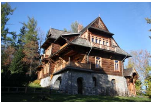
Ryc. 4. Pierwszy dom wybudowany w stylu zakopiańskim „Koliba”.

Fig. 3. Traditional residential building in Zakopane, Kościeliska street.