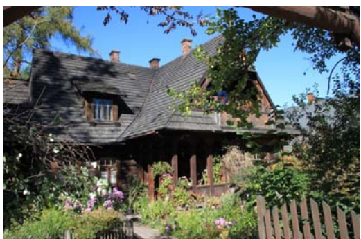
Ryc. 5. Budynek mieszkalny w stylu witkiewiczowskim w Zakopanem, ul. Kościeliska.

Fig. 4. „Koliba” – first house built in Zakopane style.