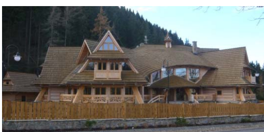
Ryc. 17. Współczesny budynek mieszkalny w Zakopanem, – Kościelisko – poszukiwanie współczesnych form budownictwa tradycyjnego.

Fig. 16. Contemporary residential building in Zakopane, Kościelisko – searching for modern forms of traditional building.