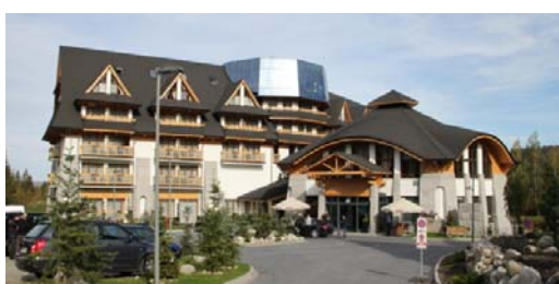
Ryc. 18. Współczesny budynek hotelowy w Zakopanem, Jaszczurówka – nawiązanie do tradycji, połączenie nowoczesności z tradycją.

Fig. 17. Contemporary residential building in Zakopane Kościelisko – searching for modern forms of traditional building.