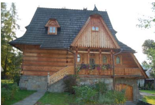
Ryc. 6. Współczesny budynek mieszkalny nawiązujący do stylu witkiewiczowskiego w Zakopanem.

Fig. 5. Residential building in „Witkiewicz” style in Zakopane, Kościeliska street.