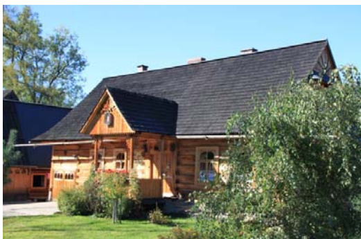
Ryc. 3. Tradycyjny budynek mieszkalny w Zakopanem, ul. Kościeliska.

Fig. 3. Traditional residential building in Zakopane, Kościeliska street.