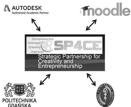
Rys. 1. Schemat współpracy partnerów projektu SP4CE

W projekcie uczestniczyli przedstawiciele dwóch uczelni wyższych – Politechniki Gdańskiej oraz Gdańskiego Uniwersytetu Medycznego, a także pracownicy kilku firm zewnętrznych, które zajmują się szkoleniami i certyfikacją. Schemat współpracy w oparciu o narzędzia e-learningowe został przedstawiony na poniższym rysunku. (Rys. 1.).